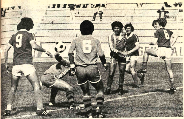
ATAKA MUNICIPAL. - Una de las numerosas cargas del equipo "edil" que ayer goleo a 20 de Agosto por 10 a 1 y logró clasificarse para la fase final del Campeonato de la Liga