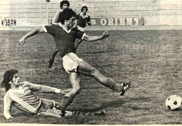
GOL DE BERRIOS. - El puntero derecho "edil" obtiene la quinta conquista para su equipo anticipándose a la acción de un

Esta noche en una reunión ordinaria de la Federación Boliviana confirmará en forma oficial la delegación.