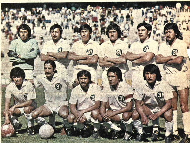
CAMPEON DE LA ASOCIACION DE FUTBOL DE LA PAZ.- Equipo de 31 de Octubre, que el sábado se clasificó campeón del torneo de la Asociación de Fútbol de La Paz en Primera "A".