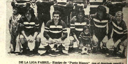
DE LA LIGA FABRIL. - Equipo de 'Punto Blanco', que el domingo venció a Destierra y se colocó en el segundo puesto de la segunda división de ascenso de la Liga Fabril.

Hrs. 19. Coricoa v. Yanacachi. Hrs. 10 - Irupe. Hrs. 11. Chamli. Hrs. 12. Chamli Ocobaya.