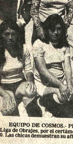
Equipo de Cosmos. Plantel de Cosmos, que actúa en el certamen de la Liga de Chables, muestra su actitud por el fútbol.

Plantel de Cosmos, que actúa en el certamen de la Liga de Chables, muestra su actitud por el fútbol.