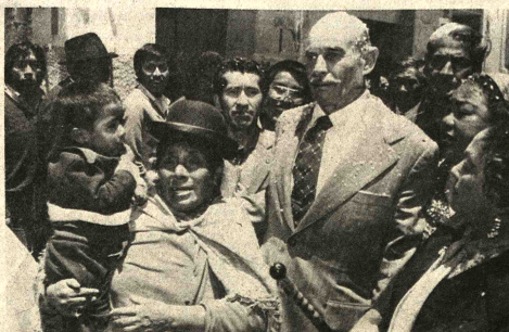
Afecto popular al líder Dr. Walter Guevara Arze