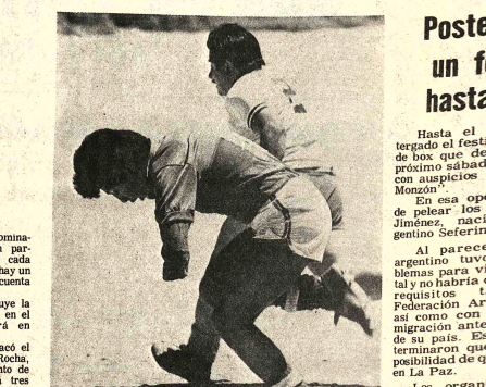
Postergo un festejo hasta el día. Hasta el día Colgado el festival de box que debía ser próximo sábado con auspicios del 'Monzón'.

Tal como anunció en las últimas horas, el Secretario General de Deportes, mantendrá la reunión de la comisión bipartita del fútbol.