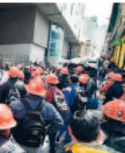
vilización de fabriles en la Asamblea Legislativa.