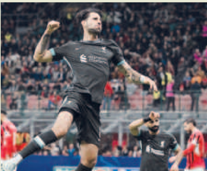
El gol diferencia será importante para definir los empates en la Liga de Campeones.