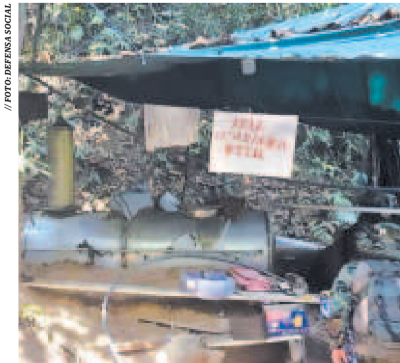
Un megalaboratorio de cocaína es destruido en el Chapare cochabambino.

Dijo que se secuestraron 206 avionetas, se destruyeron 287 pistas clandestinas utilizadas por estas organizaciones criminales.