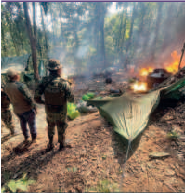
Destrucción de una fábrica de droga en el Chapare.