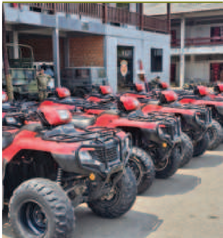
Más de 20 cuadratracks reforzarán la lucha contra los incendios forestales.