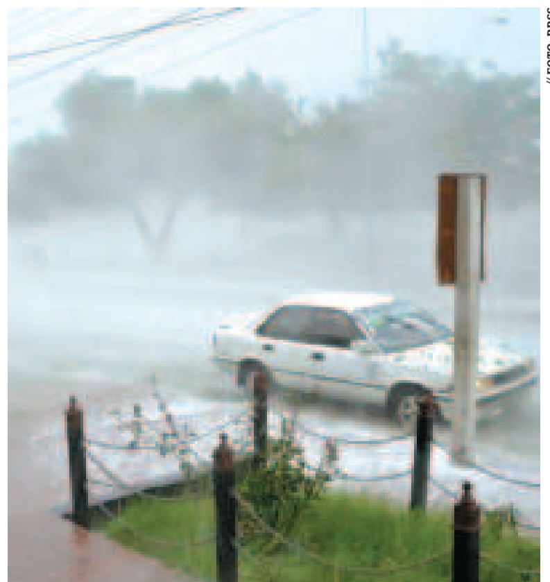
En algunas regiones del país se esperan precipitaciones entre débiles y moderadas.

Además, Mamani destacó que el ingreso del frente frío, con lluvias y tormentas eléctricas, el pasado fin de semana, ayudó a formar “líneas de inestabilidad” para mitigar los focos de calor en el país, que se redujeron de 73.000 a 1.894.