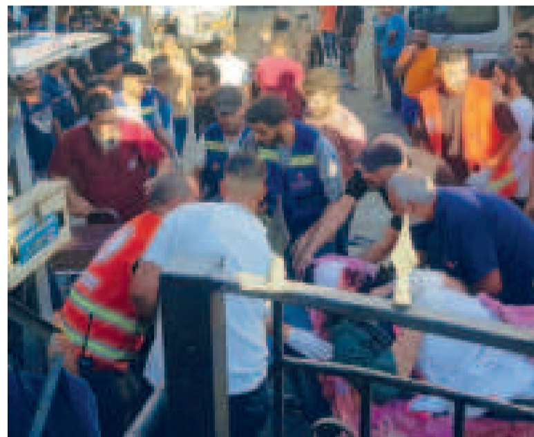
Emergencia. Una persona herida en medio de su traslado a un hospital.