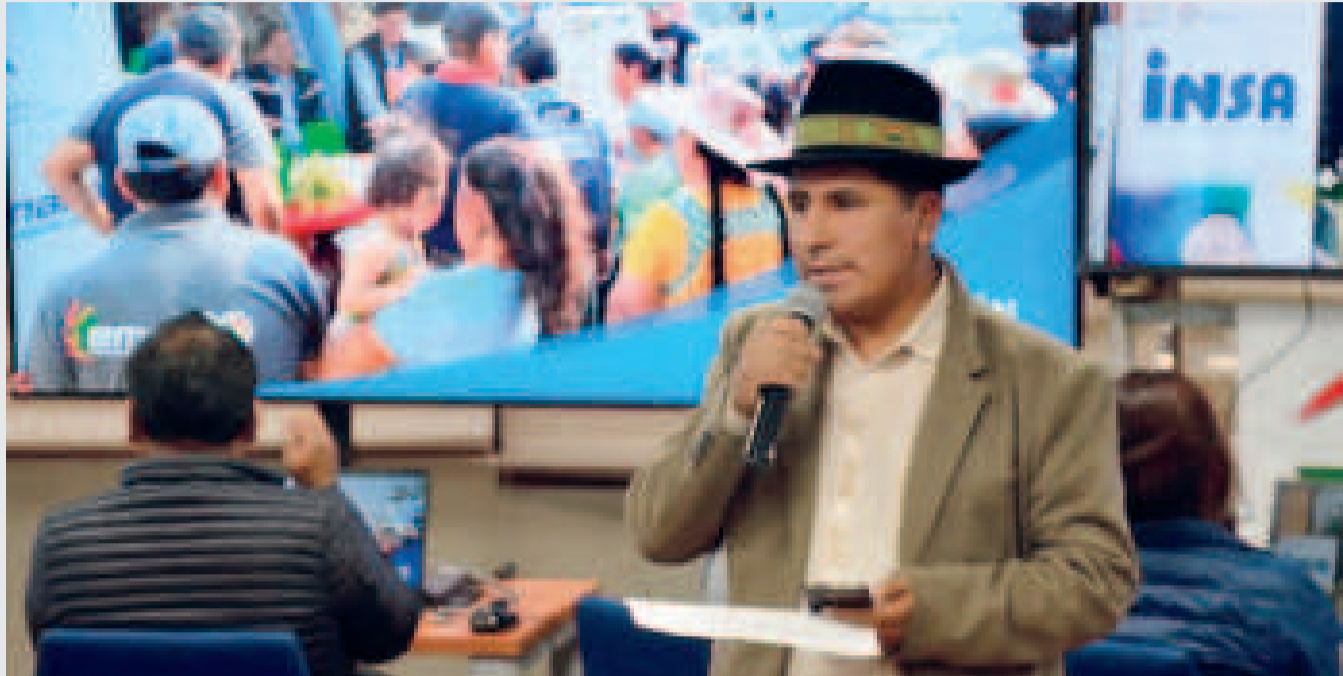
El viceministro de Desarrollo Agropecuario, Álvaro Mollinedo, en conferencia de prensa.

Afirmó que para mitigar esta afectación se utilizarán diversas rutas alter-