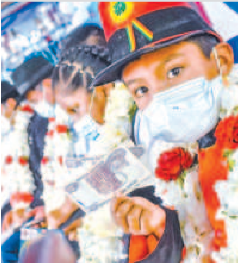
Un estudiante beneficiario del Bono Juancito Pinto.