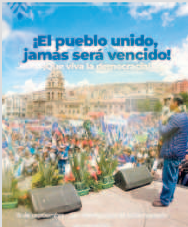
El presidente Luis Arce se dirige a los sectores sociales en un evento en 2023.