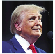
El candidato republicano

Venezuela rechazó la imposición de nuevas sanciones a funcionarios del gobierno.