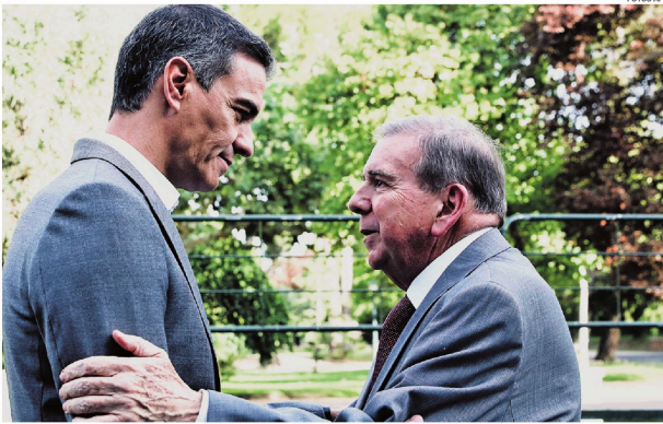
El jefe del Gobierno español recibió ayer al candidato opositor venezolano Edmundo González Urrutia