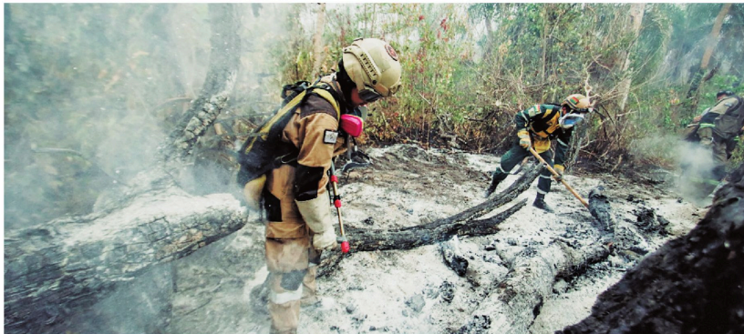
Los bomberos trabajan en zona de incendios en el municipio de Concepción, donde se han intensificado las operaciones