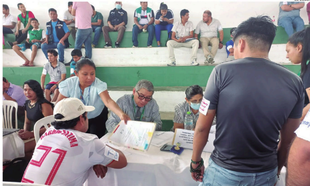
Los internos se entrevistaron con los jueces para contar sus historias y el estado de sus causas penales

Los reclusos que no tienen abogados aseguraron que están sin recursos y, muchos, abando-