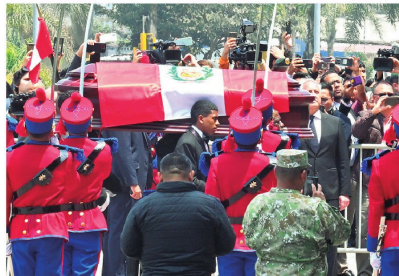
Los restos del exmandatario reciben los honores en Lima

Tenía 86 años y en diciembre había sido indultado por razones humanitarias cuando cumplía una condena por homicidio, secuestro y otros graves