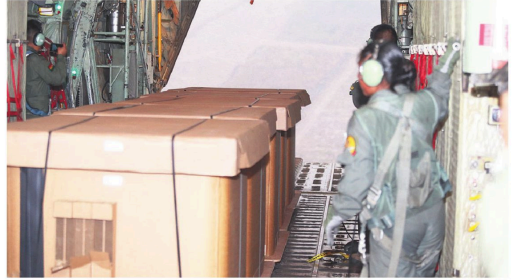
Algunas de las cajas con agua que fueron lanzadas sobre uno de los incendios