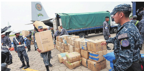
Efectivos del Ejército trasladan la ayuda humanitaria hasta los lugares afectados por los incendios