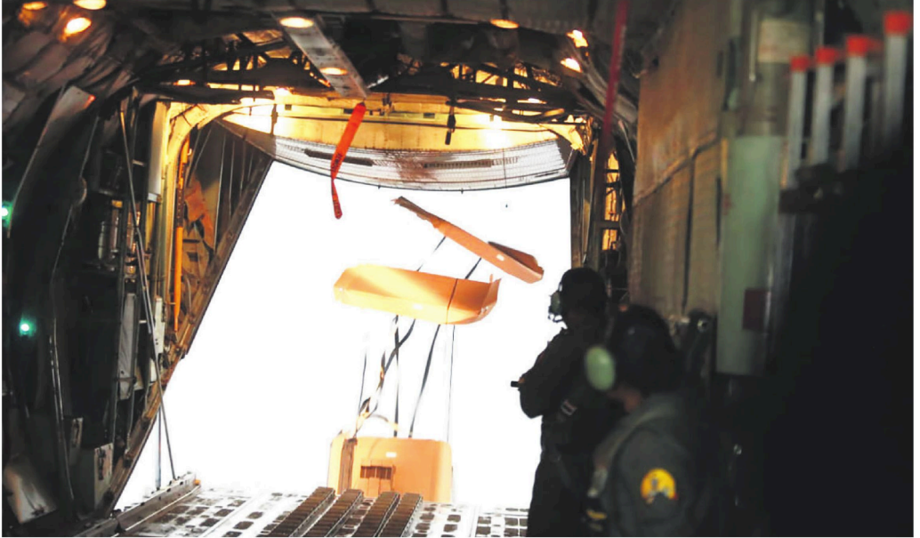
Las descargas que se realizaron este jueves. Se movilizaron dos aviones Hércules que llevaron los contenedores de agua que fueron lanzados desde el aire