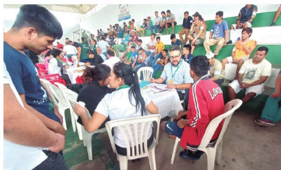
Muchos de los privados de libertad dijeron que están abandonados

Podrán participar en la Asamblea, en forma personal o mediante apoderado, los Tenedores de Bonos Toyosa IV - Emisión 1 que hagan constar su derecho propietario sobre cada Bono Toyosa IV - Emisión 1 con un día de anticipación al día de la celebración de la Asamblea y cuyo nombre figure en los registros de la Entidad de Depósito de Valores de Bolivia S.A. Los tenedores deberán acreditar su personería mostrando el Certificado de Acreditación de Titularidad (CAT) emitido por la Entidad de Depósito de Valores de Bolivia S.A. Los tenedores o sus apoderados deberán portar sus cédulas de identidad. Los apoderados de los Tenedores deberán presentar además el poder suficiente que acredite su condición.