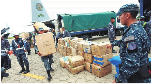
El Gobierno entregó ayuda humanitaria en ocho municipios cruceños