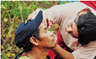
Las brigadas médicas asisten a pobladores en las comunidades

Información y Comunicación de la Gobernación, la lluvia fue sectorizada y no llegó a todos los municipios que están siendo golpeados por los incendios forestales.