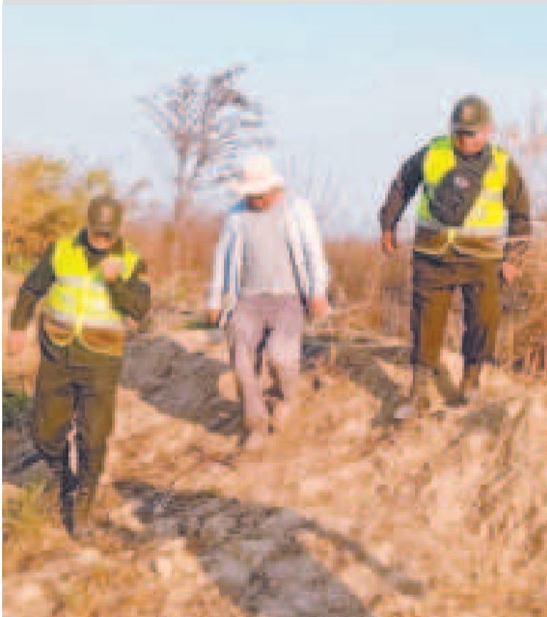
La ABT ejecuta controles para sancionar a los autores de los incendios.