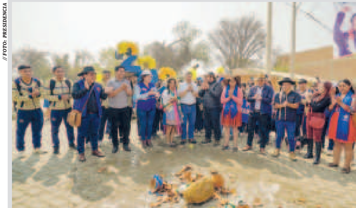
La inauguración de una obra de enlosetado en Cochabamba.

“Queremos felicitar al pueblo cochabambino por su efeméride de 214 años, y es que para esta gestión el Presidente (Luis Arce) me instruyó invertir más de 1.447 millones de bolivianos”, destacó la autoridad en conferencia de prensa.