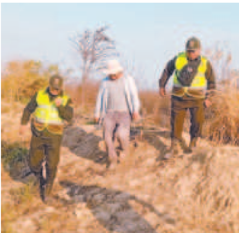
Policía hace un riguroso control de incendios en el país.