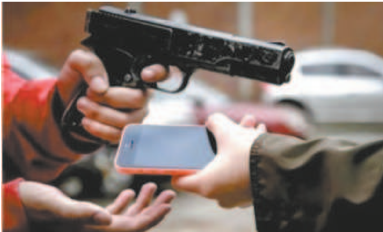
El robo con arma de fuego está por detrás del robo con arma blanca, según un estudio sobre seguridad ciudadana.