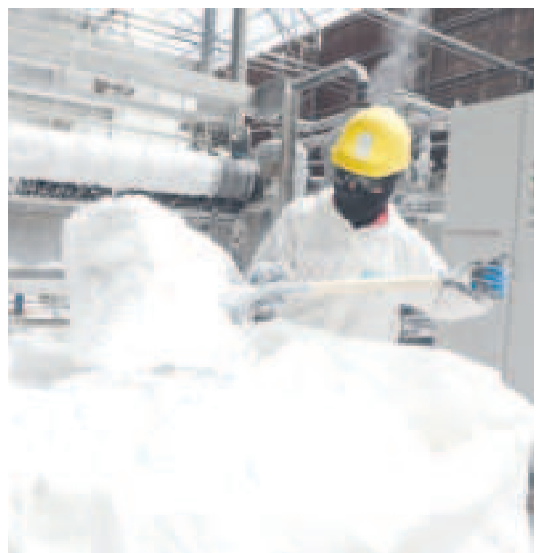
El tratamiento de carbonato de litio.

“Estas tecnologías son óptimas porque tienen reciclados de agua y, en com-