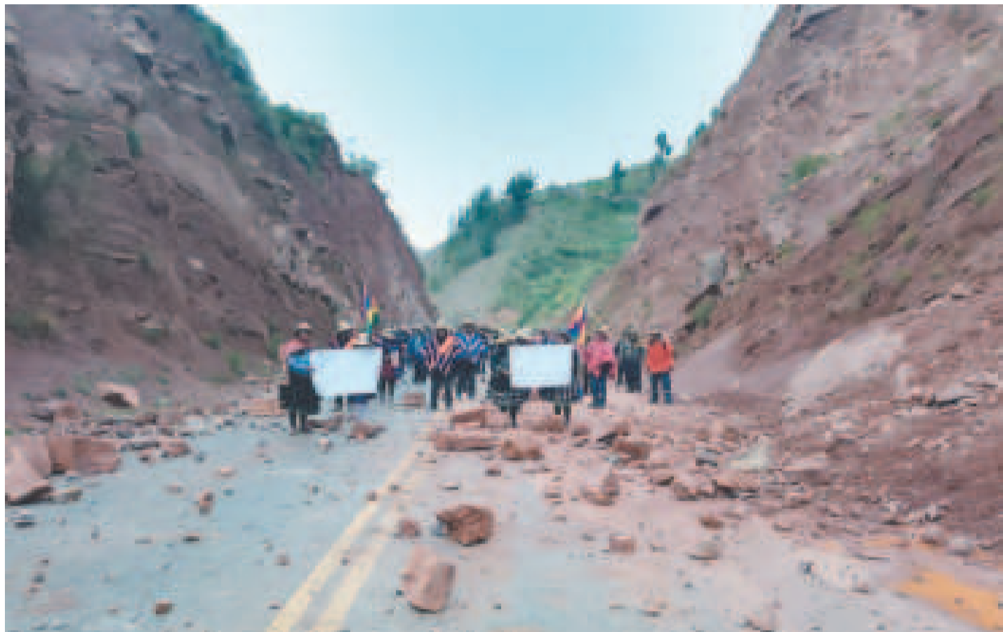
Un bloqueo evista en la ruta a Cochabamba en enero de 2024.