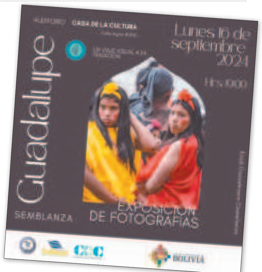
La obra busca fomentar un diálogo intercultural.

El público en general podrá ser parte la inauguración de la exposición en el auditorio de la Casa de la Cultura de la ciudad de Tarija, en la calle Ingavi N° 370. El ingreso es libre y para todo público.