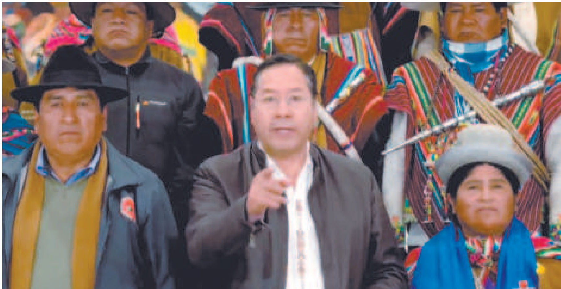
El presidente Luis Arce en su mensaje al país.