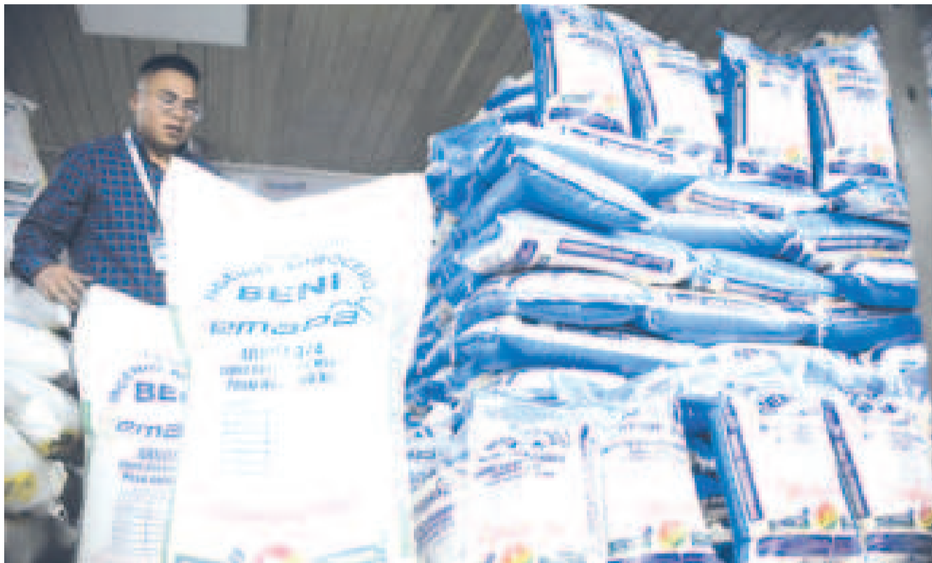
La oferta del arroz envasado que distribuye la estatal Emapa.