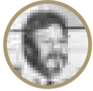
Armando Aquino Huerta

Los políticos y politiqueros opositores al gobierno constitucional y legítimo del presidente Luis Arce Catacora desde hace meses bloquean los créditos internacionales destinados al pueblo humilde y trabajador, utilizando para ello la mentira en noticias falsas publicadas en los medios de comunicación a su alcance, las redes sociales, los guerreros digitales, y la industria de la desinformación, denunciando inclusive hechos de corrupción inexistentes para dañar la imagen del Órgano Ejecutivo, manipular al pueblo, convulsionar el país y dar un golpe de Estado como solución final a sus fracasos, practicando lo que Joseph Goebbels asesorando a Adolf Hitler decía: "Miente, miente, miente que algo quedará, cuanto más grande sea una mentira más gente la creerá".