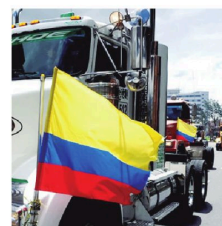
Protesta de los transportistas

En respuesta al ataque, Israel prometió destruir Hamás y lanzó una vasta represalia que ya ha dejado 40.786 muertos en el territorio palestino, según el Ministerio de Salud de la Franja de Gaza.