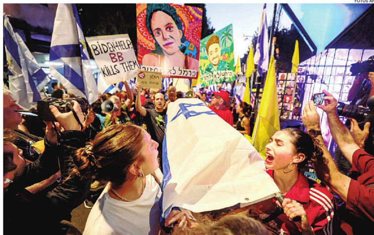
El entierro de uno de los rehenes muertos se convirtió en una manifestación en contra de Netanyahu

Abu Obeida, portavoz de las brigadas Ezzedine Al Qassam, el brazo armado de Hamás, advirtió que los rehenes israelíes que