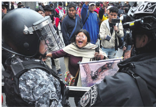
La Policía resguardó a los dirigentes que son afines al arcismo