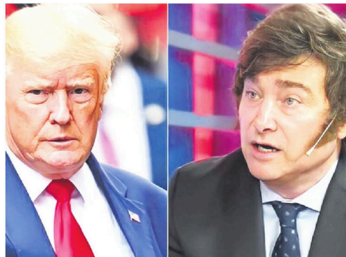
El mandatario argentino ha demostrado su admiración por Trump

El mandatario afirmó que es "considerado el máximo exponente y defensor de las ideas de la libertad en el mundo", destacó sus reuniones con popes de Silicon Valley como Mark Zuckerberg, Elon Musk o Jeff Bezos y se burló de "la agenda liliputiense de los políticos argentinos intrascendentes, ratas invisibles, que jamás van a poder aspirar a eso".