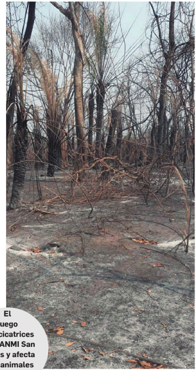
El fuego deja cicatrices en el ANMI San Matías y afecta a los animales silvestres