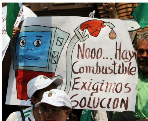
La escasez de diésel fue otro de los puntos más cuestionados

La escasez de dólares, la falta de diésel, el encarecimiento del costo de la canasta básica familiar, el rechazo a los datos del Censo 2024 en Santa Cruz y la falta de