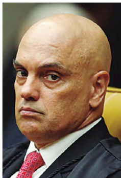
La Corte Suprema brasileña le dio la razón al juez Moraes

"Elon Musk demostró su total irrespeto a la soberanía brasileña y, en especial, al poder judicial,