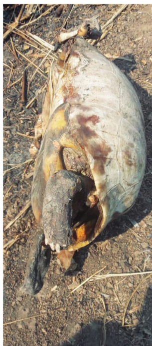
Las petas son algunas de los animales silvestres que no logran sobrevivir