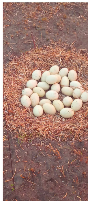
Hay animales que abandonan sus nidos para salvar sus vidas

árboles secos son combustible para los incendios. Los guardaparques también rescatan tortugas y otros animales silvestres que logran sobrevivir a las llamas, pero también encuentran lagartos, aves y otros animales calcinados.