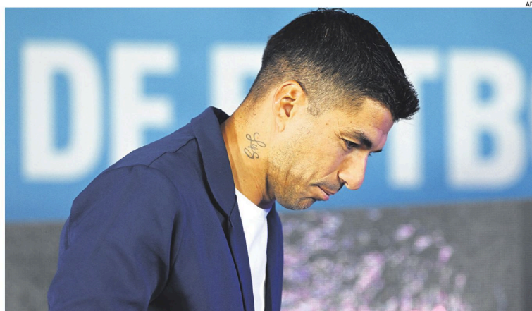
Cabizbajo pero convencido de haber cumplido con su selección. Así se retiró Luis Suárez tras anunciar que jugará un partido más

Marcó 69 en total desde que debutó en 2007. El delantero anunció que el viernes ante Paraguay vestirá por última vez la Celeste