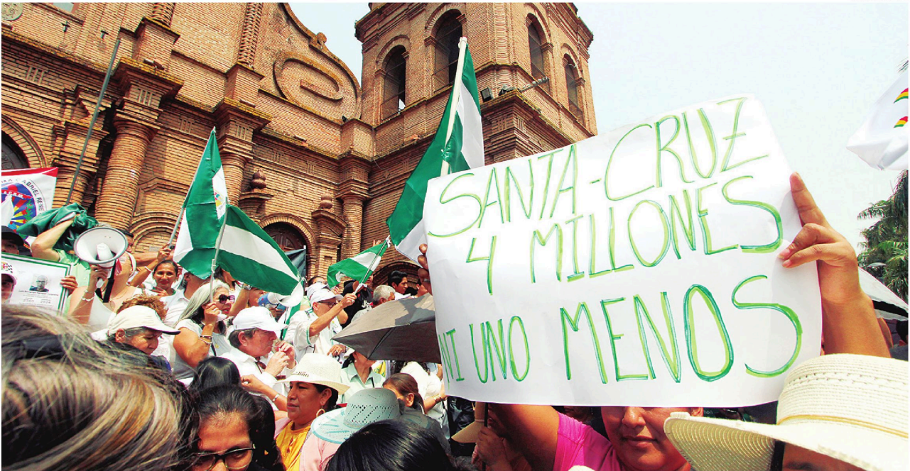
La convocatoria de las instituciones cruceñas, entre ellas de la Uagrm, fue masiva y se concentró en la Plaza 24 de Septiembre donde los reclamos apuntaron a los datos del censo

CRECE LA MOLESTIA CONTRA EL TRABAJO DEL INE