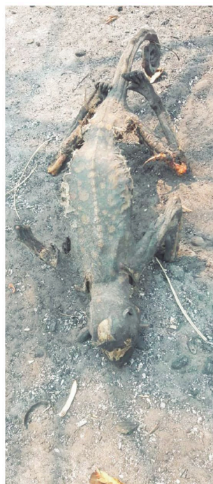
Quedan calcinados en su intento por salir de los incendios. Se dan muchas bajas