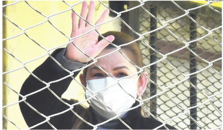
La expresidenta Jeanine Áñez está detenida desde marzo de 2021 en el penal de Miraflores.

Problemas logísticos y falta de notificaciones motivó que la audiencia sea diferida para este miércoles en medio de vigili