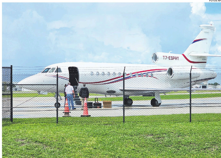
El jet Dassault Falcon 900EX voló de Santo Domingo hasta la ciudad estadounidense de Fort Lauderdale

Maduro fue proclamado reelecto para un tercer mandato de seis años, hasta 2031, por el Consejo Nacional Electoral (CNE), que no publicó el detalle del escrutinio como obliga la ley. El resultado fue convalidado por el Tribunal Supremo de Justicia (TSJ), pero desconocido