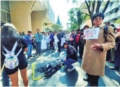
Afines a Evo se movilizaron frente al TCP para impulsar la reelección