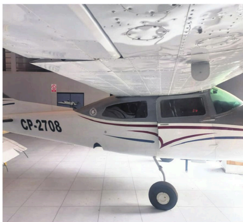
Una avioneta Cessna adaptada para transportar droga, en el hangar

Durante el allanamiento, se practicó una requisa; se llegó a arrestar a un piloto de aviación, un guardia de seguridad, dos personas encargadas de la limpieza y un taxista. A esas detenciones se suman las capturas de una mujer que auxilió al Colla y el difunto Zampieri Suárez. También se confirmó la detención de dos sujetos de nacionalidad brasileña que viajaban en el auto Kia que sufrió el ataque y que escaparon después del suceso. En total, hay ocho personas detenidas relacionadas con el enfrentamiento armado.