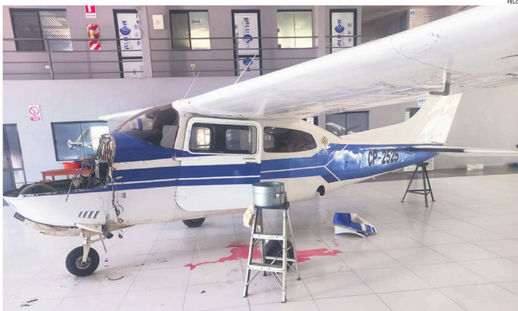
Las nueve avionetas acondicionadas para el transporte de droga que estaban en el hangar del Colla y fueron incautadas por la Policía