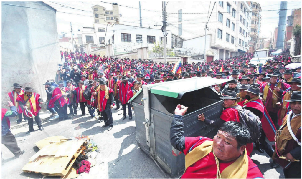
Los campesinos de la federación Túpac Katari reclaman la devolución de su inmueble que está controlada por una facción afín al Gobierno

El mismo dirigente, luego de la gasificación de la Policía, amenazó con el bloqueo de caminos en las 20 provincias del departamento de La Paz y también exigió la renuncia de Luis Arce y David Choquehuanca. "También estamos exigiendo la renuncia definitiva de este presidente Luis Arce Catacora y su vicepresidente David Choquehuanca por incapacidad del gobierno y por destruir la economía nacional. Asimismo, estamos exigiendo a la Asamblea Legislativa que convoque a una elección nacional en la que se elija democráticamente a un nuevo gobierno que dé solu-