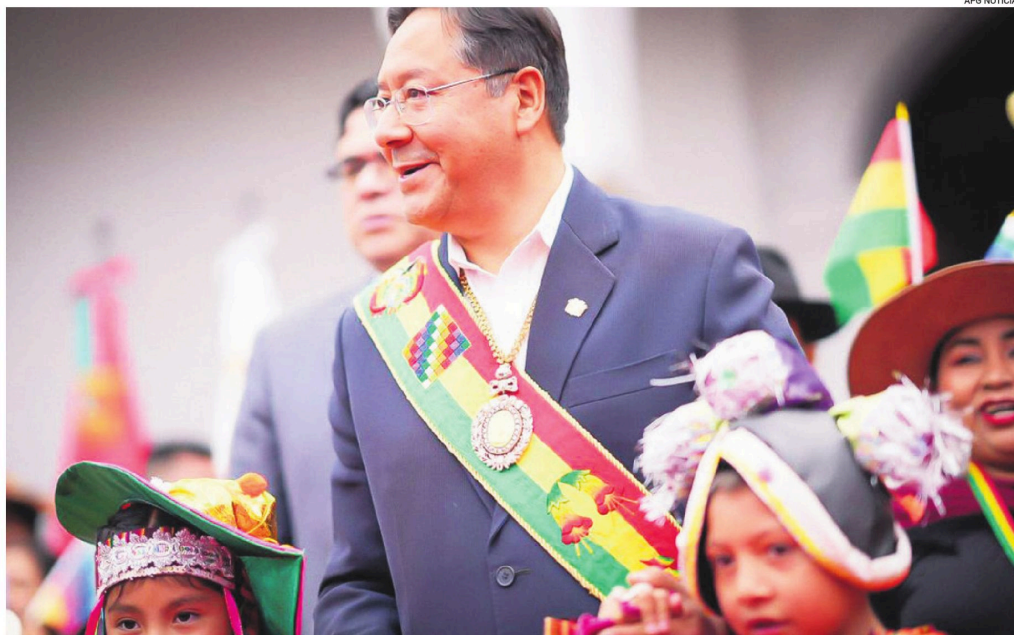
El presidente Arce en los actos protocolares en ocasión del aniversario 199 de la fundación de Bolivia, en Sucre, donde anunció la consulta.

"Este alejamiento es el reflejo de lo que coloquialmente se dice de las famosas ratas que abandonan el barco cuando se está hundiendo. El aparato estatal ya no es nada sólido ni solvente y esto se va a reflejar en todo el aparato institucional, no solo en el judicial", afirmó