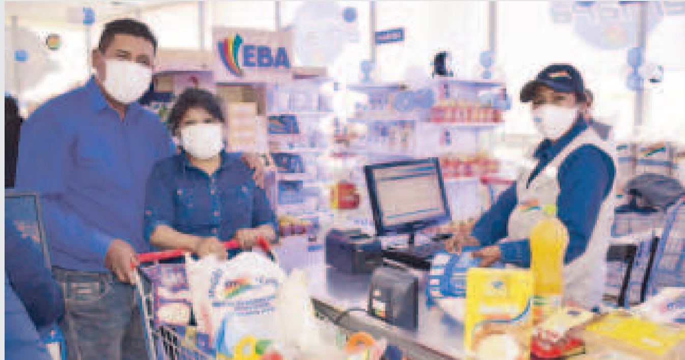
Emapa cuenta con más de cien sucursales a escala nacional.

Además de extender sus horarios, Emapa incrementará significativamente la distribución de arroz. Durante este mes se prevé la venta de 11.000 toneladas en todas las tiendas de la red, un notable incremento en comparación con las 3.000 o 4.000 tone-