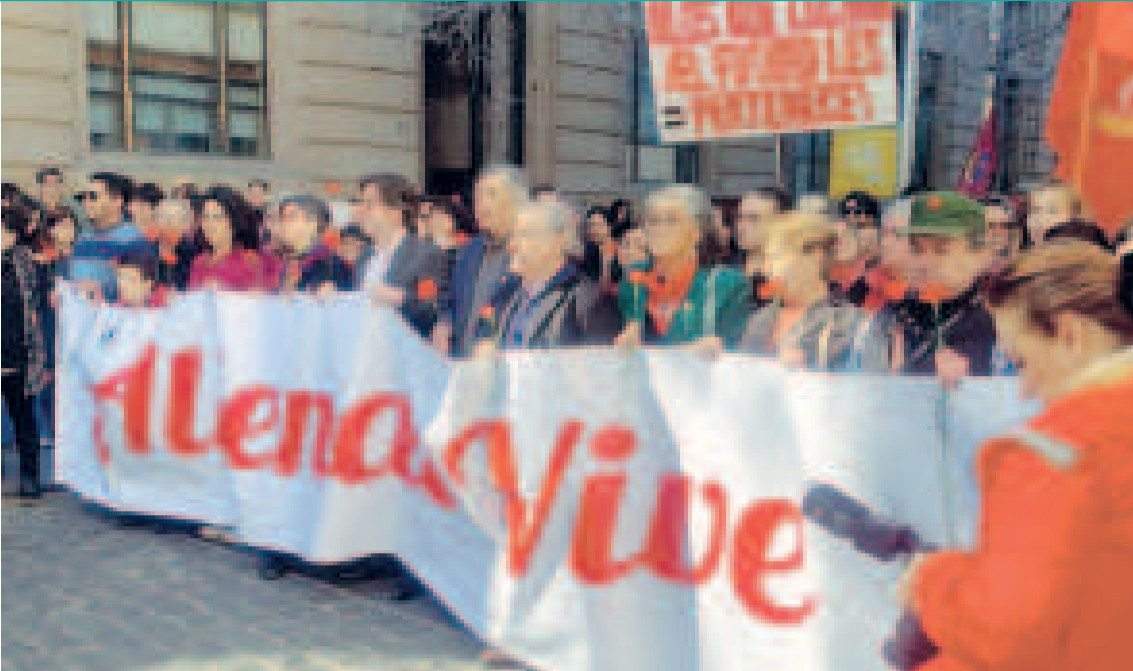
¡Allende vive!, el lema bajo el cual se conmemoró el golpe de Estado en Chile.