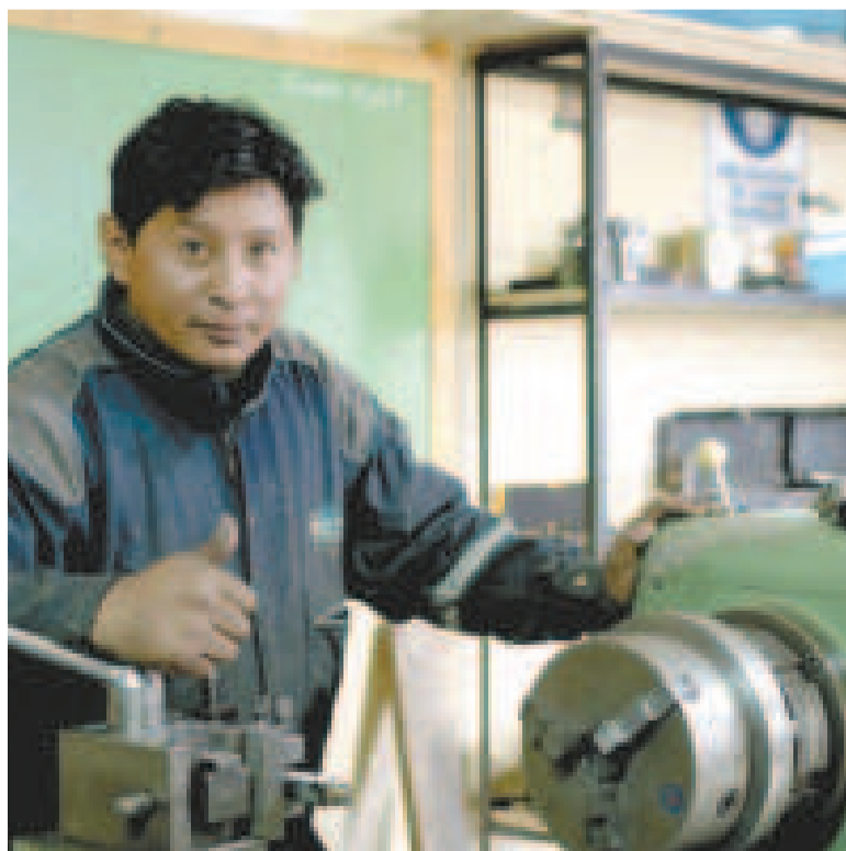
Gran parte de los créditos posibilitan incrementar los niveles de producción.