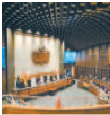
Una sesión en el Senado.