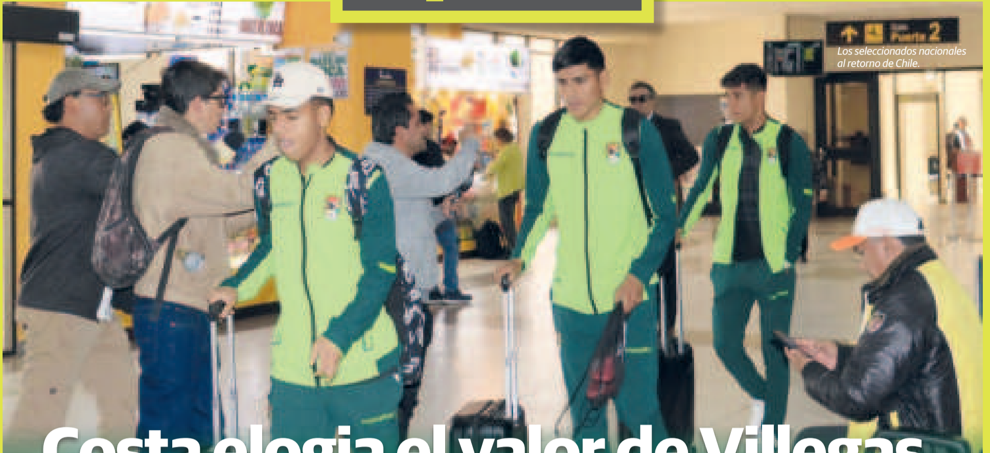
Los seleccionados nacionales al retorno de Chile.