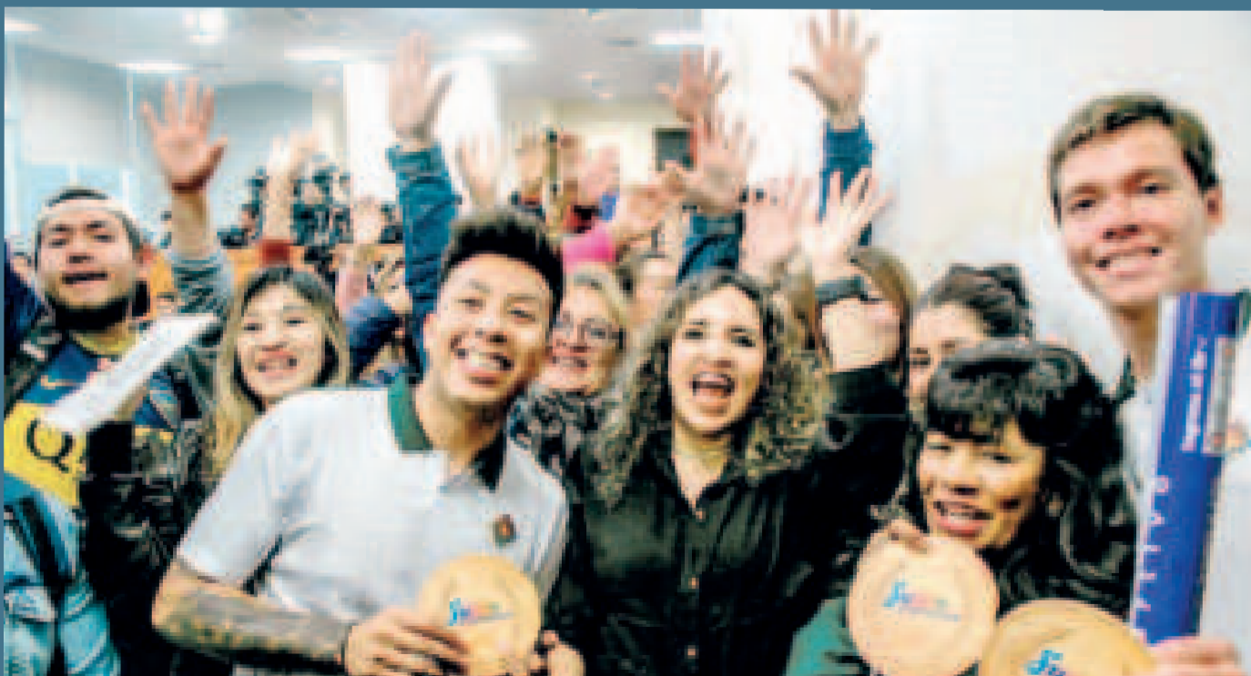
La satisfacción de los deportistas junto a la ministra Castro, después de conocer el proyecto de incentivo al deporte de alto rendimiento.

Habrà un cupo para un equipo de un deporte de conjunto con miras a la participación en un torneo internacional, con un máximo de diez jugadores, ingresando en la categoría de talento deportivo para la asistencia económica.