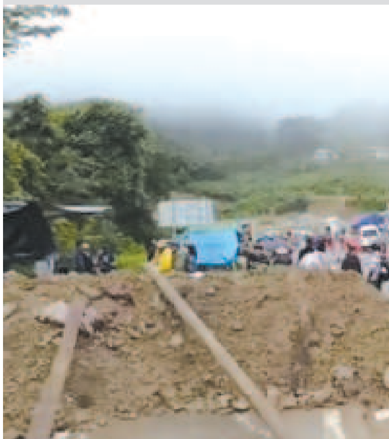
El bloqueo evista de una vía en Cochabamba.