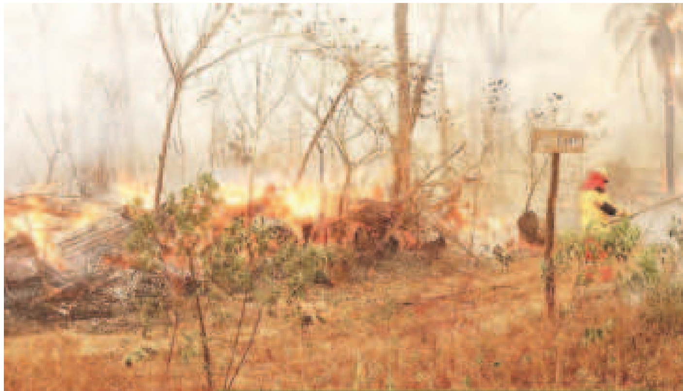
Un bombero combate el fuego en un área forestal de Santa Cruz.