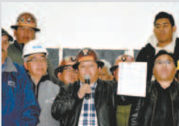
La dirigencia de la COB.

La medida es apoyada por autoridades ediles del oriente que llegaron el martes para sumarse a la marcha y a la vigilia permanente.