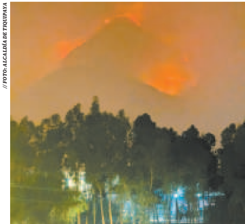
Incendio en el Parque Nacional Tunari.

“Se ha trabajado con las diferentes instituciones, bomberos volunta-