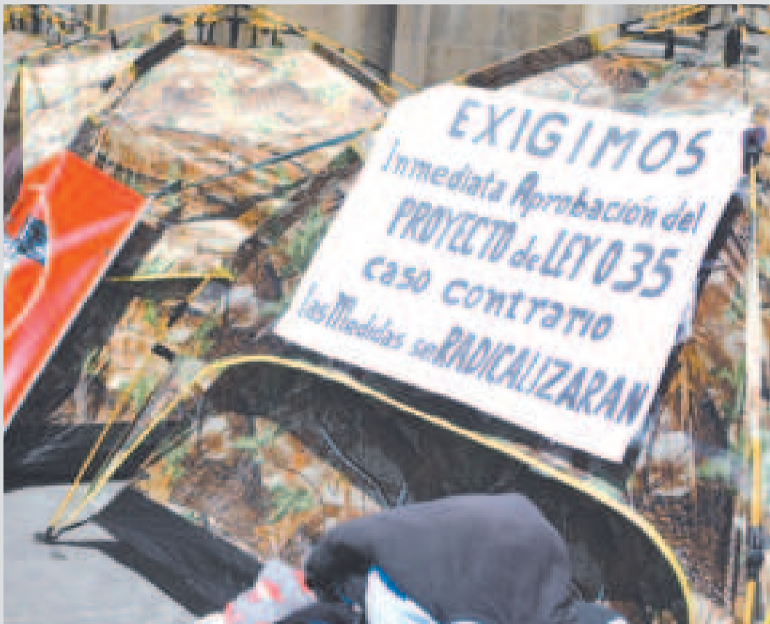
La vigilia con carteles de sectores sociales que exigen la aprobación de leyes.

La Federación de Asociación de Municipios pide a los parlamentarios demostrar su responsabilidad con el país.