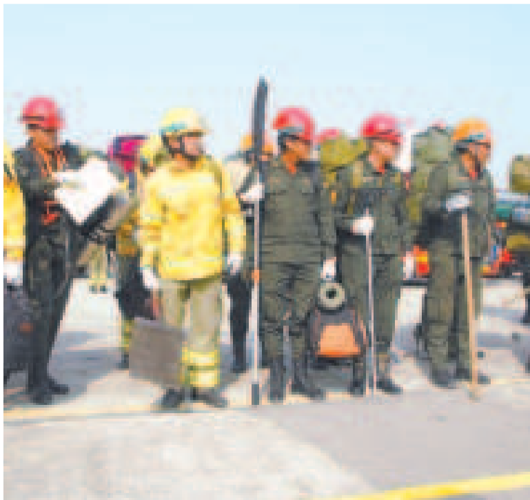
Bomberos forestales de las Fuerzas Armadas y de la Policía Boliviana.