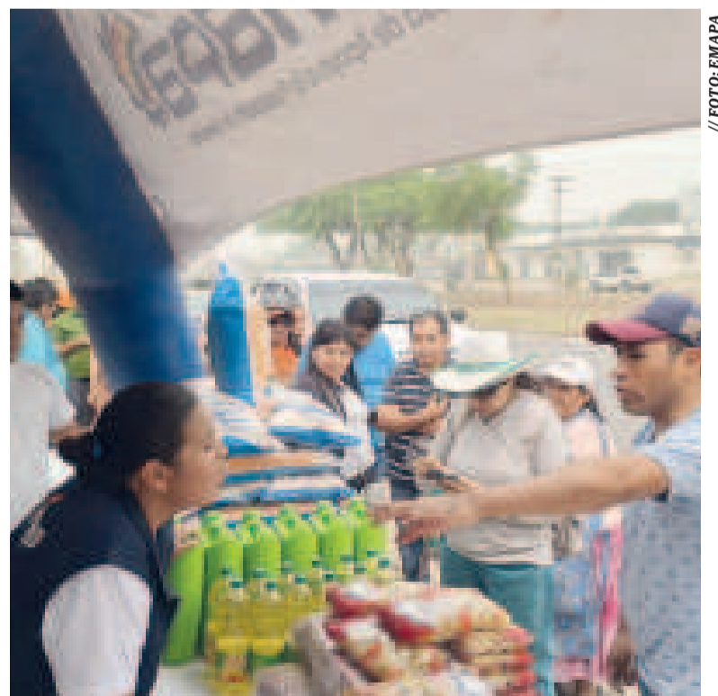
Se llevará a las familias los principales productos alimenticios.

“Nuestra meta como Estado es que el arroz de la reserva estratégica y de otros productos pueda llegar a las familias que necesitan para su consumo”, manifestó el gerente de Emapa.