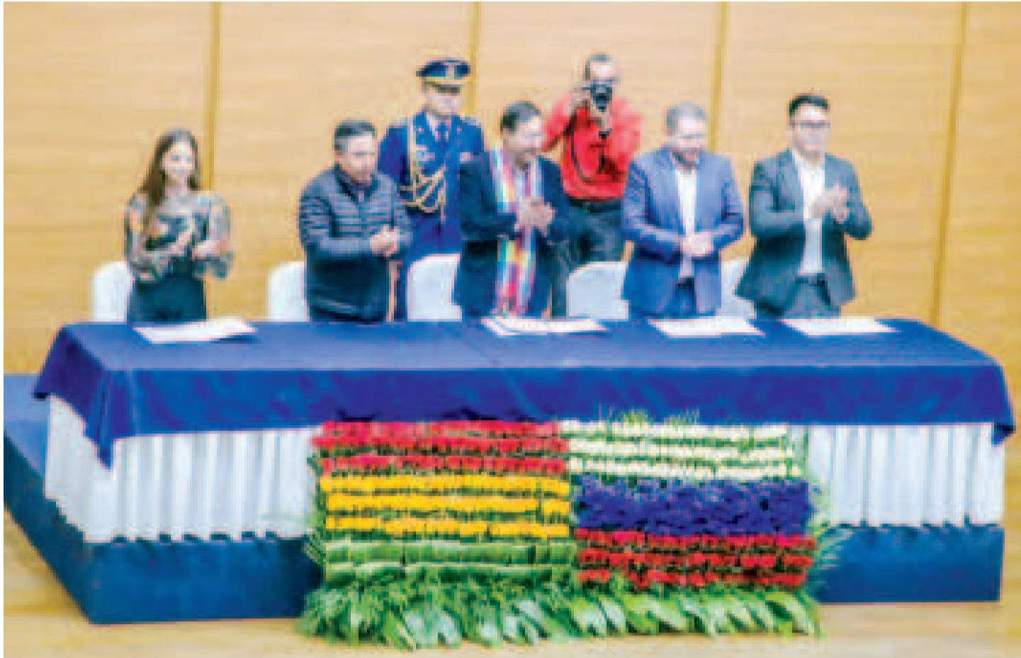
Las autoridades que participaron en el acto oficial de la firma del contrato.