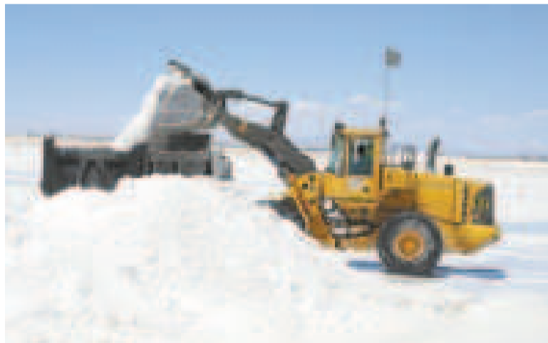
Trabajos en el salar de Uyuni.

La firma del contrato es resultado del acuerdo de inversión suscrito en diciembre de 2023 entre la estatal de litio y la empresa rusa.