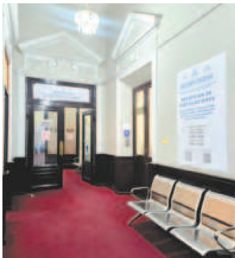
La oficina donde se reciben las postulaciones para fiscal.

Lanchipa anunció, en agosto, que prepara un informe sobre su trabajo en la institución, antes de que concluya su gestión.