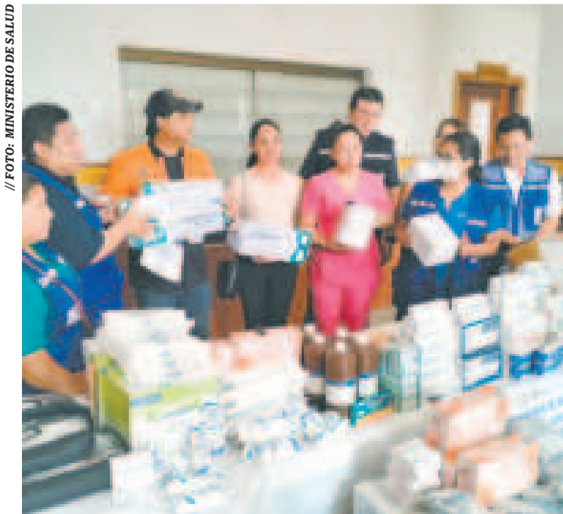
Personal del Ministerio de Salud entrega lotes de medicamentos.