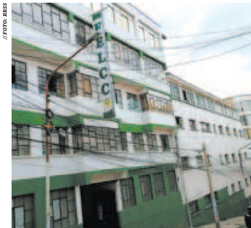
La Fuerza Especial de Lucha Contra el Crimen de la ciudad de La Paz.

PERSONAS RESULTARON HERIDAS por el fatal accidente. Fueron trasladadas al hospital El Kenko de El Alto.