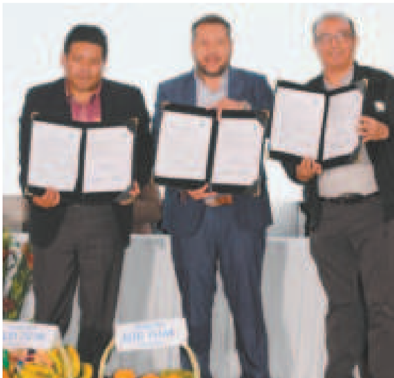
El ministro de Hidrocarburos, Alejandro Gallardo (centro), junto a autoridades firmantes del acuerdo.