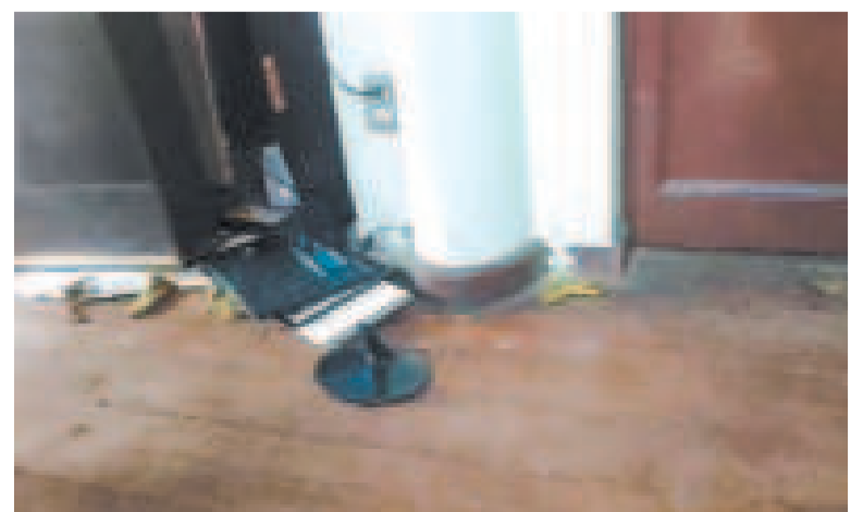
Destrozos en el interior de la COB luego del intento de toma de parte del evismo.