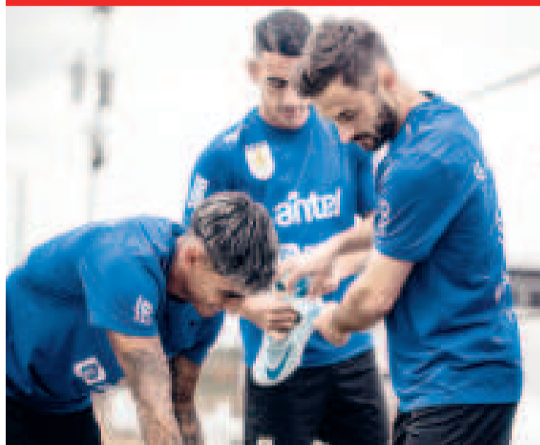
Jugadores de la selección uruguaya en el cierre de prácticas en Maturín.

La última vez que estos equipos se enfrentaron fue por las Eliminatorias rumbo al Mundial de Qatar. En febrero de 2022, la Celeste se impuso por 4 a 1 en el Estadio Centenario con goles de Rodrigo Bentancur, Giorgian De Arrascaeta, Edinson Cavani y Luis Suárez.