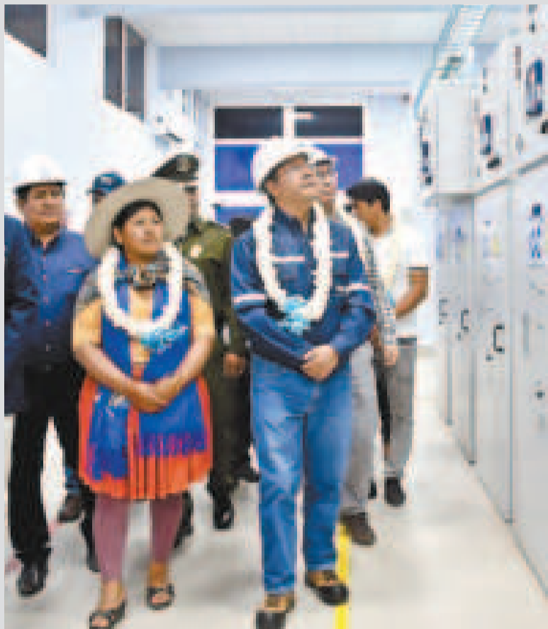
El presidente Luis Arce recorre las instalaciones de Elfec.