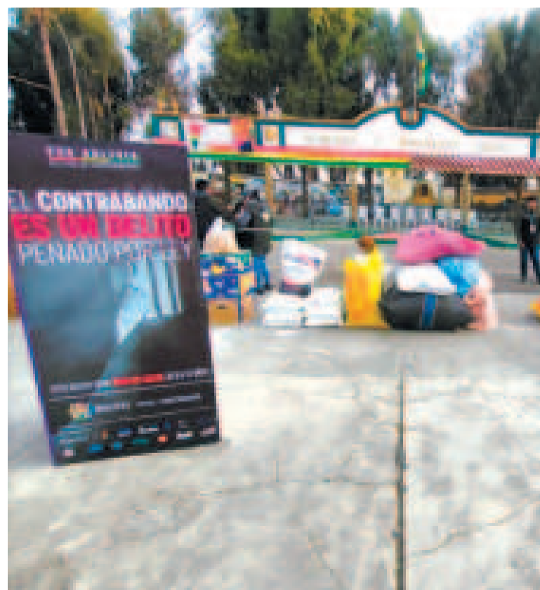
Los productos comisados que posteriormente fueron incinerados.

Además, cinco vehículos sin documentos fueron incautados.