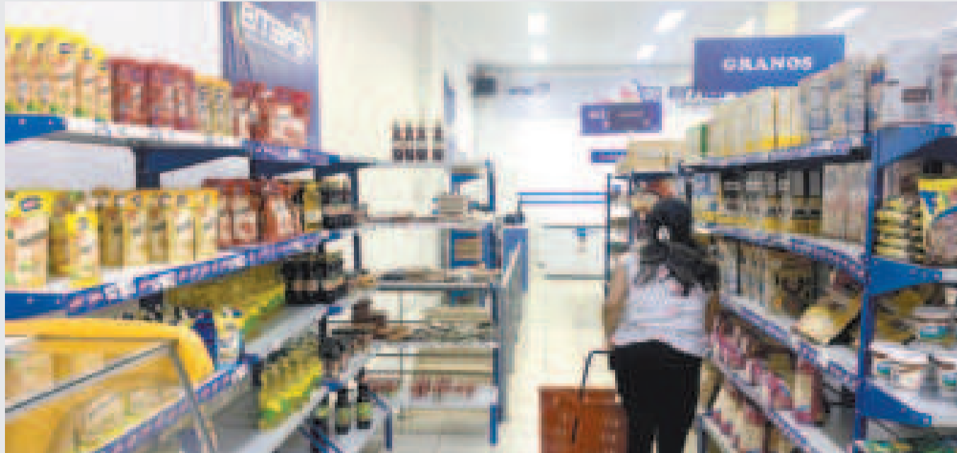
Emapa tiene una diversidad de productos de fabricación nacional.

Este ajuste en los precios ha generado largas filas en las