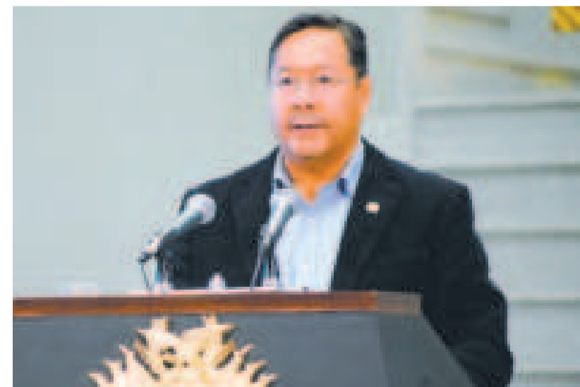
El presidente Luis Arce.

gará más ayuda internacional proveniente de los trabajos en las áreas más afectadas.