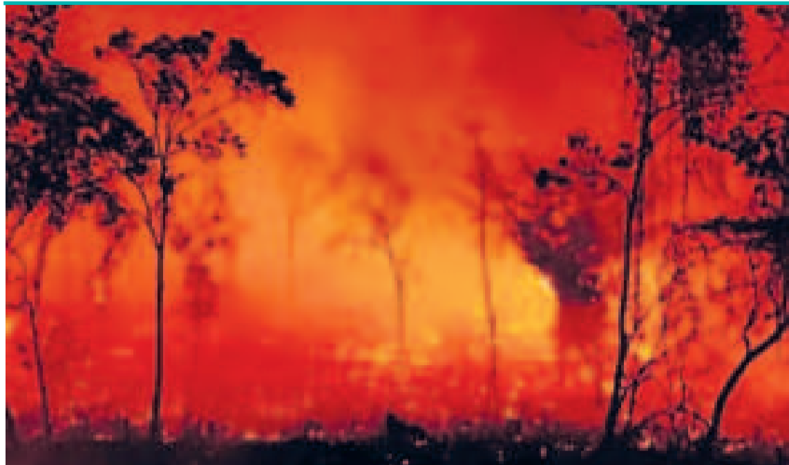
El fuego en Brasil llegó hasta la Amazonia.