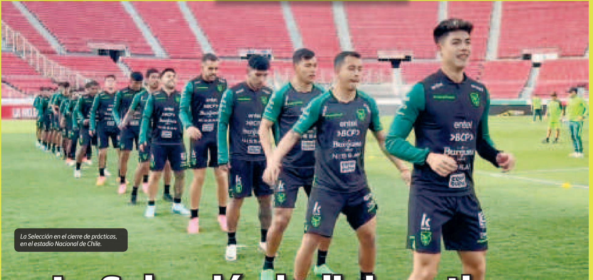
La Selección en el cierre de prácticas, en el estadio Nacional de Chile.