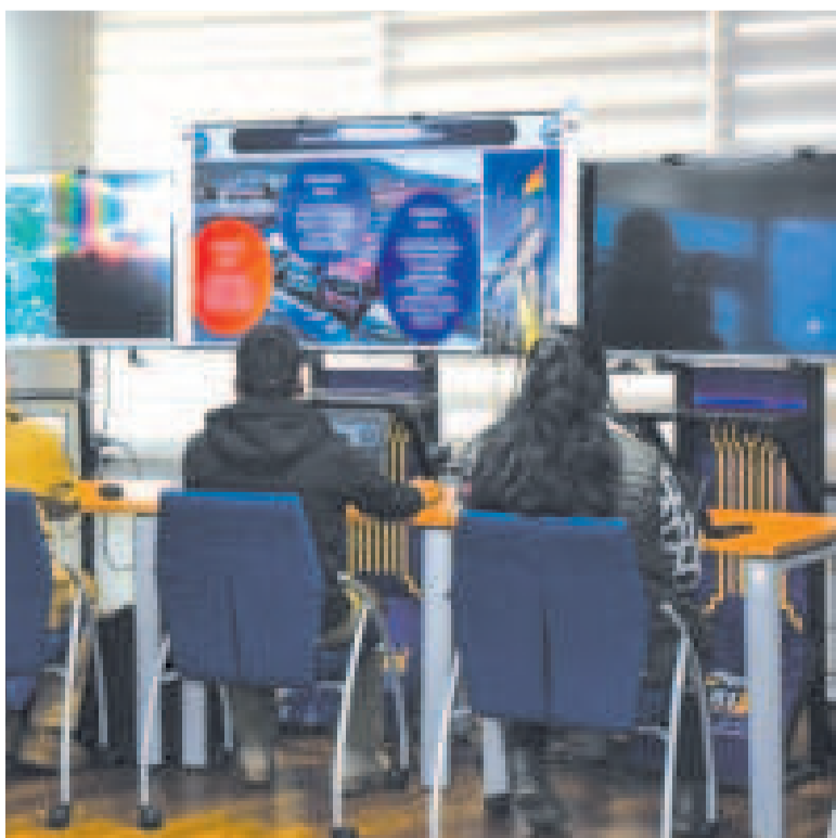
El Centro de Monitoreo de Seguridad Alimentaria activa acciones inmediatas.