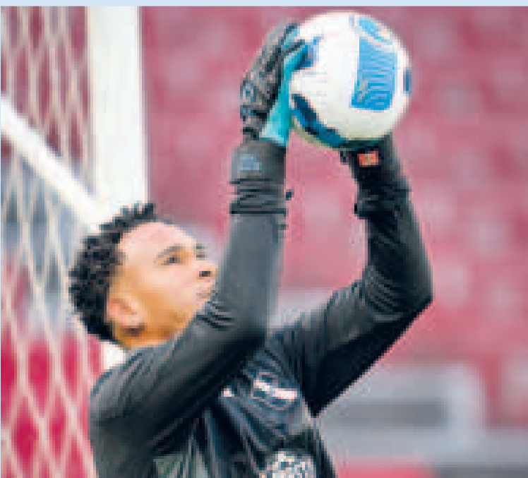
Pedro Gallese, la seguridad en el arco del seleccionado peruano.