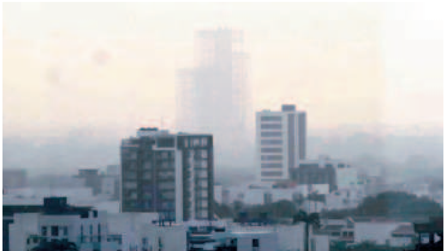
El humo cubre la ciudad de Santa Cruz de la Sierra.

Véliz sugirió a los gobiernos municipales emplear el decreto de emergencia nacional para contar con recursos y dotar de insumos de bioseguridad a las unidades educativas, con el fin de proteger la salud de los estudiantes.