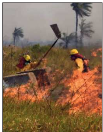
El fuego arrasa en Riberalta.

La autoridad municipal demandó además ayuda humanitaria, medicamentos, cisternas. Dijo que, concluida la catástrofe, Riberalta requerirá de semillas para reactivar el sector productivo afectado.