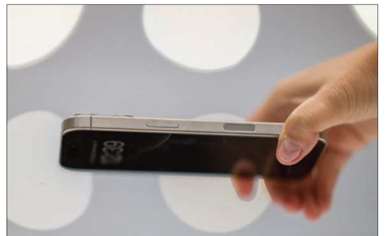
NOVEDAD. El iPhone básico incorpora dos botones en el lateral.