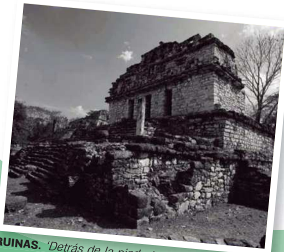
RUINAS. 'Detrás de la piedra', nombre de la obra.