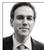
Bret Stephens es columnista de The New York Times.

Cuando la historiadora Deborah Lipstadt derrotó una demanda por difamación presentada contra ella en un tribunal británico por el negador del Holocausto David Irving en abril de 2000, era casi posible imaginar que el antisemitismo algún día podría convertirse en una cosa del pasado, al menos en gran parte de Occidente. Viajar a Israel no fue una elección ideológicamente complicada. Llevar una estrella de David no era personalmente riesgoso. Los campus universitarios no se sentían hostiles hacia los estudiantes judíos. Las sinagogas (al menos en los Estados Unidos) no tenían policías estacionados afuera de sus puertas.