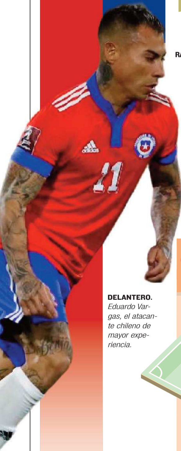
DELANTERO. Eduardo Vargas, el atacante chileno de mayor experiencia.

Mientras que en el seleccionado chileno tienen bastante cuestionado al DT Ricardo Gareca, quien dijo irán con todo por la victoria, pero que no subestiman a nadie.