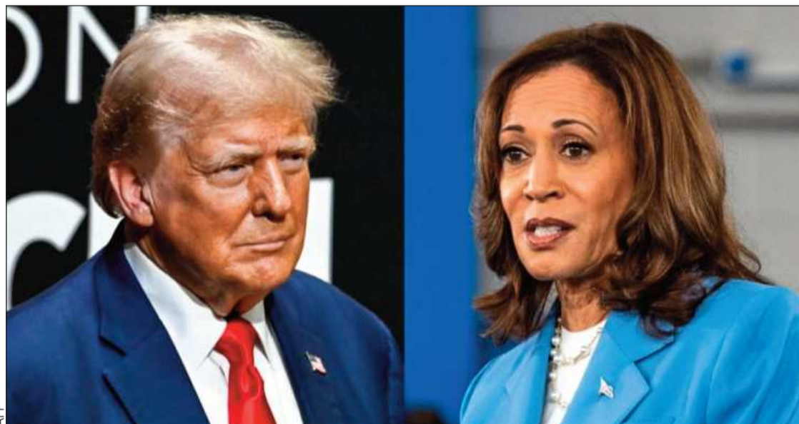
ELECCIONES. Partidarios de ambos candidatos se muestran muy optimistas sobre el debate.

de Guayaquil (suroeste). El sector eléctrico fue declarado en emergencia en agosto debido a los bajos caudales en los ríos que surten a las hidroeléctricas del país, lo que ocasionaría cortes de energía programados. En abril, Ecuador ya sufrió apagones de hasta 13 horas seguidas debido a que los embalses de varias centrales hidroeléctricas estaban al mínimo. Y en junio, un apagón generalizado ocasionado por una falla en la línea de transmisión. El sábado un ‘error humano’, según las autoridades, provocó otro corte.