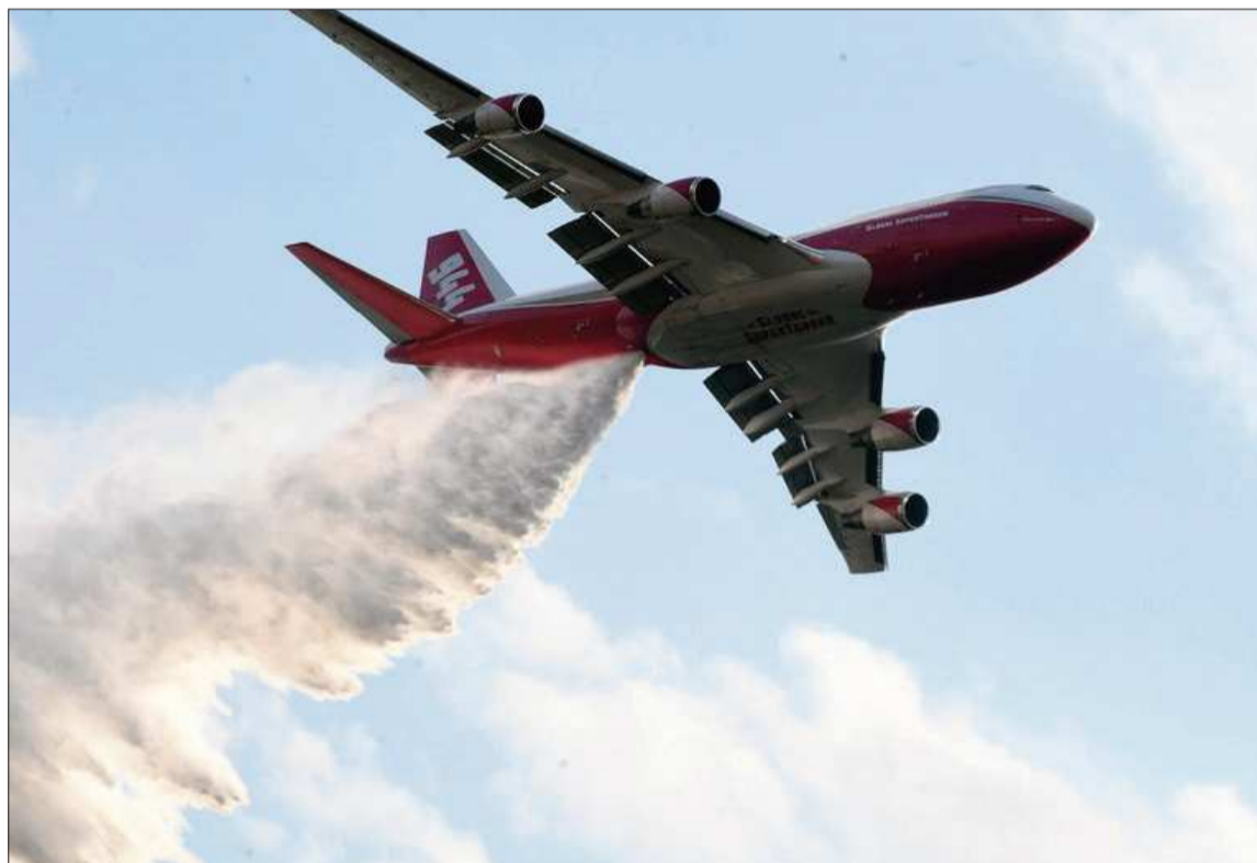
ANUNCIO. El Gobierno nacional contratará aviones cisterna para sofocar los incendios forestales.