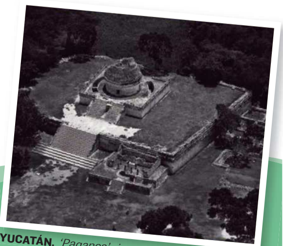
YUCATÁN. 'Paganos', imagen de unas ruinas.