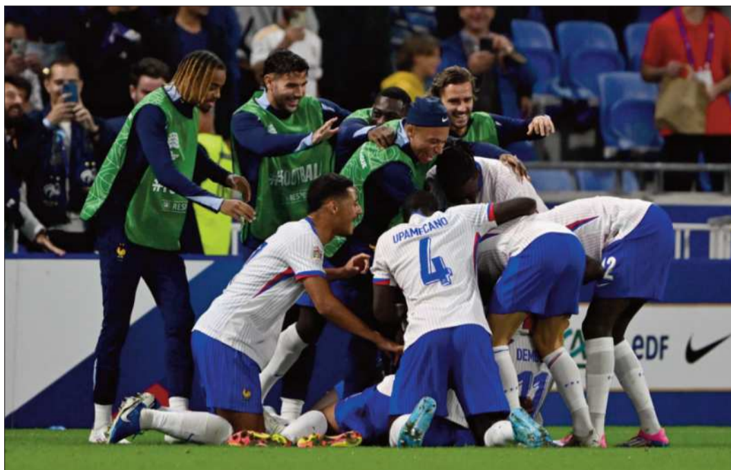
RECUPERACIÓN. Los jugadores del seleccionado francés celebran la victoria ante Bélgica.