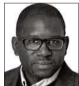
Jamelle Bouie es columnista de The New York Times.

Una de las sabidurías populares más perdurables sobre la política estadounidense es la noción de que una promesa hecha durante la campaña electoral casi nunca es una promesa cumplida. Lo único que se puede contar de un político, y especialmente de un candidato presidencial, es que no se puede contar con nada. En realidad, esto no es cierto. De hecho, existe una fuerte conexión entre lo que dice un candidato durante la campaña electoral y lo que hace un presidente en el cargo.