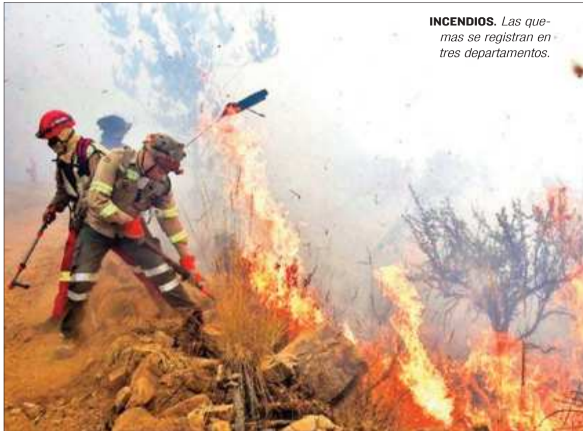
INCENDIOS. Las quemas se registran en tres departamentos.