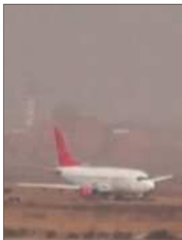
La humareda daña la visibilidad.

La autoridad informó que se tuvieron que suspender las opera-