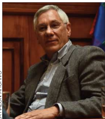
El expresidente Rodríguez Veltzé.

El expresidente cuestionó también la prórroga de magistrados y consejeros