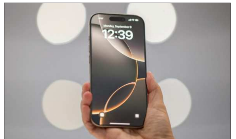
PANTALLA. Estará disponible en dos tamaños, 6,1 y 6,7 pulgadas.