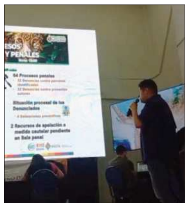
Detalle de procesos por quemas.

El titular de Medio Ambiente pedirá reunión con el fiscal Lanchipa