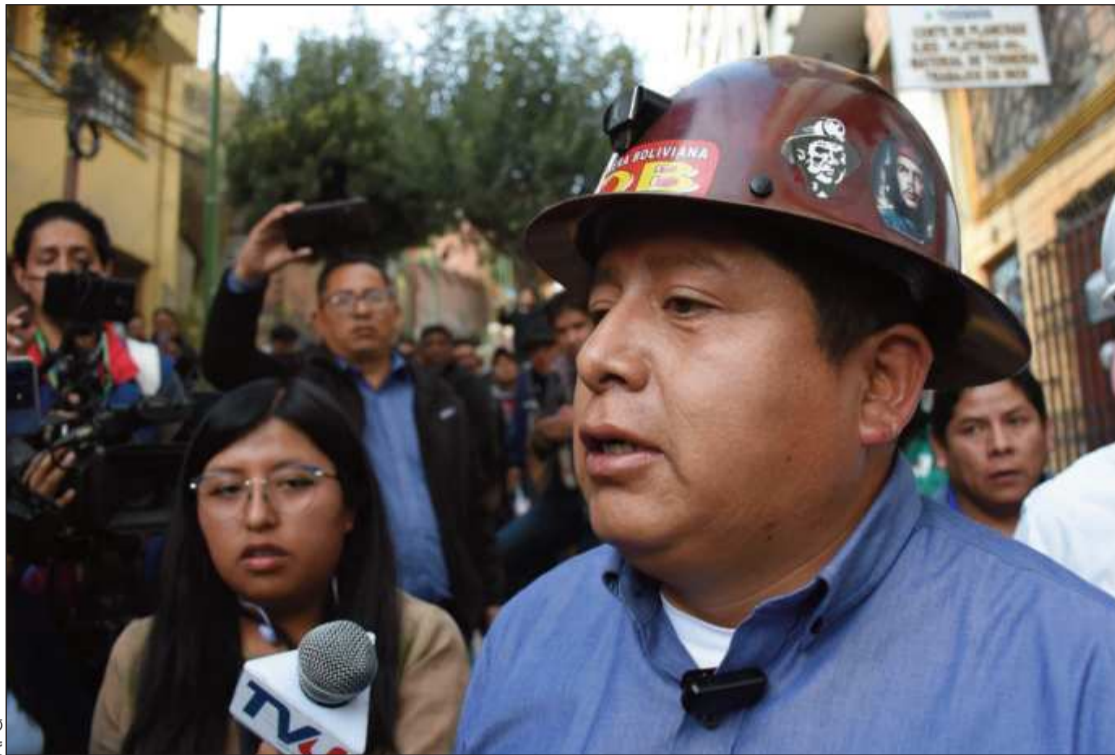
ANUNCIO. El dirigente de la COB confirmó la medida de presión que llegará a la ciudad de La Paz.