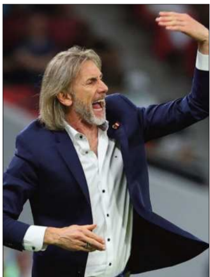
El técnico argentino Ricardo Gareca.

En Chile hay malestar y no se tiene expectativa como ocurría antes