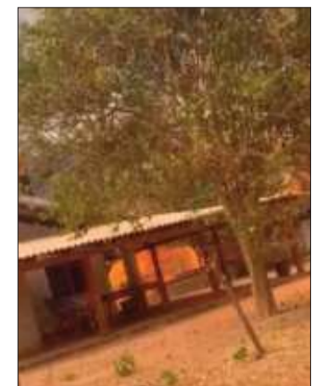
Llamas consumieron 4 casas.

Tres de las cuatro viviendas fueron consumidas en su totalidad, según el viceministro.