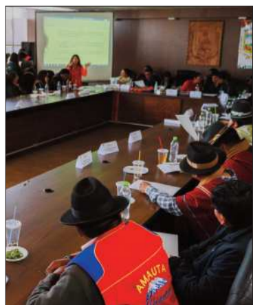
La Asamblea de la Alteñidad.

El director del INE debe responder primero a un cuestionario que se le envió