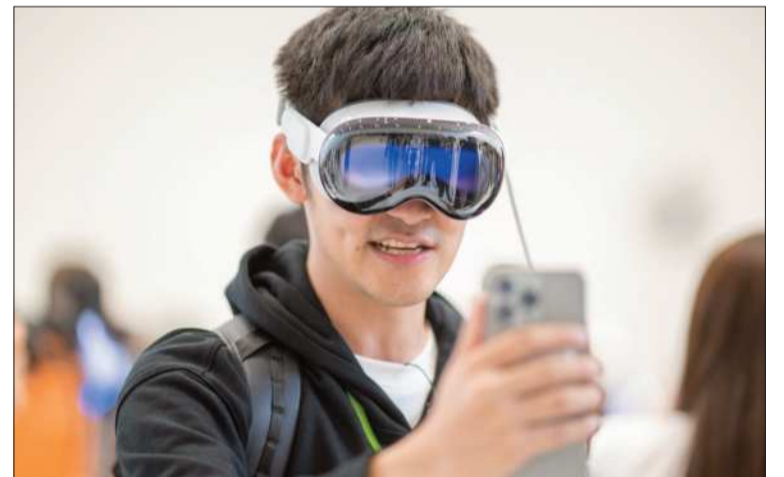
OPCIÓN. Los videos en 3D se reproducen en las Apple Visión Pro.