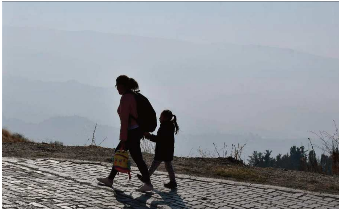
SITUACIÓN. También en regiones del occidente del país, como La Paz, existe alta contaminación.

“Queremos indicarles a los directores departamentales y a la