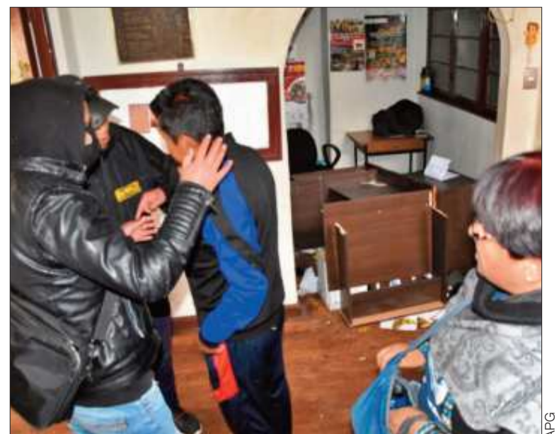
ATAQUE. Se reportaron destrozos dentro de la sede de la COB.

"Quiero hacer una denuncia a la comunidad internacional y a todo el país. Este golpe sindical tiene un fin político", dijo Huarachi. También denunció que recibió amenazas que no son de "ahora" sino de hace mucho tiempo.