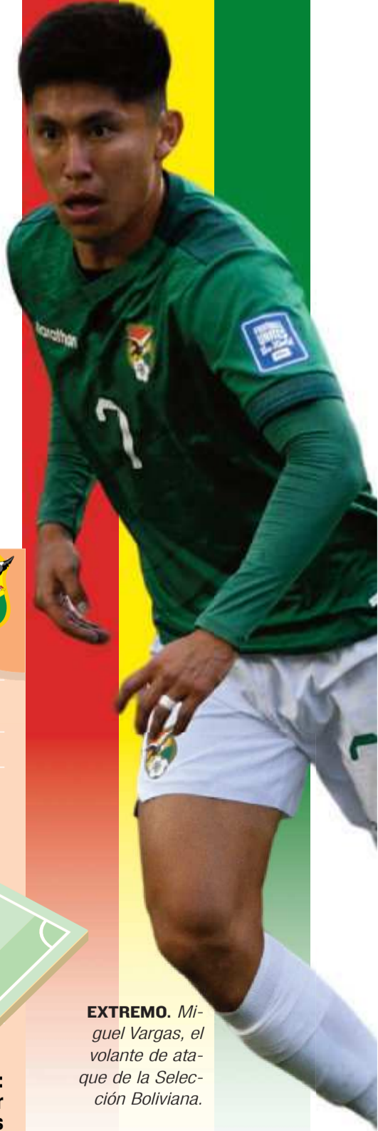
EXTREMO. Miguel Vargas, el volante de ataque de la Selección Boliviana.