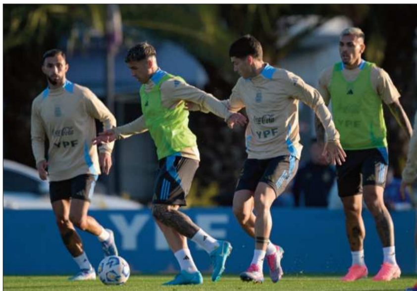
FIGURA. El delantero brasileño Vinicius Junior en un partido anterior.