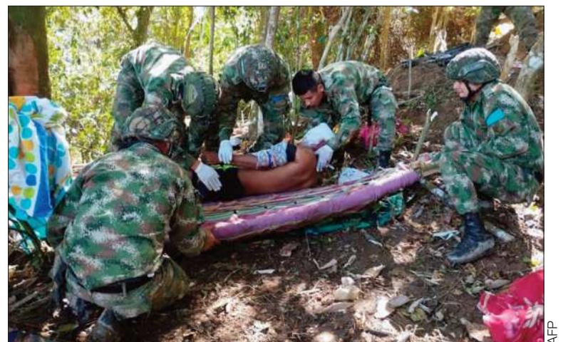
CONFLICTO. Al menos seis indígenas resultaron heridos.

Voceros de la comunidad awá le dijeron a esa emisora radial que “el Ejército puede entrar a la zona cuando lo desee”, pero que “debe haber una concertación con los pueblos indígenas previamente.”