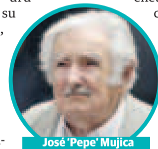
José ‘Pepe’ Mujica