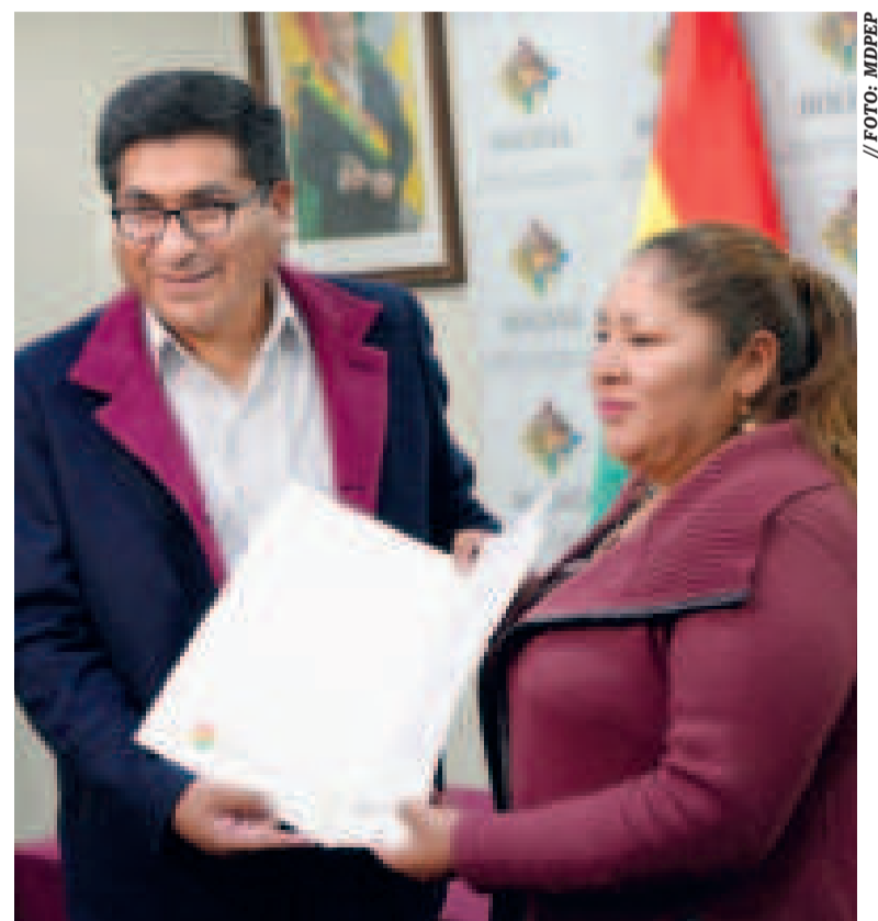
El ministro Néstor Huanca y la nueva viceministra Ana Delina Flores.

El Ministro de Desarrollo Productivo y Economía Plural destacó la aplicación móvil del Consume lo Nuestro como canal de comercialización digital en beneficio de 1.023 unidades productivas de la micro, pequeña empresa y artesanía en los rubros de alimentos, textiles y cuero, generando ingresos por más de Bs 19 millones de productos Hecho en Bolivia.