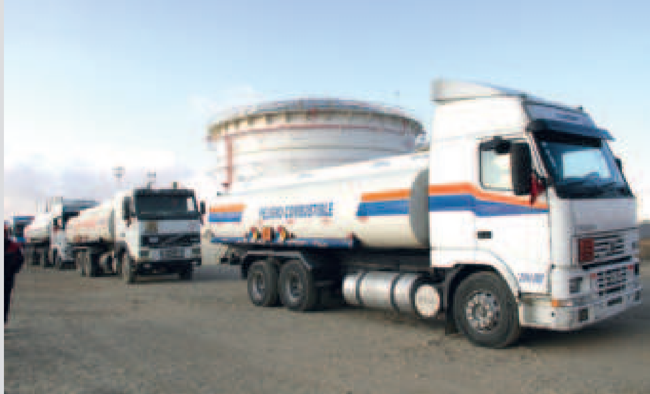
Camiones cisterna transportan combustibles.

Días antes, el 16 de agosto, el Gobierno y sectores privados desarrollaron el Diálogo