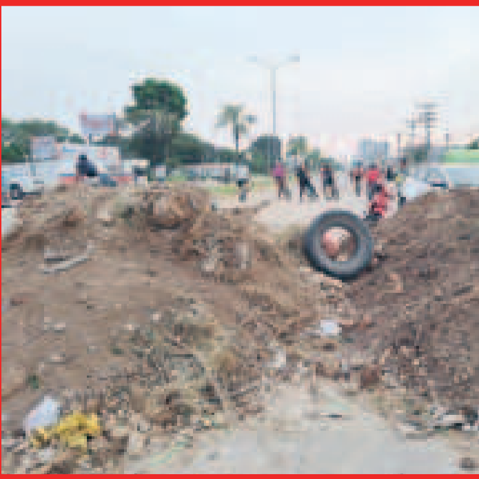
El paro de 36 días en Santa Cruz por el censo.

El Gobierno ratificó que el Censo 2024 fue altamente técnico y transparente.