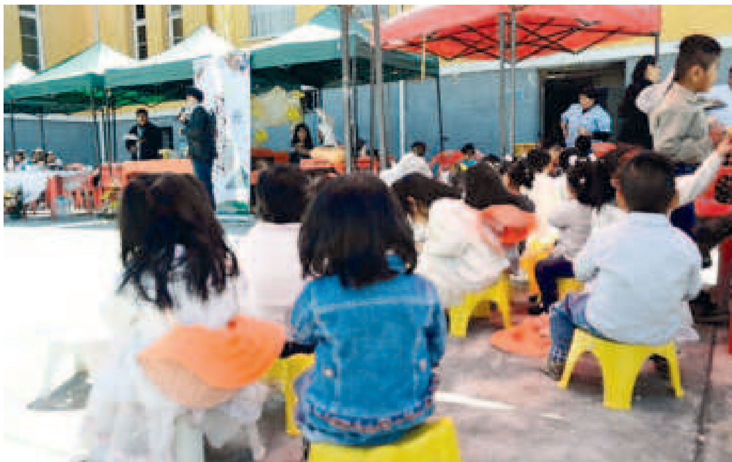
Niños en los centros de acogida.