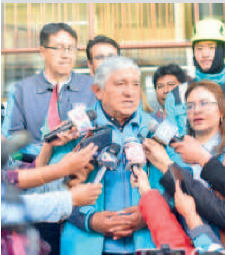
El alcalde paceño Iván Arias.