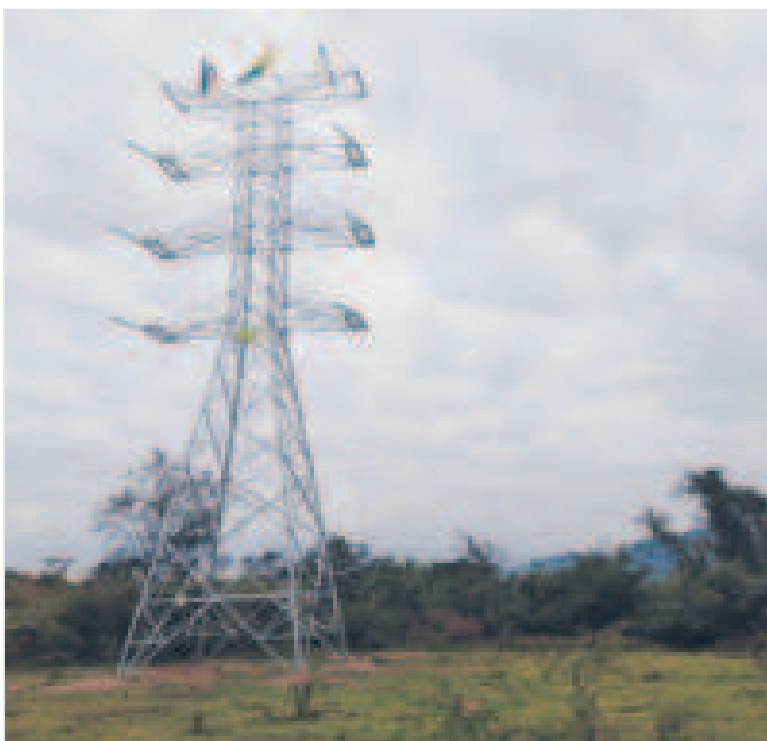
Una antena de transmisión de electricidad.