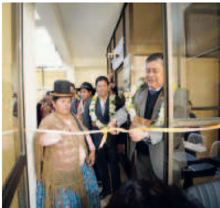
Inauguración de asientos fiscales en el departamento de La Paz.