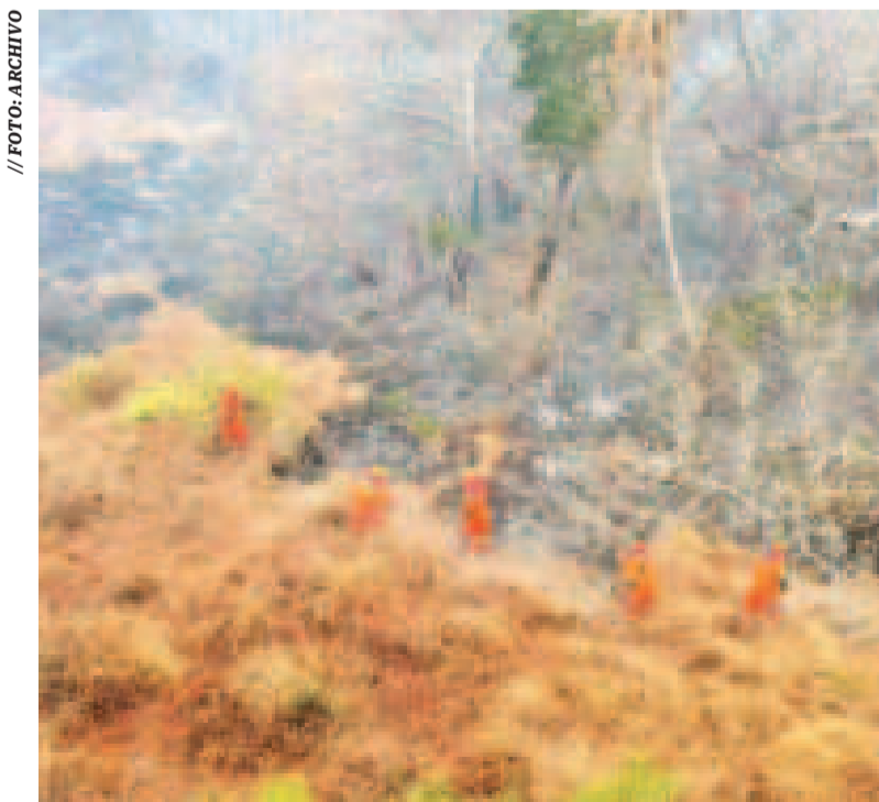
Bomberos combaten el fuego en la reserva forestal de Manuripi.