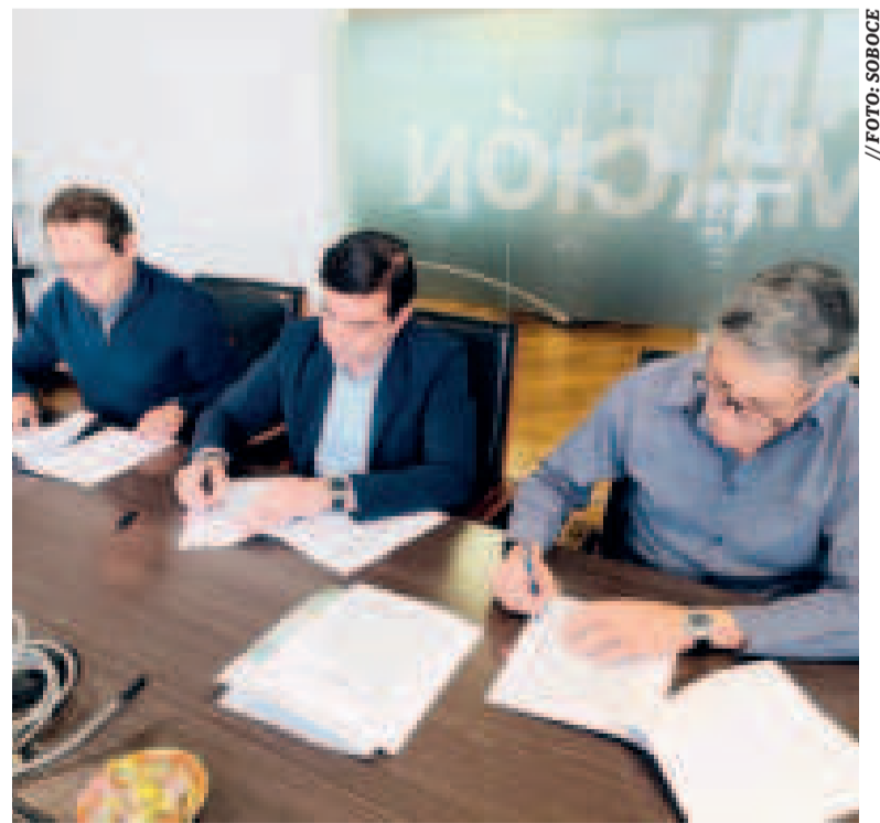
La firma de convenio de los directivos de ambas instituciones.

También se prevé que Swisscontact coadyuve en el componente de educación y sensibilización ambiental de la iniciativa, y brinde apoyo en el desarrollo del equipamiento necesario para que el Gobierno Autónomo Municipal de La Paz procese los residuos sólidos urbanos.