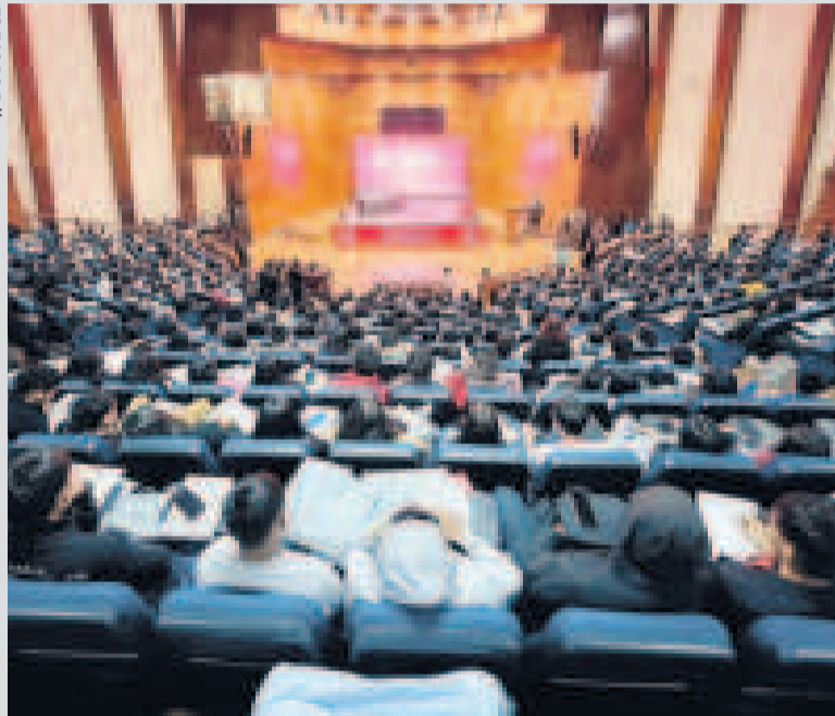
El Encuentro de Economistas, en Sucre, congregó a expertos, académicos y estudiantes.

El Presidente participó en el 17° Encuentro de Economistas y llamó a los académicos a reflexionar sobre los desafíos regionales ante la crisis global.