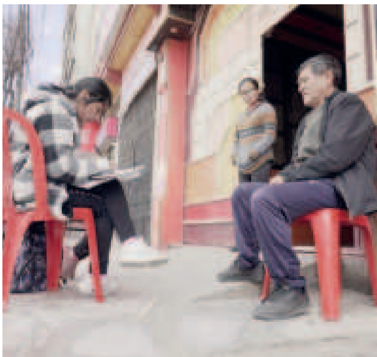
Censo 2024 en el país.