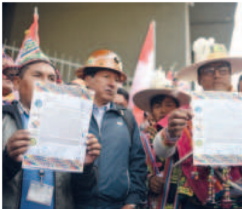
Dirigentes del norte de Potosí.