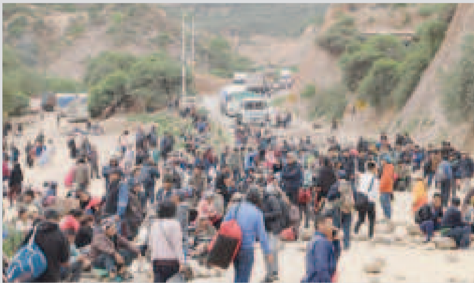
Un bloqueo promovido por afines a Evo Morales en una vía en Cochabamba, en enero de este año.

Grupos opositores como Evo Morales y otros, que dicen estar preocupados por la economía, coinciden en marchas, paros y bloqueos desde mediados de este mes. Para la diputada Deisy Choque, estas movilizaciones solo tienen el objetivo de desestabilizar el país para acortar el mandato del presidente Luis Arce.