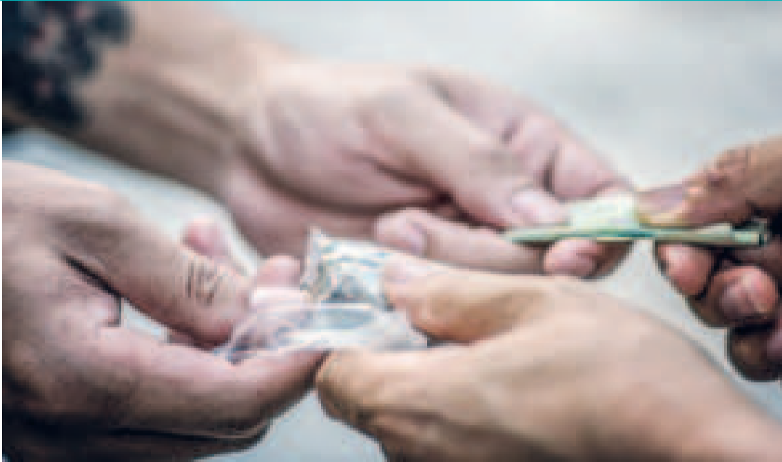
El tráfico de drogas aumenta en Uruguay.