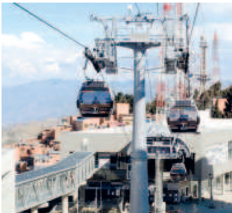
Las cabinas de la Línea Plateada de Mi Teleférico.