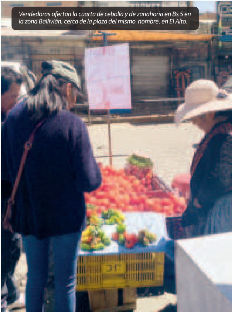
Vendedoras ofertan la cuarta de cebolla y de zanahoria en Bs 5 en la zona Ballivián, cerca de la plaza del mismo nombre, en El Alto.