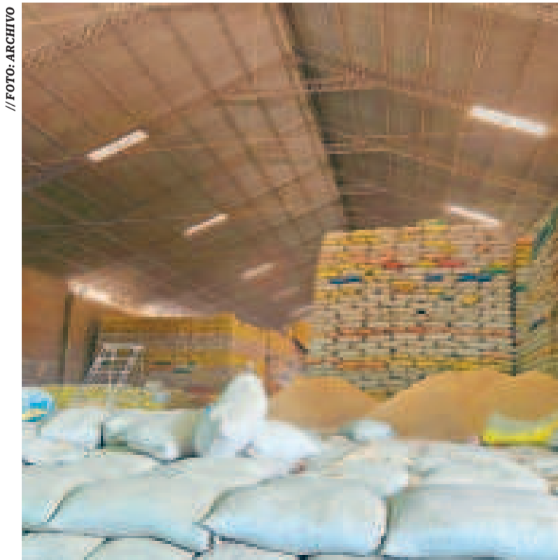
Arroz almacenado en los ingenios de Montero, Santa Cruz.

El Gobierno anunció que se continuarán desarrollando diversas inspecciones para combatir el agio y la especulación en los alimentos.