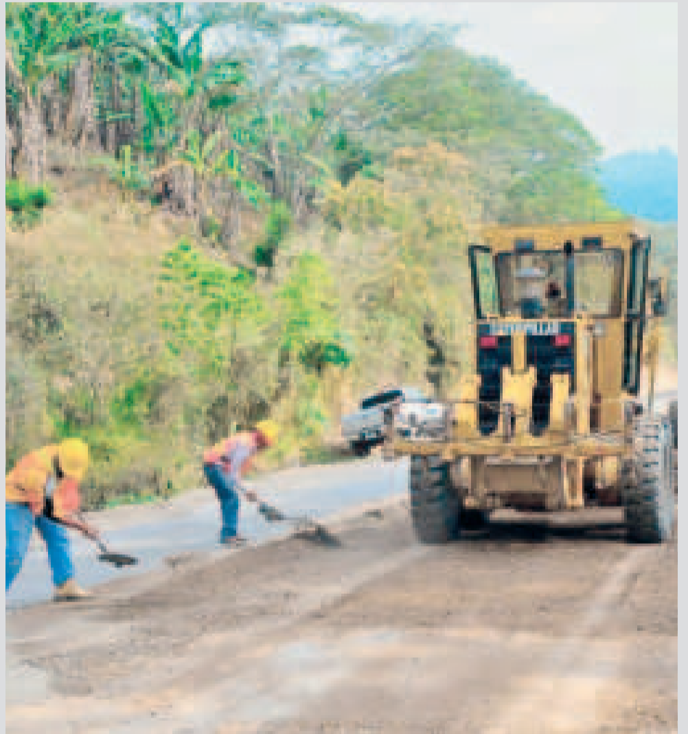
Las obras públicas tienen ahora una mayor posibilidad de ejecución.