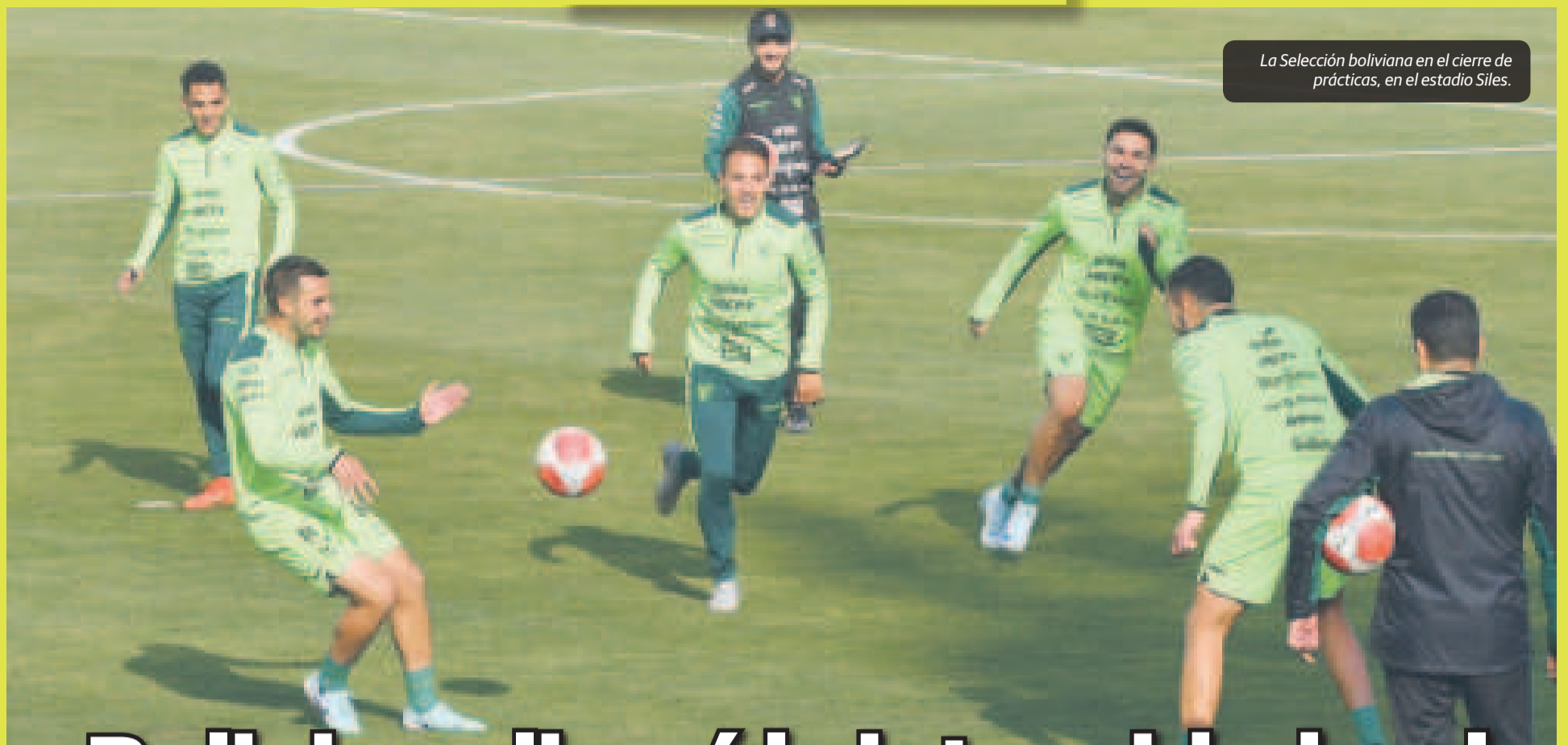
La Selección boliviana en el cierre de prácticas, en el estadio Siles.