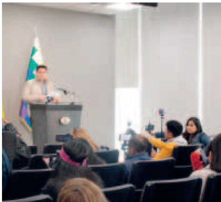
El ministro de Economía, Marcelo Montenegro, en conferencia de prensa.