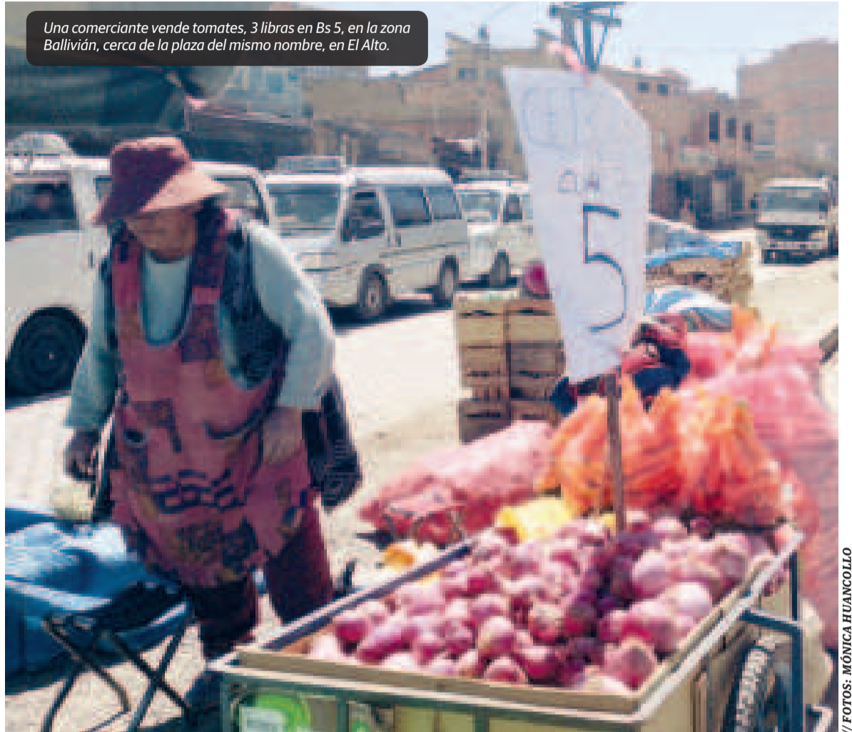
Una comerciante vende tomates, 3 libras en Bs 5, en la zona Ballivián, cerca de la plaza del mismo nombre, en El Alto.