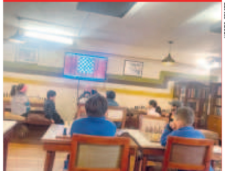
El club Blitz organiza un evento para encontrar nuevos talentos del ajedrez.

Se llevarán a cabo en las sucursales de Sopocachi, que se encuentra en la calle Bellisario Salinas, edificio Bellisario Salinas, mezzanine, oficina 11; y en Ciudad Satélite, Plan 482, avenida 19, calle José Agustín #1711.