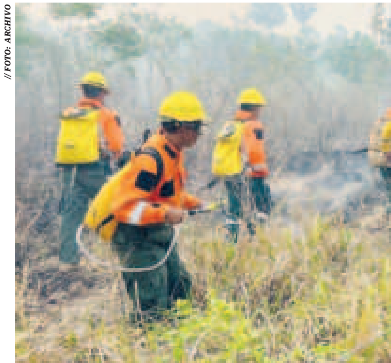
Bomberos forestales de las Fuerzas Armadas luchan contra los incendios.

Señaló además que el departamento está en emergencia y por ello ese tipo de medidas no deberían obstaculizar el trabajo de los bomberos forestales de las Fuerzas Armadas.