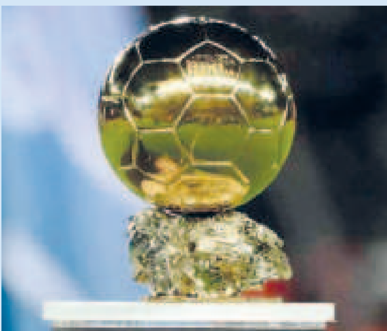
El Balón de Oro, uno de los premios más apetecidos por los futbolistas de jerarquía.