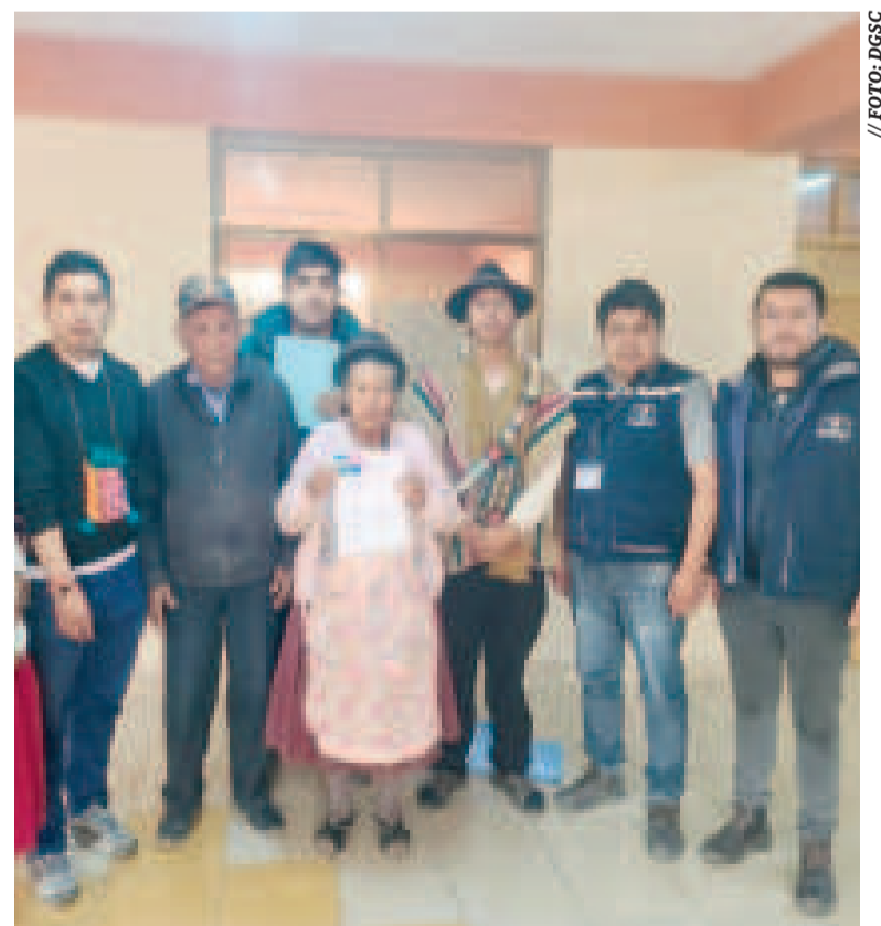
Los representantes de productores de quinua registrados y autoridades de la DGSC.

Esta dirección hace constantes jornadas de socialización y registro para los productores agropecuarios con el objetivo de garantizar el desarrollo de sus actividades productivas.