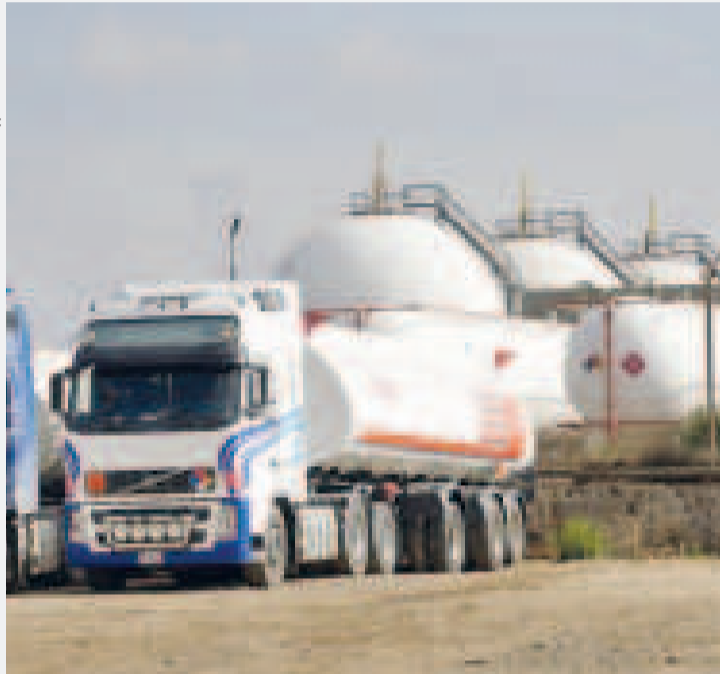
Camiones en lo que se importa hidrocarburos en Santa Cruz.

2005”, menciona el artículo primero de la norma.