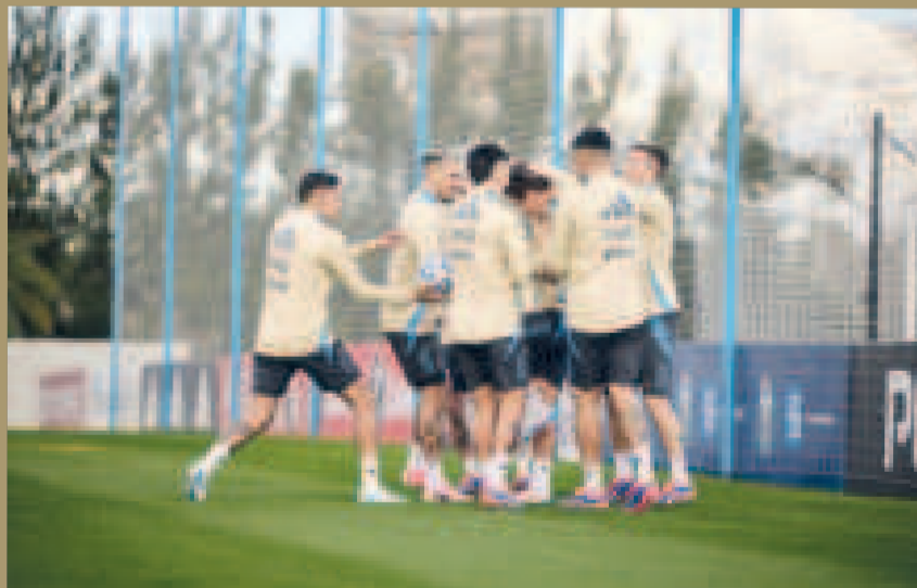
El entusiasmo de los seleccionados argentinos en el cierre de prácticas.

El seleccionado argentino viene de consagrarse campeón en la Copa América 2024 en Estados Unidos,