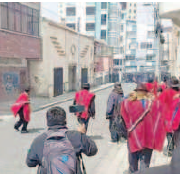
Un grupo de Ponchos Rojos atacó a efectivos policiales en un intento de toma de sede.