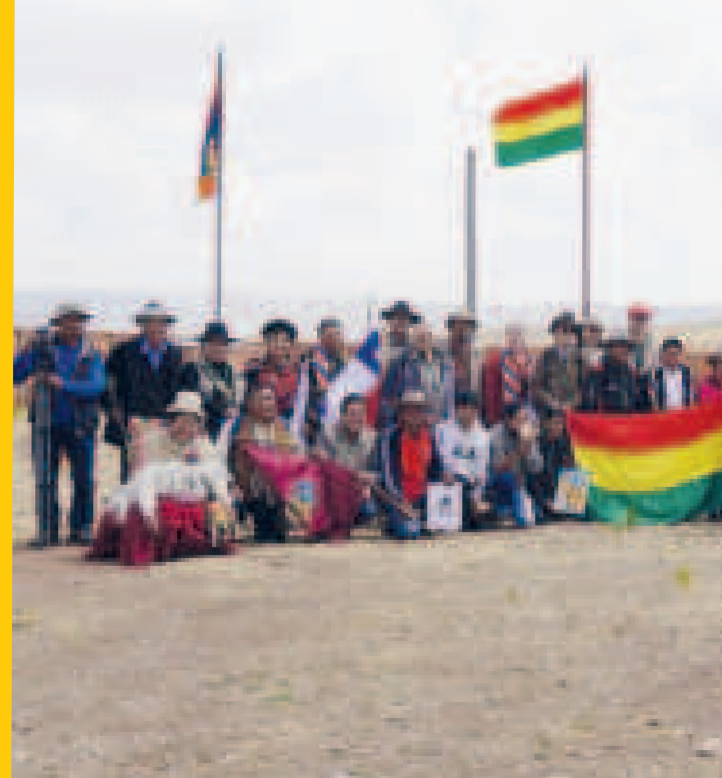
Bolivia, presente en la reunión de 2023.