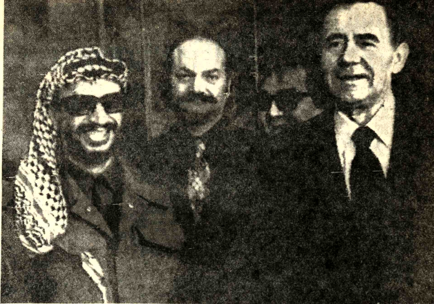
-ENTREVISTA.- Moscú, 7 (AP).- El ministro soviético A.A. Gromyko, derecha, recibió a la delegación de la Organización para la Liberación de Palestina encabezada por el líder de ese movimiento Yasser Arafat, izquierda. Durante el entrevista se conversó acerca de las razones que mueve a los palestinos en su lucha contra dominios foráneos.

Una región que aún no ha aceptado el cese de fuego de noviembre que puso fin a la guerra civil en el resto del país.