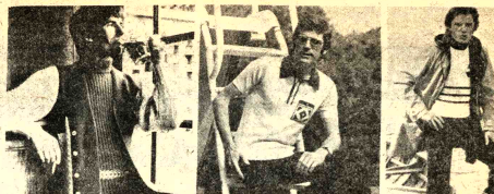
MODA MASCULINA. Izquierda: Fantasía de punto para el atuendo masculino. Destacan las mangas abullonadas en punto de estaca. Centro: Blusa polo con bolsillo de fantasía en tonos blanco y azul marino. Derecha: Atuendo para los deportes del mar.