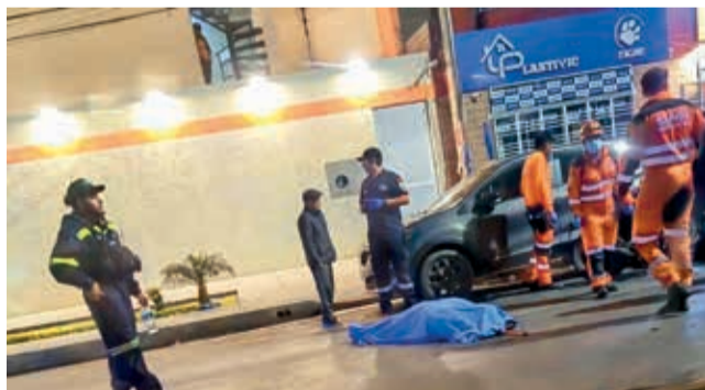
La mujer en el lugar del accidente de tránsito. USTED TIENE

Tragedia. Tras el accidente en la avenida América, el motociclista también terminó con traumas severos y fue evacuado a una clínica