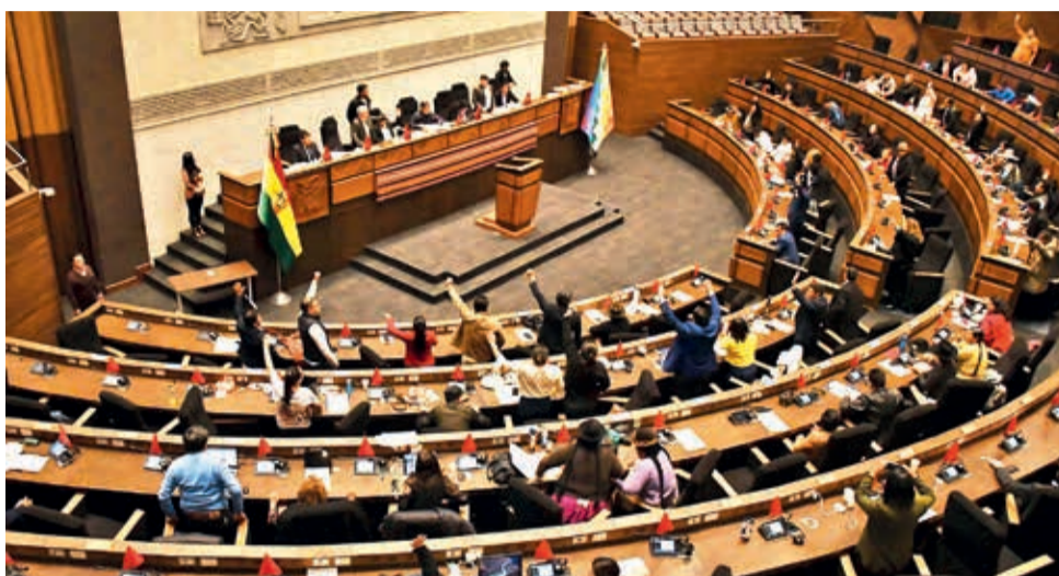
Diputados y senadores en una sesión de la Asamblea Legislativa.

Las etapas de selección incluyen presentación de postulaciones (15 días); verificación de requisitos habilitantes comunes y específicos (3 días); publicación de los postulantes habilitados e inhabilitados (1 día); presentación de impugnaciones (2 días); impugnaciones (4 días); notificación de impugnaciones y publicación de habilitados para la fase de evaluación de méritos (1 día); evaluación de méritos (4 días); revisión de méritos (2 días); notificación de recurso de revisión de méritos (1 día); exámenes orales y exposición de plan de trabajo (5 días), y aprobación de los informes.