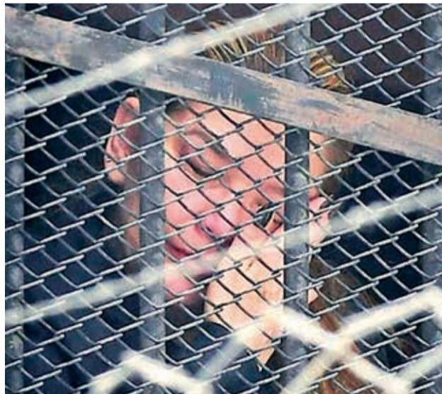
La expresidenta de Bolivia Jeanine Áñez.

En la misma red social, Áñez también reaccionó al inicio