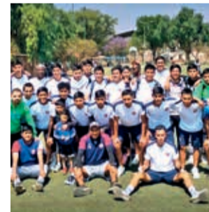
El plantel de Cochabamba FC. AFC

Cochabamba FC goleó 6-0 a San Simón, sumando