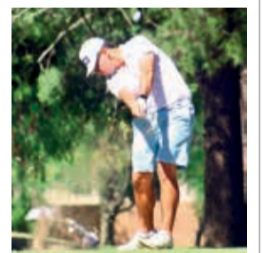
Un golfista, en un torneo anterior.