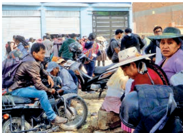
Los afectados se declararon en vigilia, ayer. HERNÁN ANDÍA

“Ya tienen antecedentes y la justicia no hizo nada, siguen libres. Son conocidos, son los mismos que operan en La An-