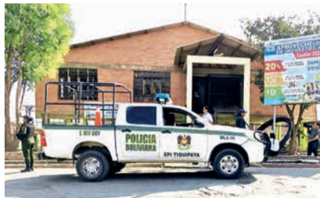
Una patrulla en puertas del mercado de 27 de Mayo. PF

Según los paramédicos del SAR Bolivia, el motociclista terminó con un traumatismo facial, mientras que la mujer acabó con politraumatismos y un traumatismo encéfalo-craneano. Además, en el instante en que recibía la atención médica de emergencia sufrió un paro cardiorrespiratorio.