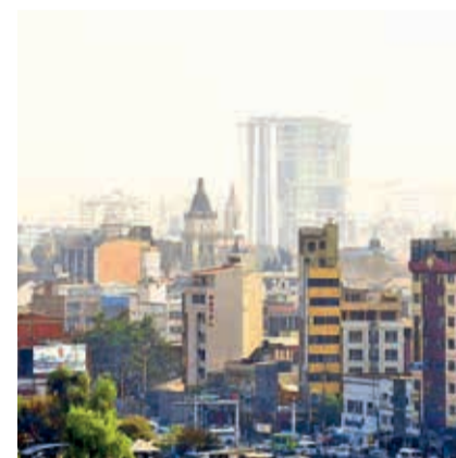
La contaminación atmosférica continuará hasta el jueves. CARLOS LÓPEZ