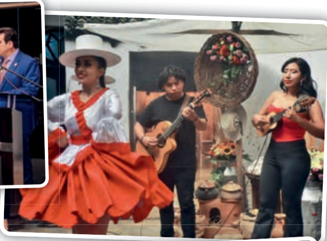
Lanzamiento. Postales de una demostración de los que será el Cocha Fest 2024. JOSÉ ROCHA