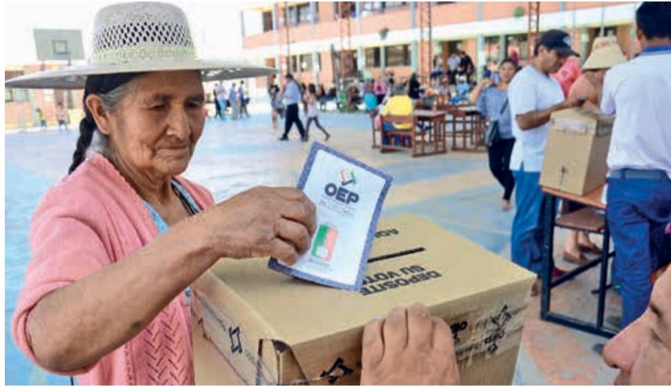
Jornada de votación en el último referéndum realizado en Bolivia en febrero de 2016. JR

se archive la propuesta del referéndum”, dijo.