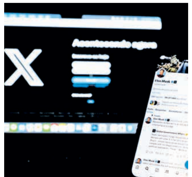
Fotografía de un dispositivo móvil con la red social X, en Río de Janeiro, Brasil.

Los jueces Flavio Dino, Cristiano Zanin, Carmen Lucia y Luiz Fux se pusieron del lado de De Moraes.