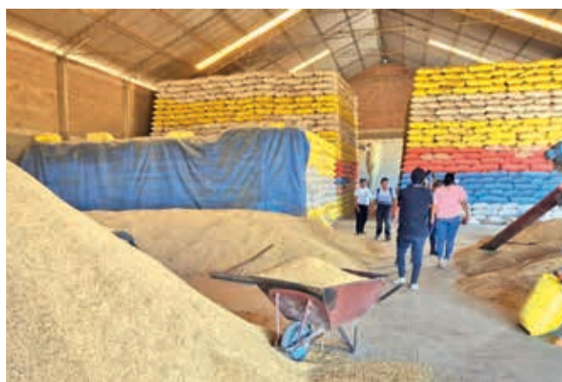
Arroz almacenado en un ingenio en Montero.