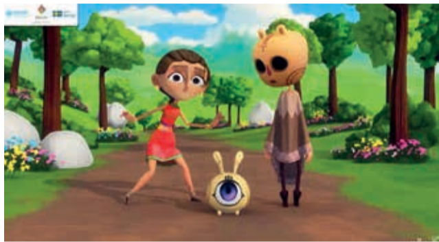
Fotogramas de la serie animada.

La serie, creada en colaboración con la Unodc, la Embajada de Suecia en Bolivia y el Ministerio de Justicia y Transparencia Institucional, fue producida por Naira y Firebot Games para Bolivia TV.