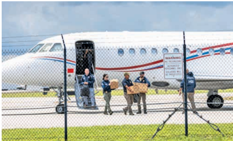
El avión de Nicolás Maduro que fue confiscado por Estados Unidos.

Los cargos por los que se busca a Maduro incluyen