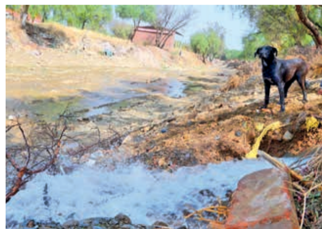
Un punto de descarga de aguas en el río Rocha.