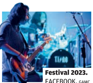
Festival 2023. FACEBOOK. GAMC