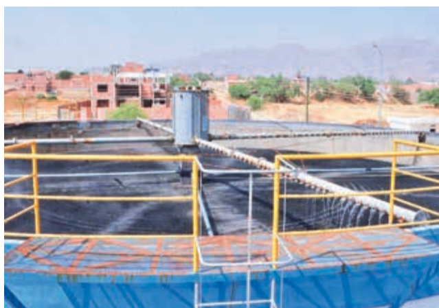
Las piscinas para el tratamiento de aguas residuales.