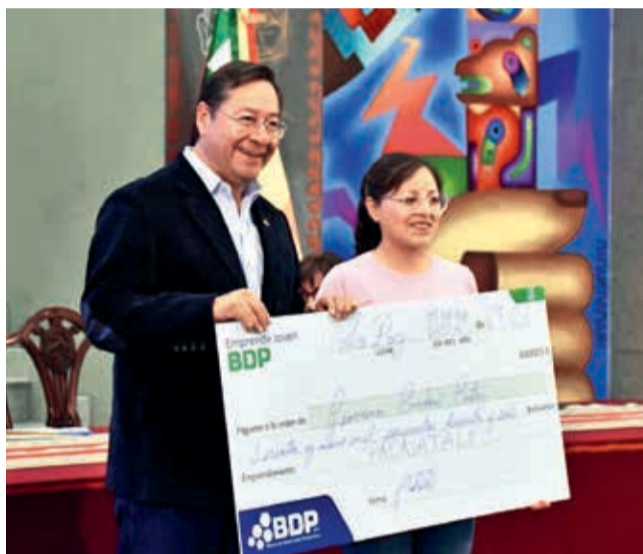
El presidente Luis Arce entrega el primer cheque, ayer.

global de la "generación Z" muestra que cada vez más jóvenes optan por emprender sus propios proyectos en lugar de buscar empleos tradicionales, y Bolivia no es la excepción.