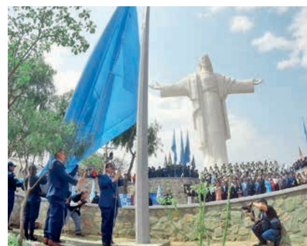
El embanderamiento en el Cristo, un ícono. DANIEL JAMES

En tanto, el municipio de Cercado alista la entrega de 67 obras, entre ellas, la inauguración de la plaza Julio León Prado, este 4 de septiembre. “Vamos a ser la mejor ciudad y con su código urbano”, manifestó el alcalde, Manfred Reyes Villa.