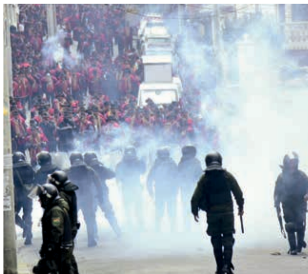
Enfrentamientos entre policías y Ponchos Rojos, ayer. LP

Pidió que “el Estado, antes que usar la represión, genere espacios de resolución de esta conflictividad en todas las movilizaciones que se están dando a lo largo de nuestro país”.