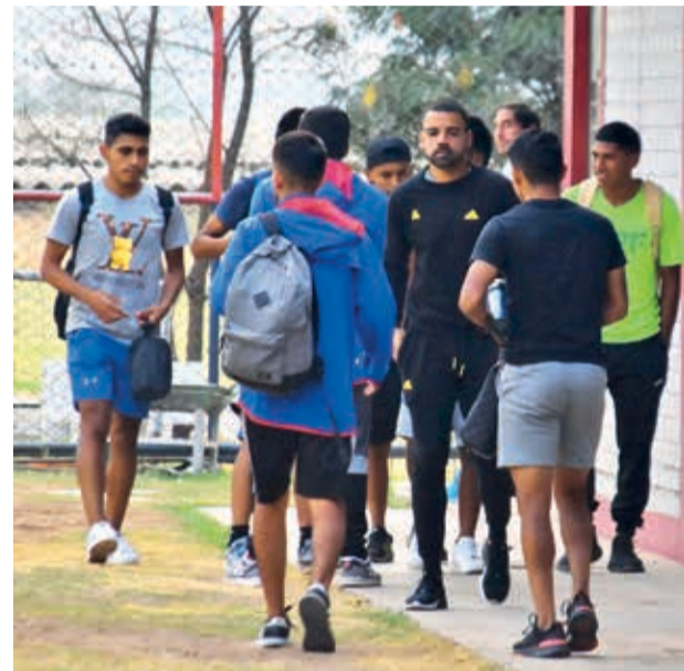
Jugadores de Wilstermann, ayer en el complejo.

Deudas. La dirigencia propuso pagar entre el 60 y el 70 por ciento, pero los jugadores exigen el pago total