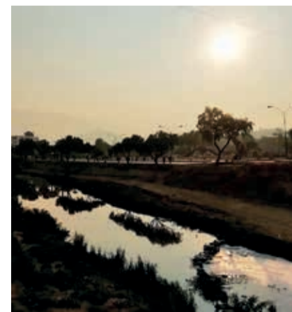
El humo es más notorio a primeras horas de la mañana. CARLOS LÓPEZ