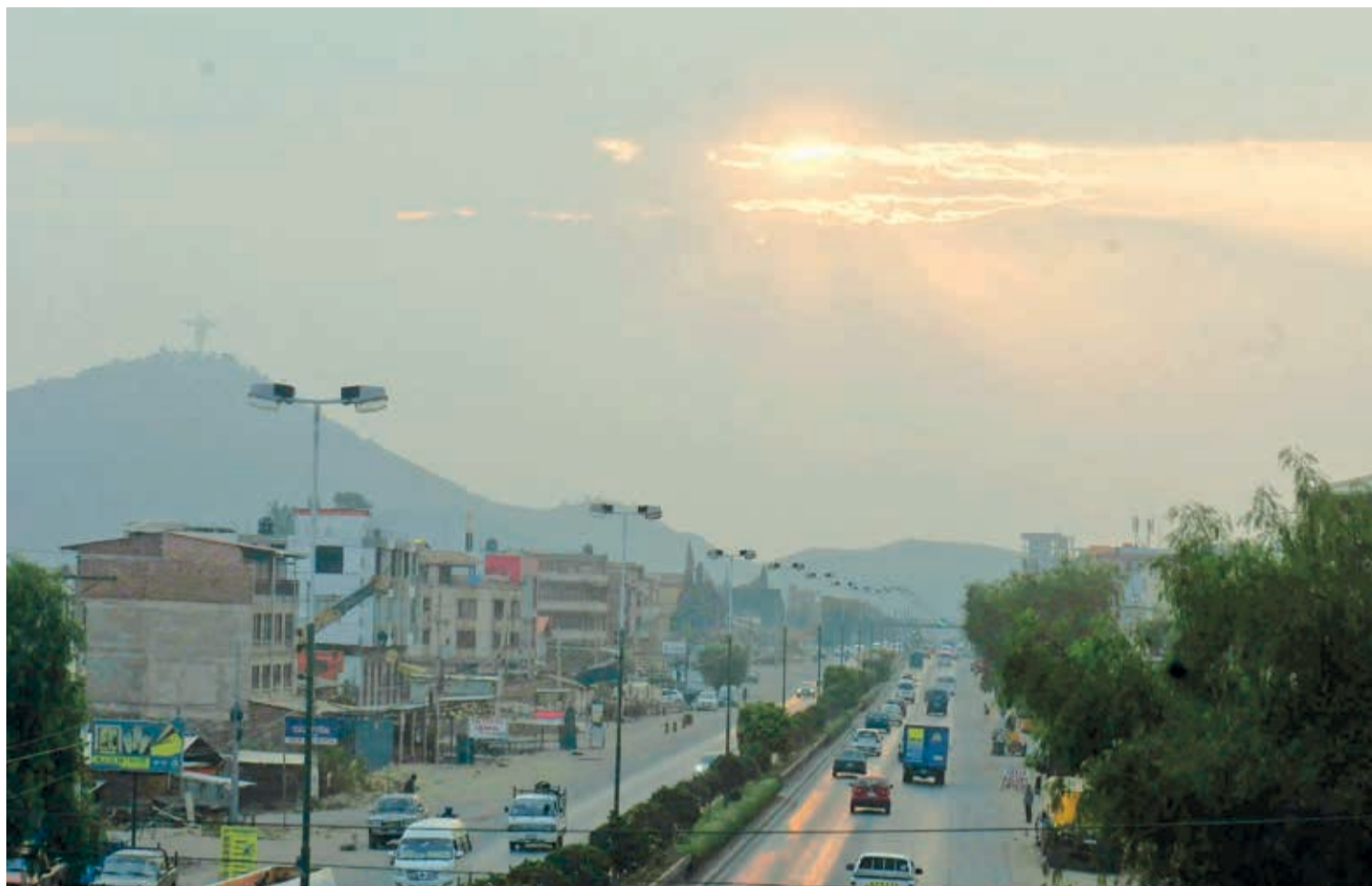
Una densa capa de humo y neblina cubre el cielo de Cochabamba, ayer, durante el atardecer. DANIEL JAMES