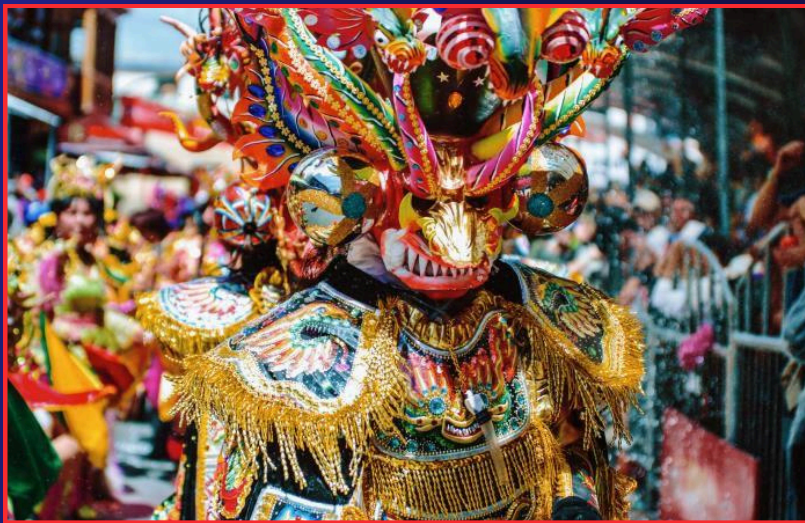
DANZA : DIABLADA BOLIVIANA

La larga y valiosa tradición que la música tuvo durante el período virreinal, continuó durante los primeros treinta años de la vida boliviana.