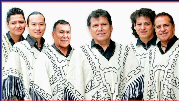
GRUPO FOLKLORICO DE BOLIVIA: LOS KJARKAS