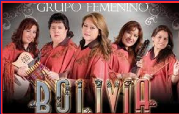
GRUPO FOLKLORICO DE BOLIVIA:GRUPO BOLIVIA