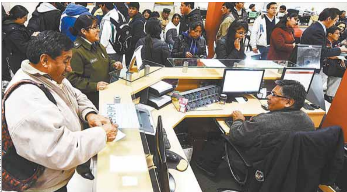
DETERMINACIÓN. Las instituciones del sector público deben empezar a aplicar el horario discontinuo.

Para los vecinos de Cotahuma, desde las 09.00, en inmediaciones del hospital municipal de la zona, se realizará un concurso de técnicas de fútbol, una competencia de disfraces de mascotas, juegos de antaño y zumba. Max Paredes, San Antonio y Centro también tendrán sus actividades.