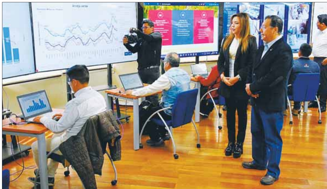
LA PAZ. El presidente Luis Arce en la inauguración del Centro de Monitoreo.

El mandatario advirtió que existen productos de la canasta