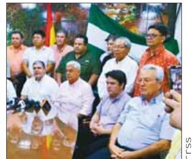
La reunión de los cívicos.

La segunda medida será una marcha multisectorial el lunes 2 de septiembre y la tercera será la reunión de la Asamblea de la Cruceñidad para el día siguiente.