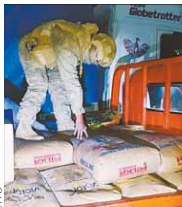
Militares comisan harina ilegal.

Ese objetivo se alcanzó a través de 7.540 operativos de los efectivos del CEO