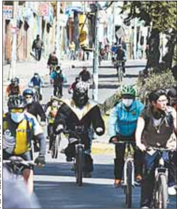
Hay agendas por macrodistrito.

Las subalcaldías de La Paz preparan actividades para este domingo