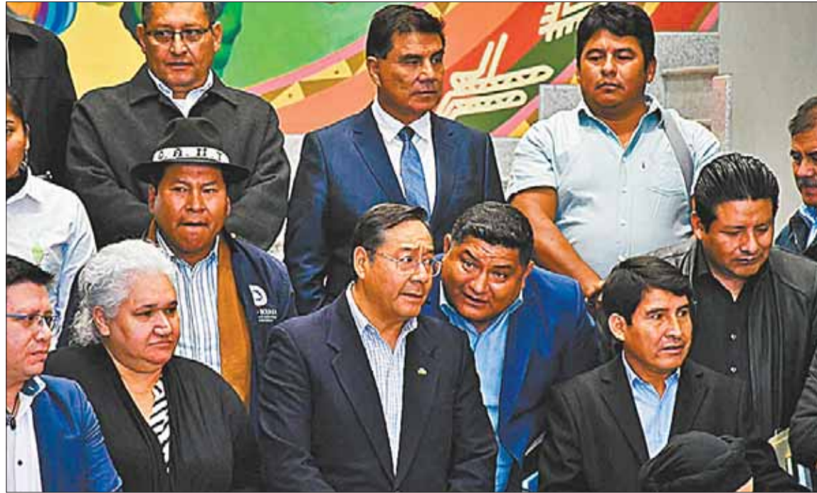
RESPALDO. El presidente Luis Arce, junto a las autoridades del Consejo Nacional de Autonomías.

El Presidente exhortó a las autoridades que se manifestaron por el resultado del Censo a ser ‘claras y sinceras’, pues ‘con mentiras no se resuelven los problemas’