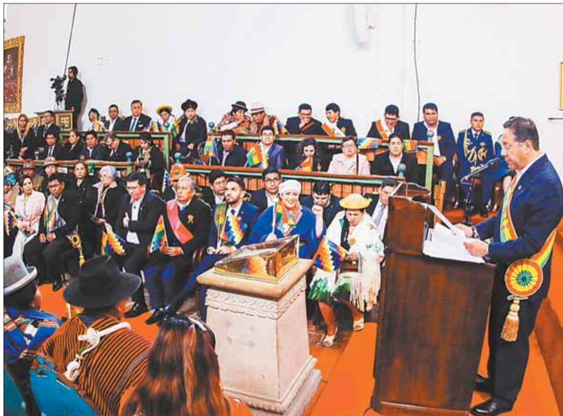
CONSULTA. El presidente Luis Arce anunció el 6 de agosto, en Sucre, el referéndum nacional.

El TSE insiste en los 90 días y se abre a otra fecha