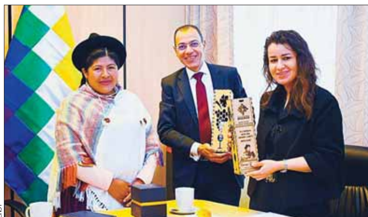
REUNIÓN. La Ministra de Culturas y el Embajador de Egipto.

El evento promete dejar una huella significativa en la comunidad local. Busca destacar la importancia del conocimiento ancestral en la gestión de los recursos naturales y fomentando un entendimiento más profundo de los desafíos que enfrentan las tierras bajas del país.