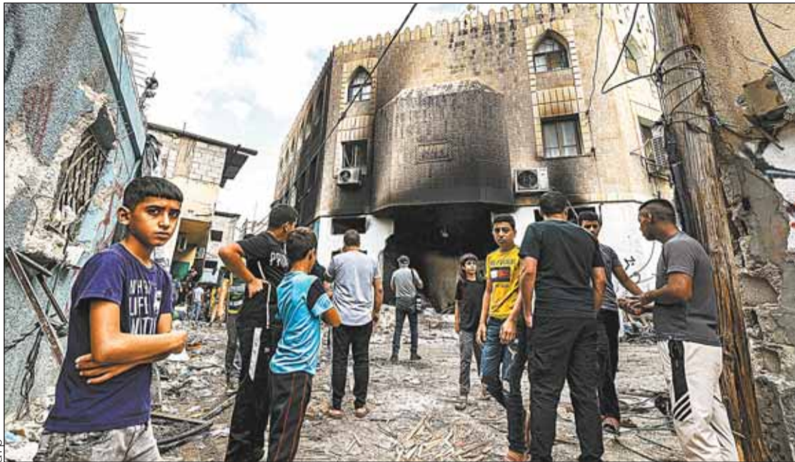
ATAQUES. La violencia recrudeció en Cisjordania ocupada desde el inicio de la guerra en Gaza.