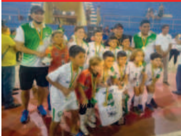
Selección cruceña de fútbol Sub-10 ganó el título nacional.

La gran final tuvo un gran partido entre los dos favoritos, pero los cruceños mostraron un mejor juego y salieron victoriosos por 7-4.