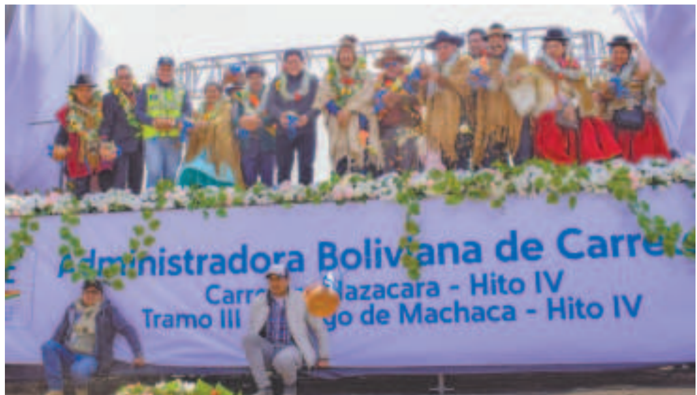
El presidente Luis Arce junto a autoridades nacionales y locales, en el acto de inicio de obras de la carretera, ayer.

Esta obra beneficiará a más de 42 mil habitantes de la región. La empresa adjudicada es Asociación Accidental Santiago-Hito IV