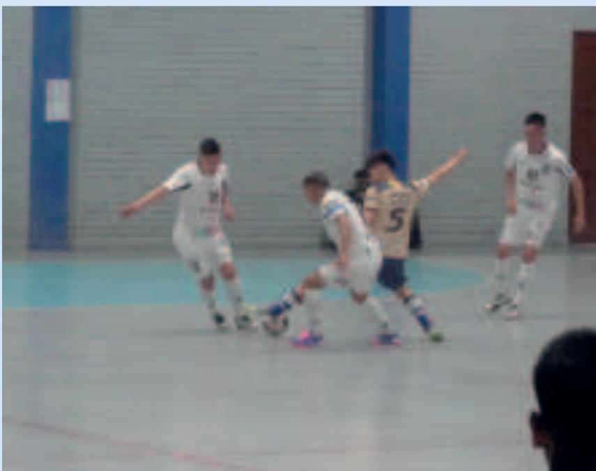
Una incidencia del cotejo entre Fantasma y Víctor Muriel, en Cochabamba.