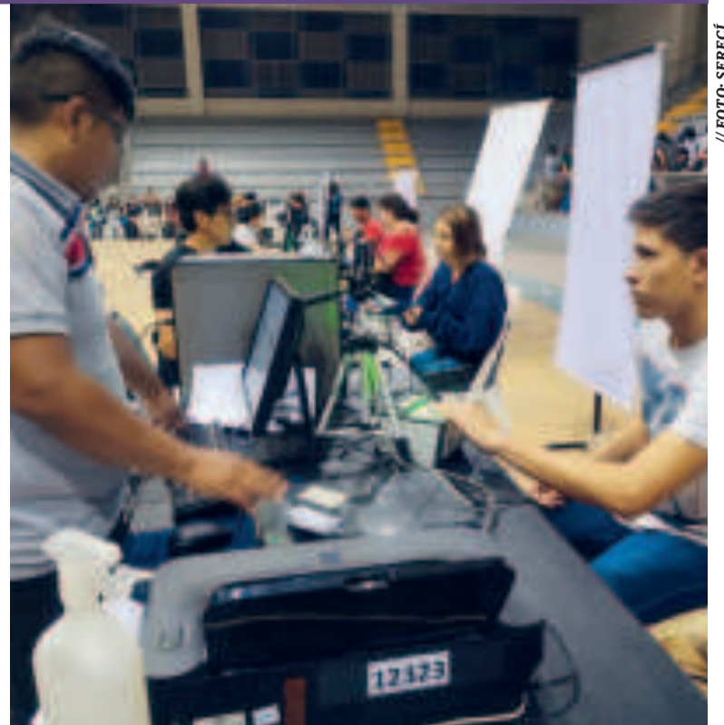
Empadronamiento de cara a las elecciones judiciales de diciembre.