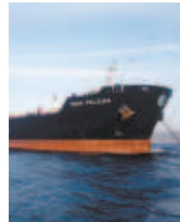
Buque con combustible boliviano.

Expresó su preocupación por estas acciones y señaló que benefician a la oposición y ponen en riesgo el futuro del MAS. Manifestó su deseo de pacificar la situación y que cesen las "críticas infundadas" y "calumnias" contra su gobierno y su familia.