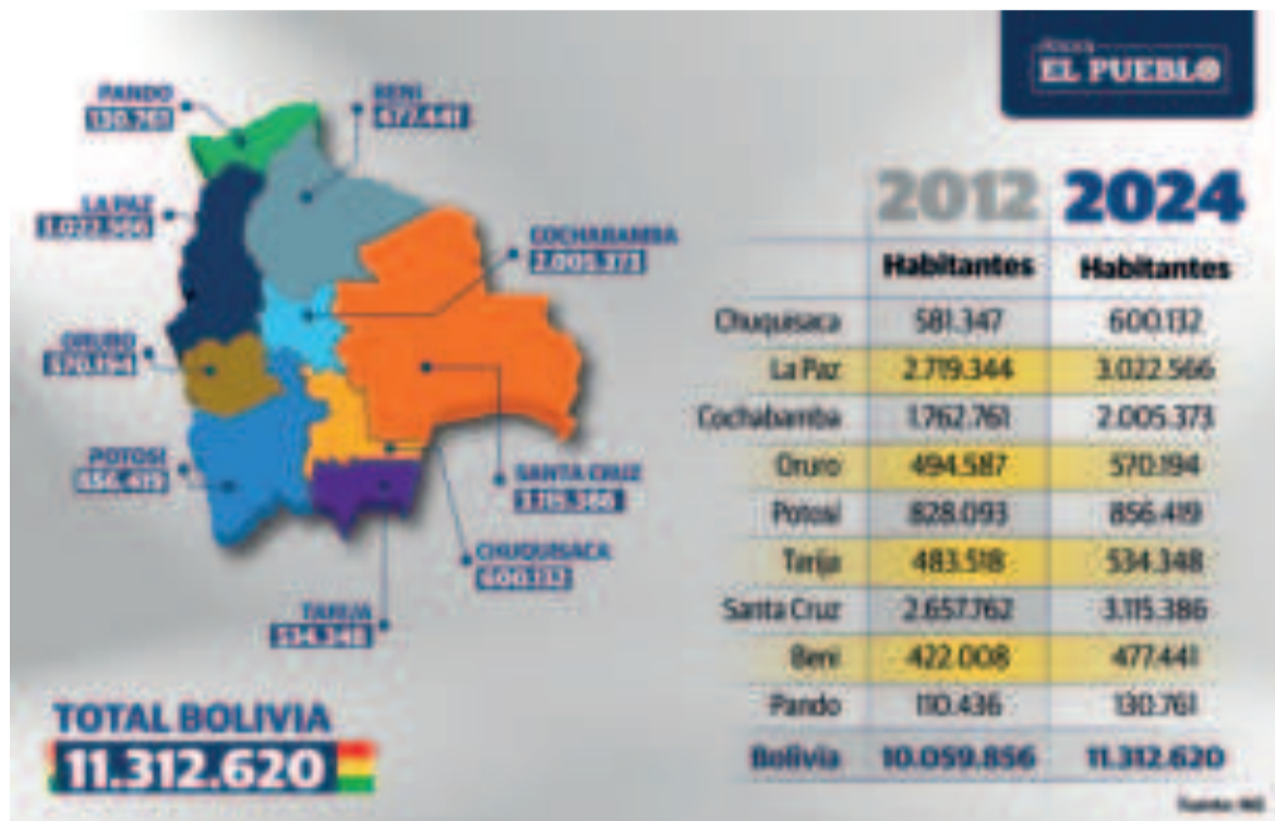
Información oficial del censo.

Alto Nivel, que es la instancia técnica consultiva en apoyo al Ministerio de Planificación del Desarrollo y al Instituto Nacional de Estadística, respaldó el trabajo técnico del INE.