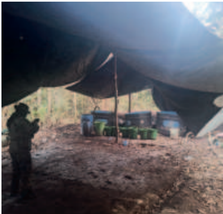
Efectivos de la FELCN destruyen fábricas de droga en el Chapare.

Al abrir la caja de cartón, se encontraron 10 cajitas de fósforos que contenían una sustancia blanquecina. Luego de realizar la prueba de campo, se confirmó que se trataba de clorhidrato de cocaína, añade un reporte.