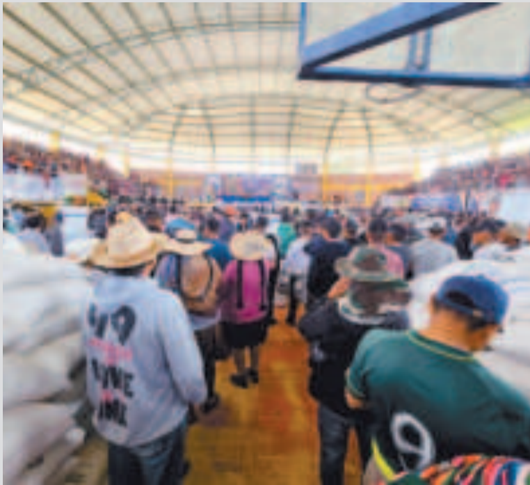
Los insumos entregados ayer.