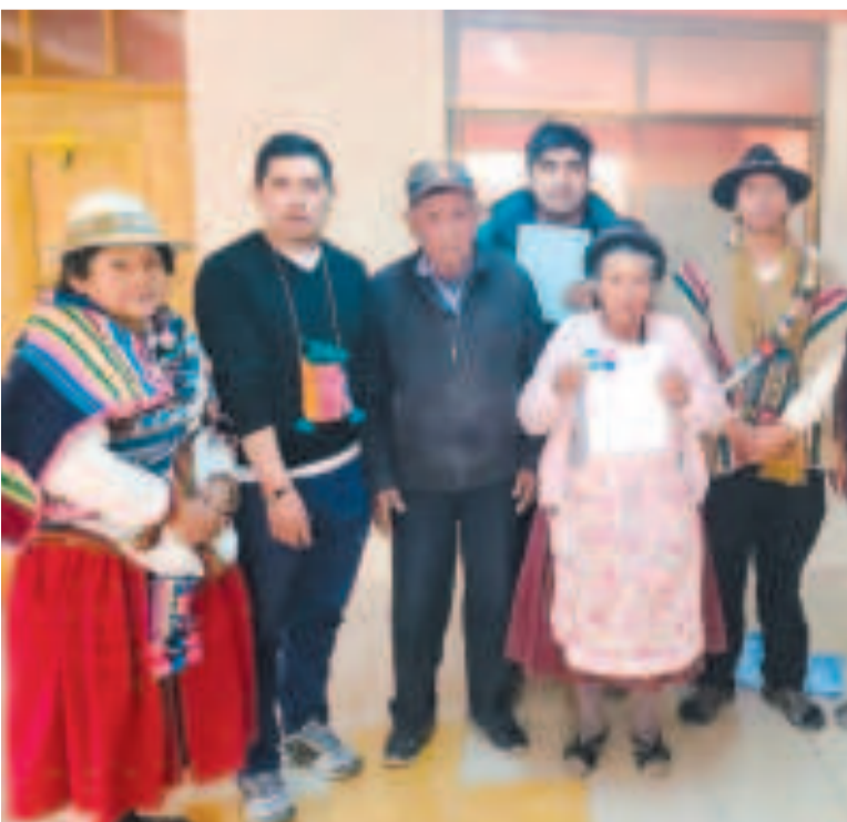
Productores de los municipios de Challapata y Salinas.