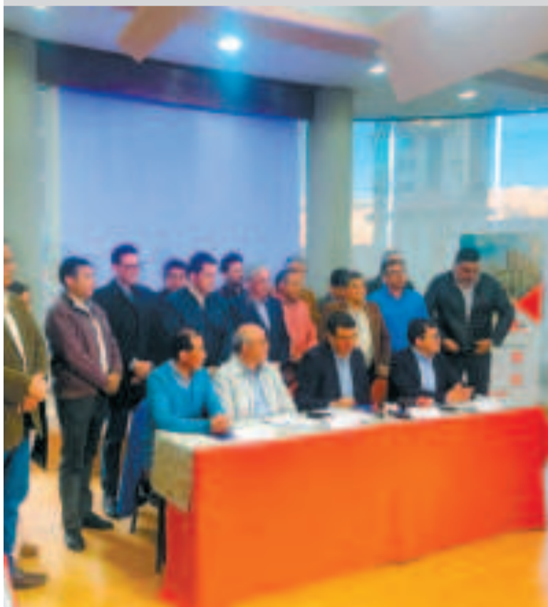
Los representantes y directivos de Caboco en conferencia de prensa.