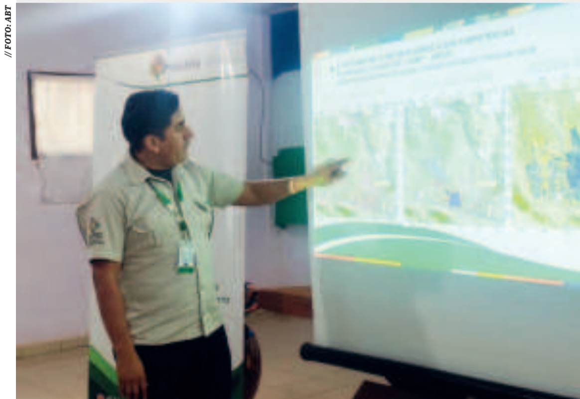
Un técnico de la ABT muestra lugares afectados por los incendios.

En la Universidad Gabriel René Moreno de Santa Cruz, el empadronamiento continuó hasta pasadas las 20.00, de acuerdo con informes de medios de prensa.