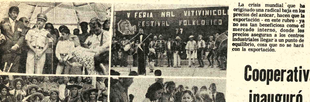
COOPERATIVA CATEDRAL DE TARIJA. Inauguró un moderno edificio. En la foto de arriba se ve al Prefecto del Departamento, Jorge Viló Balcón, dirigiendo la palabra en el acto de inauguración.