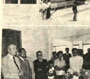
LA COOPERATIVA DE AHORRO Y CRÉDITO CENTRAL LÍDRA. La Cooperativa de Ahorro y Crédito Central LÍDRA, inauguró un nuevo local. En el foto de abajo vemos al Prefecto del Departamento, Jorge Viló Balcón, dirigiendo la palabra en el acto de inauguración.

Para el aprovisionamiento de caña a todos ellos, según la Comisión Nacional de Estudios de la Caña de Azúcar (CONCA) se tiene 88.511 hectáreas de caña de diferentes especies. Con esta área se garantiza el funcionamiento de todos los ingenios. Dentro la planificación, durante la zafra del presente año, se estima obtener, 4.800.000 quintales de azúcar, con más la producción del ingenio azucarero de Bermejo. Esa cifra representa casi un 50 por ciento más que en 1976. El consumo interno es de tres millones quintales, lo que significa que habrá un excedente de 1.500.000 quintales.