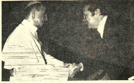
ENTREVISTA. Ciudad del Vaticano 21 (AP). El Primer Ministro portugués, Mario Soares, estrecha la mano del Papa Paulo VI durante la audiencia privada que le concedió el Pontífice. Mario Soares realiza una visita oficial a Italia.