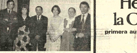
INAUGURACION - La Compañía Hotelera Boliviana S.R.L. ofreció un cocktail en ocasión de la inauguración del Hotel "El Dorado" en la Av. Villazón.

(Viene de la página 3) Senillamente los están echando a perder, dándoles una educación occidentalizada a machaca martillo, con el pretexto de civilizarnos, culturizarlos, incorporarlos. El único maestro que llegó a comprender el problema fue Elizardo Pérez. Y esa su obra incomparable. Los occidentales, del indio, la han destruido. Y ahí está lo peor para el indio, su occidentalización. Los efectos ya se notan. La pérdida de sus inestimables virtudes es resultado de la apropiación de las taras de la cultura occidental, como el egoísmo, la indiferencia y sus efectos concomitantes, como la negación de la cuna, el desentramado, el abandono de sus tierras. En fin, todos estos fenómenos no son difíciles de apreciar. Están a la vista. Lo más interesante es que nadie se interesa por ellos.