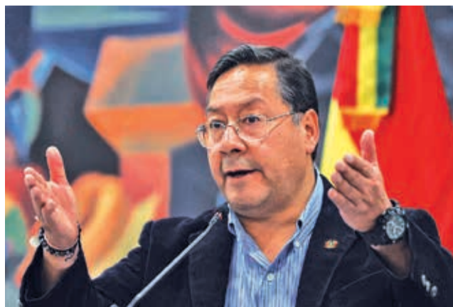
El presidente Luis Arce Catacora.

2026. Durante una entrevista con el portal Diario Red, Arce responsabilizó a su predecesor y líder del Movimiento al Socialismo (MAS), Evo Morales, y su gabinete de ministros por no haber comprendido ni implementado adecuadamente el modelo económico que él concibió, lo cual, según Arce, derivó en la crisis actual.