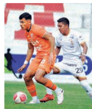
Cotejo Real Santa Cruz vs Royal Pari, ayer.