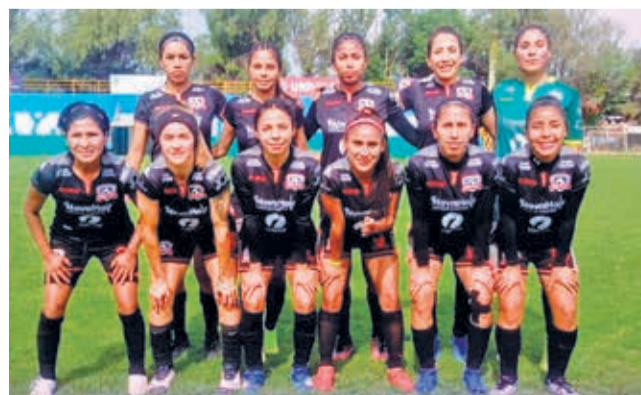
El plantel de Astor FC, en la previa del duelo ante Deportivo ITA en Tiquipaya, el sábado.

Por su parte, Always Ready repitió la dosis de la ida y goleó 3-0 al chuquisaqueño Bustillos Presto, en partido desarrollado el sábado en el Com-