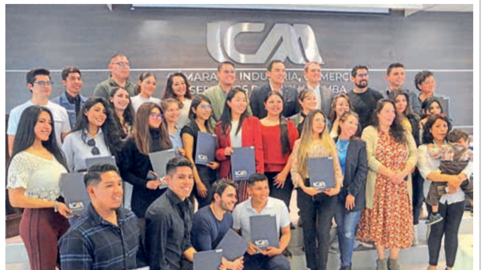
Jóvenes empresarios de la 4ª versión del Programa Emprendedores de la ICAM. H.A.