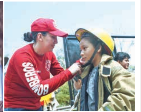
Un niño vestido de bombero cumple su sueño de ser un integrante más, ayer.