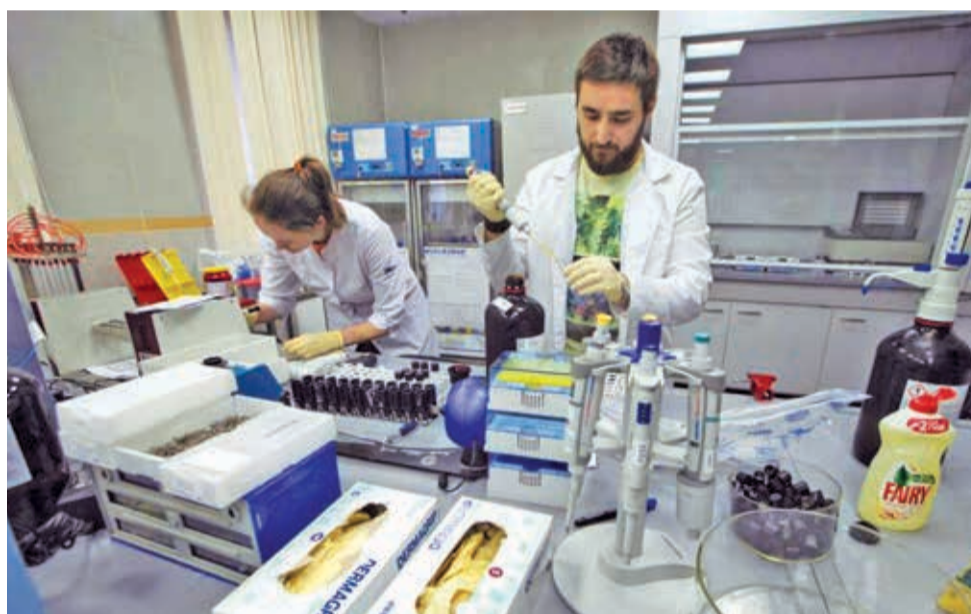
Toma de una muestra en un laboratorio antidoping (imagen ilustrativa). ELUNIVERSO.COM

El ciclista potosino Óscar "Volcán" Soliz fue uno de los casos que más conmoción generó en el deporte boliviano.