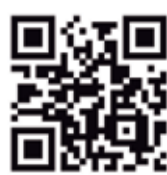
AL PODCAST DE LA ENTREVISTA

El consumir lo producido en Bolivia, el comprar productos legalmente importados, en realidad lo que es la formalidad es algo que nosotros tenemos que incentivar.