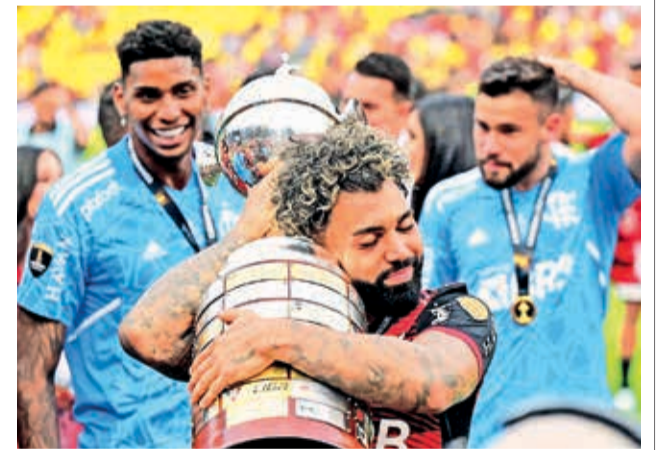
Flamengo, ganador de la Copa Libertadores 2022.