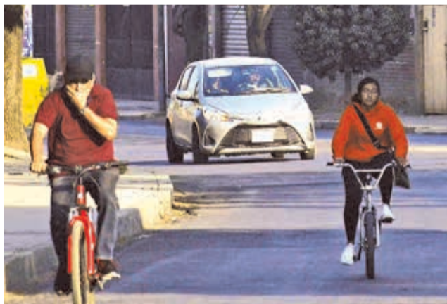
Un vehículo circula sin autorización, ayer.

La jornada también fue aprovechada para mostrar innovación; por ejemplo, el emprendimiento Briz que se dedica a la reutilización de bicicletas presentó y alquiló los triciclos, las carrozas, las bicicletas dobles y las personalizadas que fabricó.