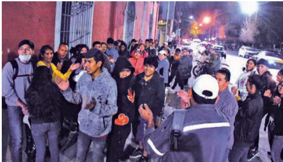
Personas hacen fila para registrarse en el Padrón Electoral, el sábado. CARLOS LÓPEZ

Vargas señaló que este aumento en los registros es motivo de celebración, ya que evidencia un despertar cívico