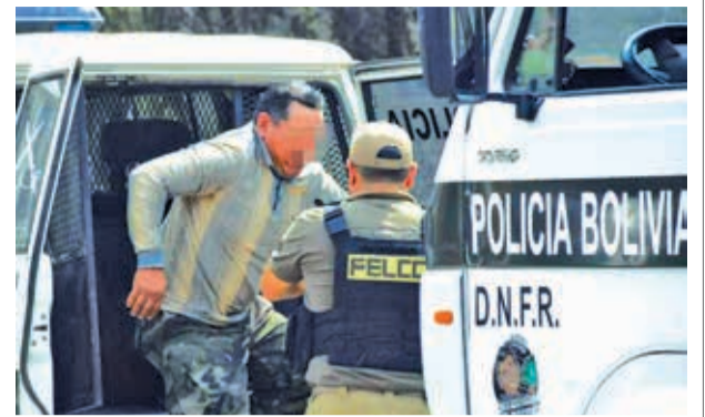
El detenido sale de una patrulla policial. CARLOS LÓPEZ

1.000 millones de bolivianos, unos 650 millones son destinados al pago de servicios como prediarios en las cárceles, sueldos, bonos, campañas de salud, subsidios y otros. Sólo se tienen para atender esas demandas 180 millones de bolivianos.