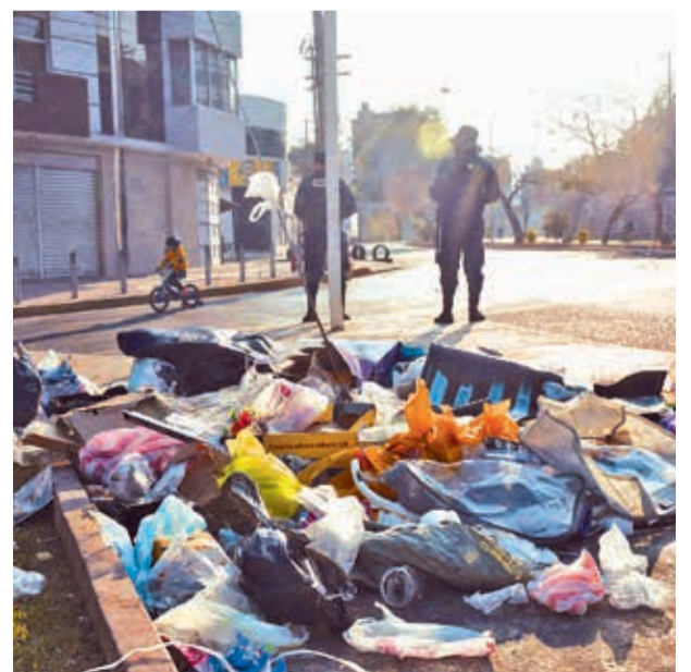
Un basural es un esquina de la ciudad, ayer.