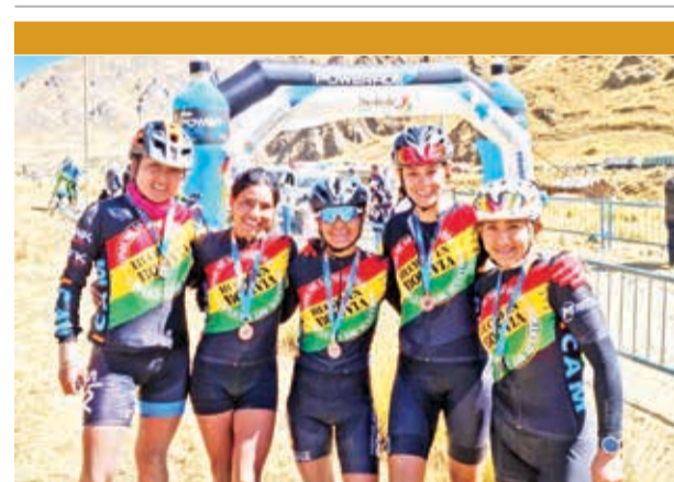
Equipo de ciclismo Hecho en Bolivia. LOS TIEMPOS

“Es el momento propicio para reflatar esta campaña y su visión inicial. Hoy estamos aquejados por este flagelo del contrabando. Para darles una idea, a nivel latinoamericano, el contrabando representa 210 mil millones de dólares. Esto es aproximadamente el 2 por ciento del PIB de la región. En Bolivia la cifra de afectación del contrabando es de 3.500 millones de dólares anuales”.