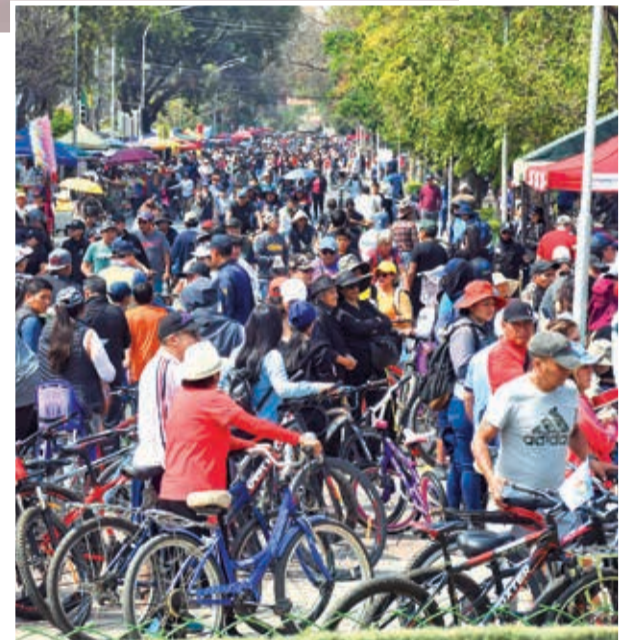
Los ciclistas y peatones se apoderaron de El Prado.