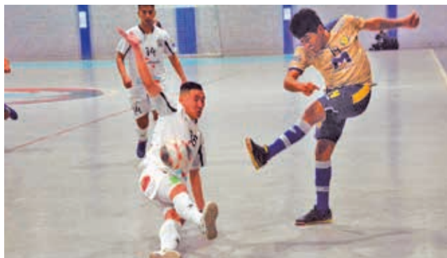
Pasaje del duelo entre Víctor Muriel y Fantasmas Morales Moralitos, el viernes en Cochabamba. HERNÁN ANDÍA

En otros resultados del grupo, Adu toys de La Paz goleó 5-0 al chuquisaqueño Anto-