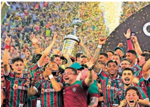
Festivo de Fluminense, campeón de la Copa Libertadores 2023.