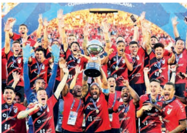
Athletico Paranaense, campeón de la Copa Sudamericana 2021.