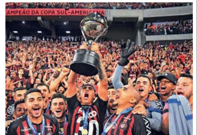
Athletico Paranaense y su primer título de la Copa Sudamericana en 2018.