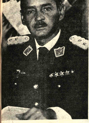
MENSAJE.- Mediante la cadena de radio y televisión, el presidente Banzer comunicó a la Nación el pedido boliviano de un tanto Chile como Perú, desistan de sus planteamientos para hacer posible la solución del problema mediterráneo.

Ofrece, a cambio, los aportes que sean necesarios para establecer un gran polo de desarrollo tripartito en la zona que le sería transferida