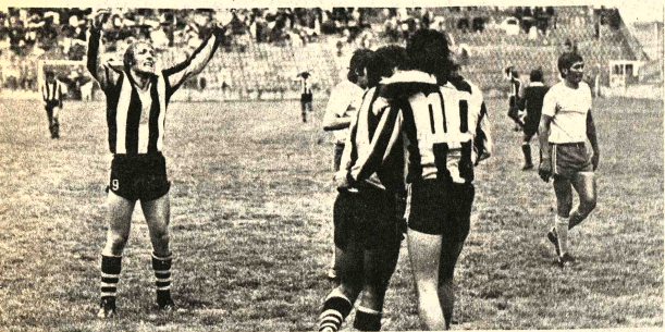
FRENTE A AURORA: Mañana el conjunto de The Strongest jugará en el estadio "Liberador Simón Bolívar" con Aurora, de Cochabamba. Los "atigrados" confían en conseguir la victoria.