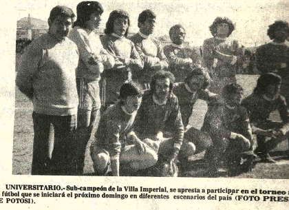
UNIVERSITARIO.- Sub-campeón de la Villa Imperial, se apresura a participar en el torneo de fútbol que se iniciará el próximo domingo en diferentes escenarios del país.