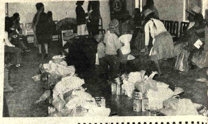
EL COMITE DE DAMAS del Club de Leones de Potosí entregó viveros a mujeres de escasos recursos económicos de esa ciudad, como parte central de su programa preparado para celebrar el Día de la Mujer. En la foto, una escena del acto.

El cortejo fúnebre partirá de la Av. Chile No. 1192 Favor que comprometerá a la familia doliente. La Paz, Octubre, 1976