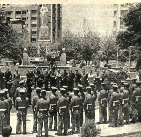
Florales en los monumentos de la Reina Isabel La Católica y de Cristo Rey. Una fracción de cadetes del Colegio Militar de Ejército...

Los trabajos serán realizados por cinco brigadas geológicas, en las que intervendrán técnicos de la COMIBOL.