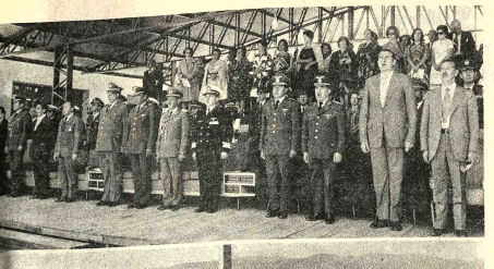
El Instituto Boliviano de Turismo, la Organización de Estados Americanos y la Corporación de Desarrollo de Chuquiaca firmaron en Sucre un convenio para la ejecución de un plan fomento turístico para las zonas del sur, según informaron autoridades turísticas del Ministerio de Industria, Comercio y Turismo.

- Se inicia promoción para el Congreso del Atlas 77 -