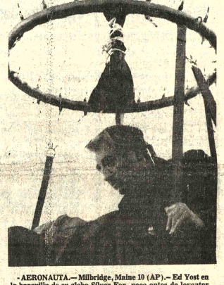
— AERONAUTA.— Milbridge, Matías 10 (AP).— Ed Yost en la burbuja de su globo Silver Fox, poco antes de levantar vuelo para tratar de atravesar el Atlántico. Yost se vio obligado hoy a descender en el Mar Caribe de las Azores.

Se inaugurará hoy en Santa Cruz la Duodécima Asamblea General de la Asociación Latinoamericana de Ferrocarriles (ALAF), con sede en Cochabamba, en el Hotel Continental de la ciudad de Santa Cruz. Se prevé la asistencia de más de 150 delegados de los países afiliados a ALAF y de organismos internacionales como el Banco Mundial, el Banco Interamericano de Desarrollo, la Organización de Estados Americanos y otros, que asistirán en calidad de observadores.