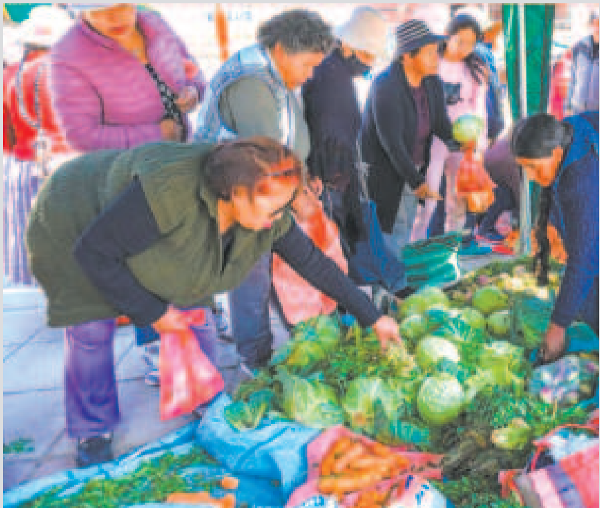
Las ferias Del Campo a la Olla garantizan el precio y peso justo de productos para la población boliviana.