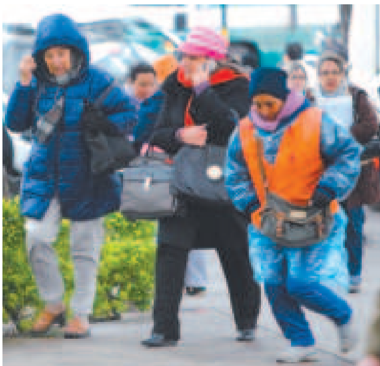
El Senamhi pronostica un frente frío para este fin de semana.

El Senamhi tiene como misión proveer servicios meteorológicos, hidrológicos y climáticos confiables y oportunos a la sociedad boliviana.