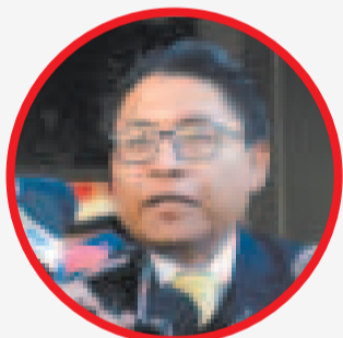
EL MINISTRO DE JUSTICIA, IVÁN LIMA, afirmó que no se “violentarán los poderes del Estado”.

El ministro enfatizó en que la “independencia de los poderes del Estado es fundamental para la democracia”, por lo tanto dijo: “No la vamos a vio-