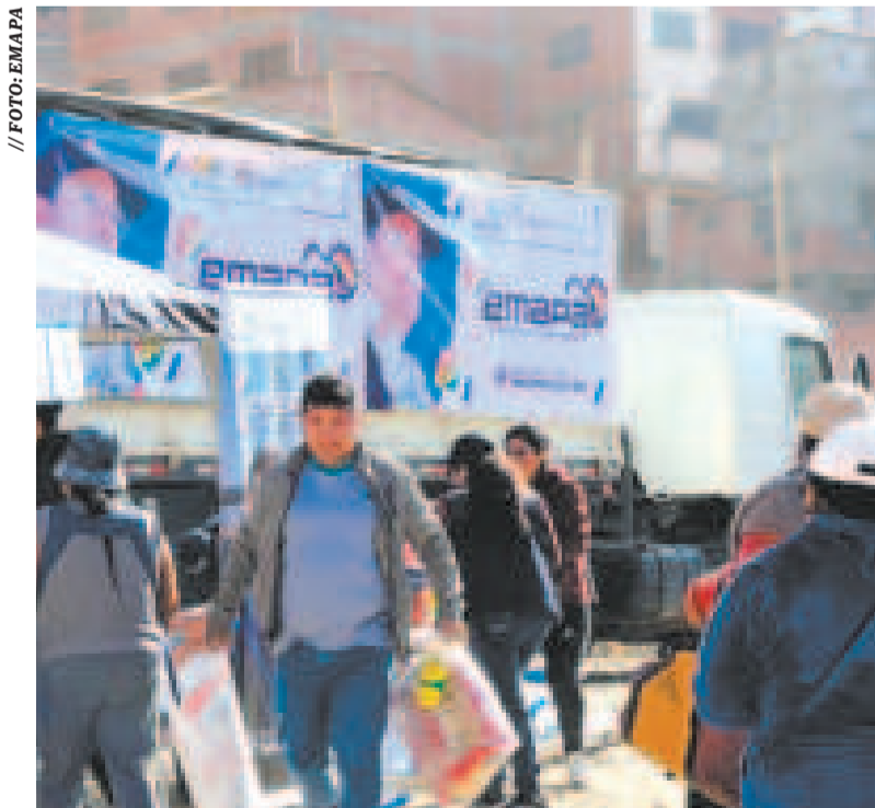
Los vecinos acudieron a la feria móvil de Emapa, en Kalajahuirra.

“Continuaremos trabajando desde muy tempranas horas para evitar que haya una reventa de nuestros productos y también para frenar el agio y la especulación en el mercado”, agregó el ejecutivo.