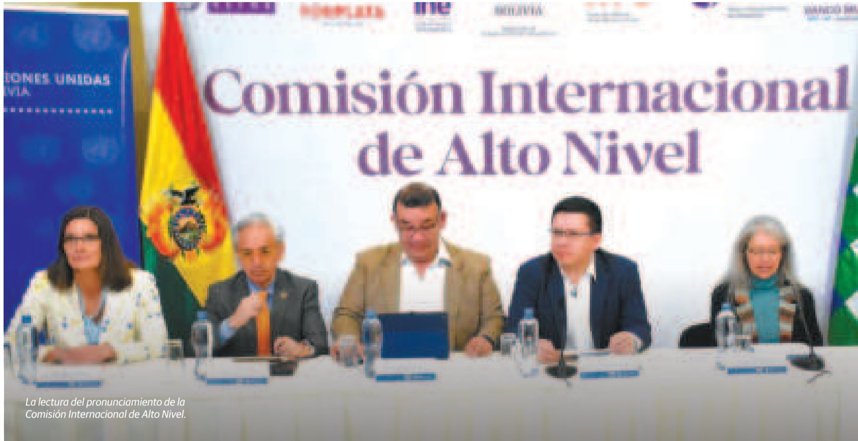
La lectura del pronunciamiento de la Comisión Internacional de Alto Nivel.

“Los organismos internacionales que conformamos esta comisión hemos acompañado de manera mancomunada, conforme a las capacidades y mandatos y en cada etapa del proceso censal, proporcionando asistencia técnica especializada, financiamiento, apoyo operativo y además de una asesoría constante”, precisó Pesántez.