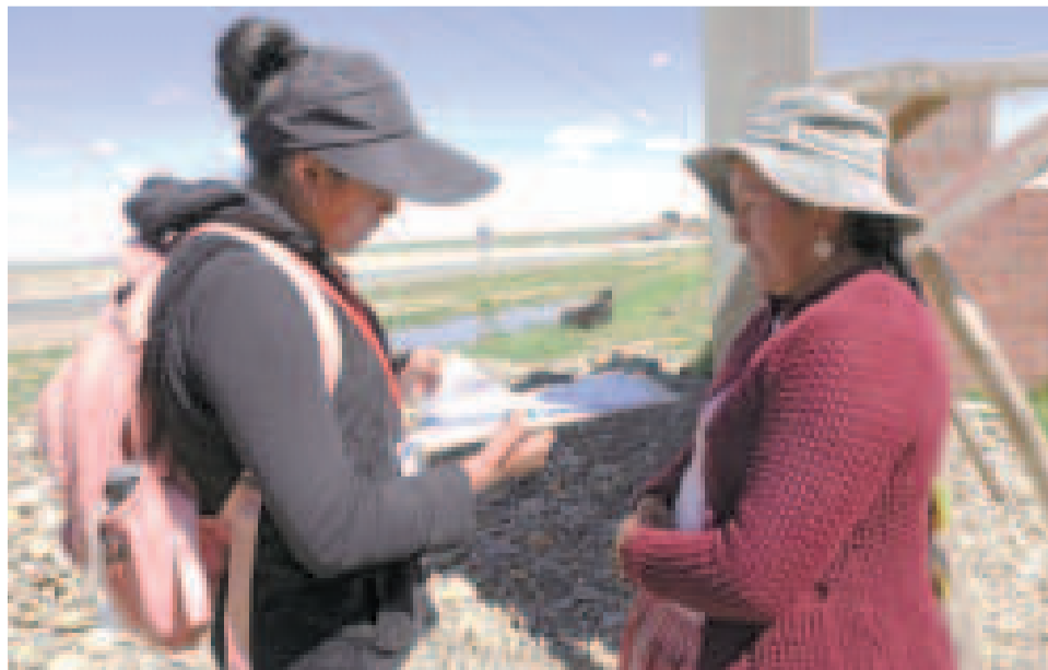
El proceso censal alcanzó los estándares internacionales de calidad y transparencia.

Al respecto, el ministro de Planificación del Desarrollo, Sergio Cusicanqui, agradeció a los equipos técnicos de estos organismos internacionales por contribuir en el desarrollo del censo.