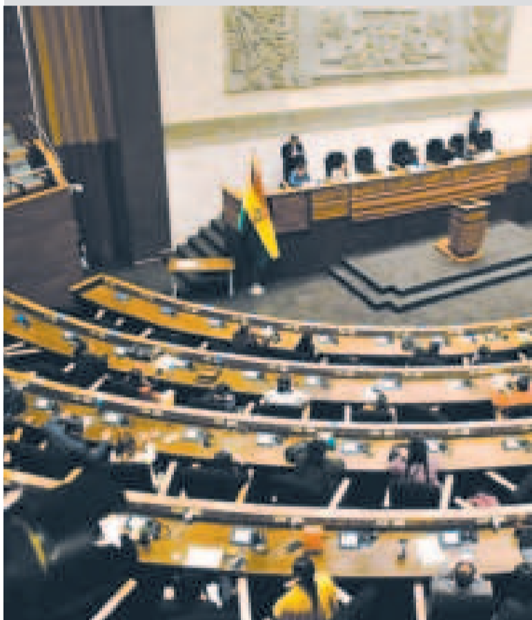
Una sesión en la Asamblea Legislativa.