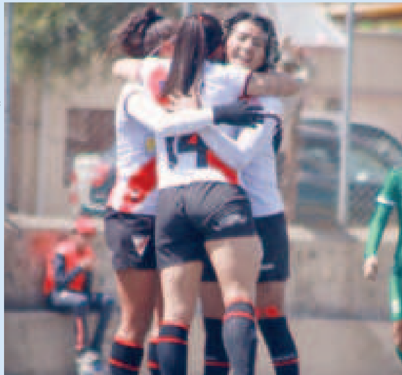
Las jugadoras del equipo de Always Ready festejan la victoria.