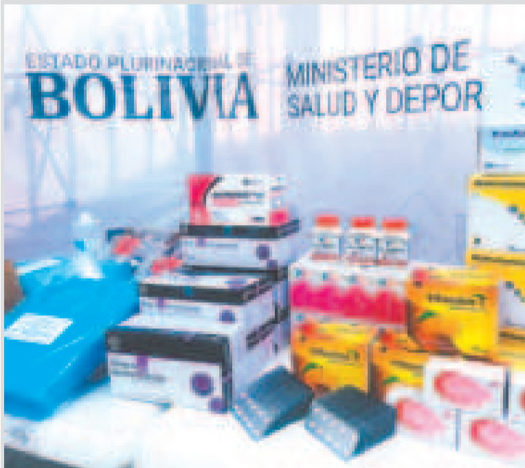
La producción de medicamentos en el país reducirá sus costos con la medida asumida.