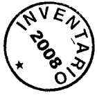
CUADRO N° 62