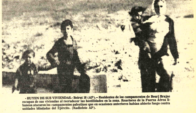
-HUYEN DE SUS VIVIENDAS.- Beirut 16 (AP).- Residentes de los campamentos de Bourj Brajneh escapan de sus viviendas al reducirse las hostilidades en la zona. Reactores de la Fuerza Aérea libanesa atacaron los campamentos palestinos que en ocasiones anteriores habían atraído fuego contra unidades blindadas del Ejército.

Artículo 1º.- Autorízase a los señores Ministros de Industria, Comercio y Turismo y de Defensa Nacional, convocar a empresas especializadas, mediante invitación, para la presentación de ofertas que tiendan a la implementación de la planta terminal de vehículos y de componentes que corresponden a la programación subregional, con respecto a la programación subregional, con respecto a la programación subregional. Artículo 2º.- Apruébase las bases y condiciones generales para presentación de ofertas y de adjudicación de propuestas. (Pasa la página 7.)