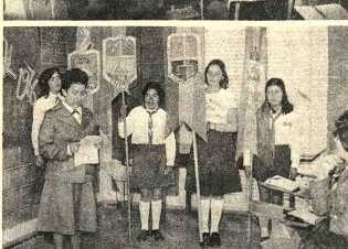
La Asociación de Guías Scouts de Bolivia inició ayer su VI Asamblea Nacional, en la que participan delegadas de todas las filiales de la entidad. El objetivo de la reunión es evaluar y programar las actividades que realiza la Asociación a nivel nacional. En la composición gráfica, aspectos del acto de inauguración y reuniones de trabajo que tienen lugar en el salón del Colegio Domingo Savio, en Calacoto.