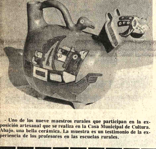
Uno de los nueve maestros rurales que participan en la exposición artesanal que se realiza en la Casa Municipal de Cultura. Abajo, una bella cerámica. La muestra es un testimonio de la experiencia de los profesores en las escuelas rurales.