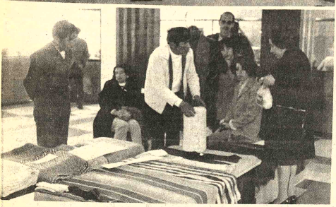
Desde el lunes pasado se exhiben en la Casa Municipal de Cultura "Franz Tamayo" cerámicas, tejidos y otros objetos artesanales. La muestra, realizada y organizada por maestros rurales del departamento de La Paz, ha despertado notorio interés.