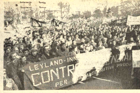
"HUELGA. Milan, 16 (AP) - Miles de trabajadores aparecen en la Plaza Leonardo da Vinci, de esta ciudad, durante la manifestación de protesta contra los bajos salarios. Los metalúrgicos iniciaron una huelga que duró cuatro horas en demanda de mejoras salariales.

Las revelaciones provocaron interés porque en los Estados Unidos desde los periódicos "Washington Post" y "New York Times" denunciaron que la Democracia Cristiana y el Partido Socialista, ambos miembros del gobierno que renunció la semana pasada, habían recibido bajo cuerda dinero de la CIA.