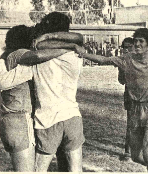
MAS ABRAZOS .- Otra vista de las celebraciones de los "anacarreros" después de su triunfo frente a los stronguistas en el "Lastra". Fueron merecedores al triunfo en base a trabajo mejor planificado, y fallas de los rivales.

WATERBURY, CONNETICUT, 11 (AP) .- Dos mujeres se enfrentaron en una exhibición de boxeo en esta ciudad, que fue calificada de "arid para atraer espectadores" y de "triste espectáculo" por dos mujeres en pugna sobre un cuadrilátero, pero añadió que no podía invocar regulación legal alguna para impedirlo. Por su parte, el propio promotor del programa de seis encuentros dijo que se trataba de un "arid" para atraer espectadores. La comisión estatal de boxeo Mary Heslin aprobó la pelea con la condición de que ambas "púgiles" llevaran sostenes de cuero para la protección de los senos. resultó visiblemente afectada por la exhibición de anoche. La Gobernadora del Estado, Ella Grasso, dijo el jueves que se oponía al "triste espectáculo" de dos mujeres en pugna sobre un cuadrilátero, pero añadió que no podía invocar regulación legal alguna para impedirlo.