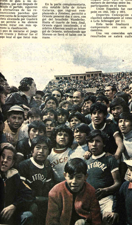
BANZER CON LOS INFANTES. El Presidente de la República General Hugo Banzer, rodeado de los pequeños futbolistas de Bolívar durante el campeonato infantil jugado el sábado en Tombadorani. Promesa de una mayor preocupación por el deporte de la niñez y la juventud a nivel de clubes y de gobernantes.

Los irritados espectadores prendieron fuego a las mallas de las porterías y causaron importantes daños en las instalaciones especialmente en las barreras de separación del terreno de juego. GUABIRÁ. Plantel de Guabirá que se convierte en candidato para obtener el título nacional de 1975, tras su triunfo de ayer frente a los "parinegros". Cumplió muy bien el plantel que se había propuesto, jugando de contrapé y llegando con gran finalidad. Justificada la victoria contra The Strongest.