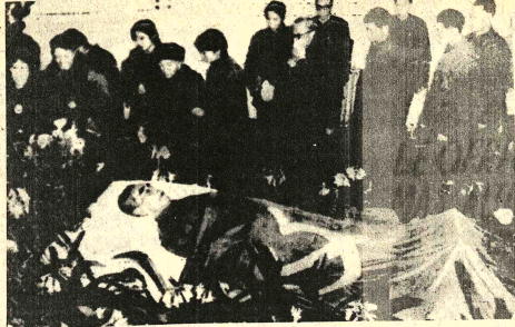
HOMENAJE POSTUMO.- Pekín 11 (AP).- Dolientes desfilan ante el féretro del Primer Ministro Chou En-Lai, envuelto en una bandera china antes de que fuera incinerado en el cementerio de Pao-pao-shan.

El más importante, del punto de vista numérico, es sin duda el sindical, encabezado por Lorenzo Miguel, jefe del gremio metalúrgico y titular de las llamadas "62 organizaciones", que controla la casi totalidad de los sindicatos del país. De tendencia preponderantemente derechista, el sector gremial se considera como la fuente del único poder genuino del peronismo. Han intentado últimamente avances para lograr el control del Ministerio del Interior, cargo de Ángel Robledo, un hábil jurista que orienta la fracción política rival.