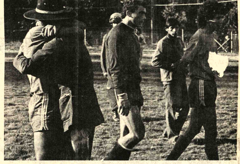
JUBILO DE GUABIRA.- Se abraza el técnico Coutinho con uno de sus jugadores, mientras los espectadores salen resignados del campo de juego. Galizaza personifica a la desazón de los gualdinos.