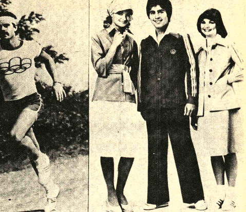
MONTREAL 1976.- Izquierda, los uniformes de los guías, (derecha) y hoteles (centro) de los Juegos Olímpicos de Montreal, así como también los uniformes de los delegados (centro), miembros de árbitros, jueces, médicos, y cuadros del Comité Organizador. Centro: los portadores de la llama