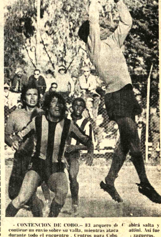
CONTINUACION DE COBRO.- El arquero de fútbol salta y continúa un envío sobre su valla, mientras se acerca el arquero de Cobro. Centros para Cobro y zagueros.