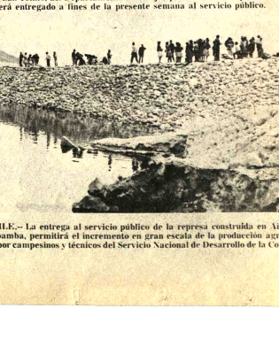
REPRESENTA EN AGUILA. La entrega al servicio público de la represa construida en Aguila, Departamento de Cochabamba, permitirá el incremento en gran escala de la producción agrícola. Esta obra fue construida por campesinos y técnicos del Servicio Nacional de Desarrollo de la Comunidad y que será entregada a fines de la presente semana al servicio público.

PARIS, 12 de (APP). La actriz norteamericana de origen hispano, Raquel Welch, se está realizando una nueva carrera en la pantalla pequeña y próximamente actuará en Televisión Española.