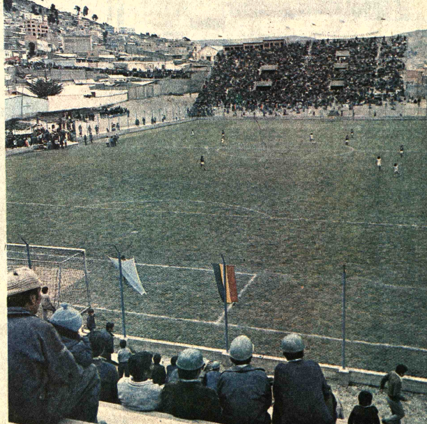
ESTADIO SIMON BOLIVAR. Esta fotografía fue tomada desde la tribuna sur del estadio de Bolívar. Al fondo se observa la tribuna norte que tiene una capacidad para 9.000 personas. La tribuna sur sería concluida dentro de un mes, con capacidad para 6.000 personas. Esta tribuna es metálica. La noche es de cemento.