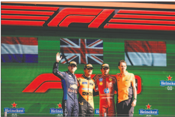
Los ganadores del Gran Premio de Países Bajos en la F1

rejo, y no desde el retrovisor, a Norris, que buscará acercarse todavía más en Monza.