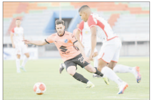
FC Universitario no encontró el camino para por lo menos igualar el partido