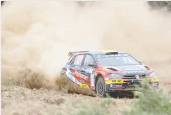
Los participantes demostraron sus habilidades a lo largo del trazado

La cuarta y penúltima fecha del Campeonato Sudamericano se correrá del 17 al 20 de octubre, con el Rally de Erechim, de Brasil.