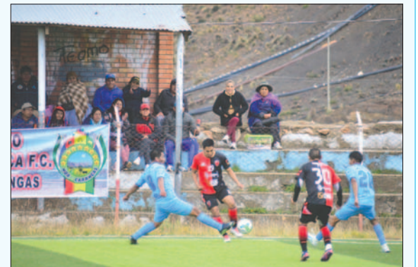
Planean iniciar el torneo provincial en septiembre