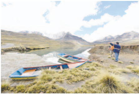
La contaminación inicia en la región de Milluni