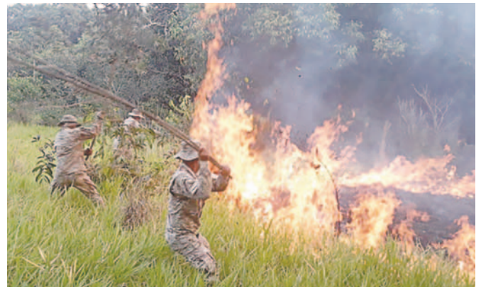
Actualmente hay 51 procesos por los incendios en el país /DEFENSA CIVIL

"Se llevó a cabo una audiencia sobre la situación jurídica de seis involucrados, tres de ellos serán detenidos preventivamente", informó Novillo en entrevista con Bolivia TV. A los otros aprehendidos se les ha puesto en libertad al no haber indicios suficientes.