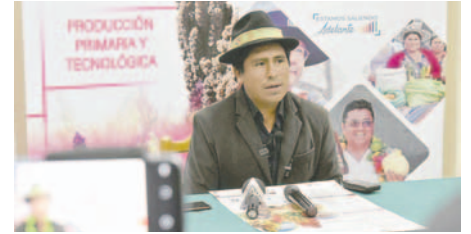
El viceministro de Desarrollo Agropecuario, Álvaro Mollinedo