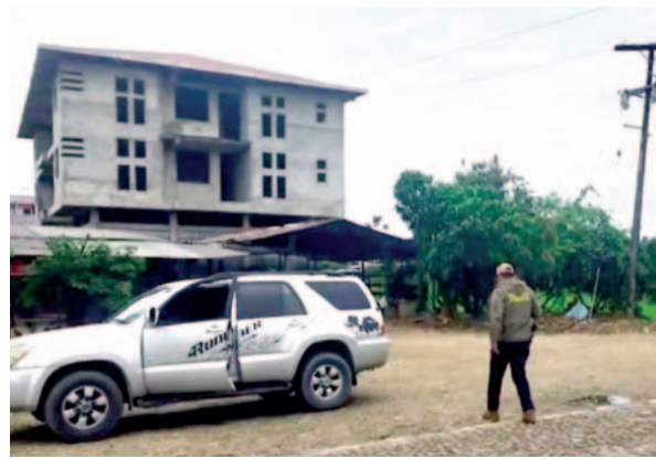
Un allanamiento en busca de miembros de una organización dedicada al secuestro en el Trópico