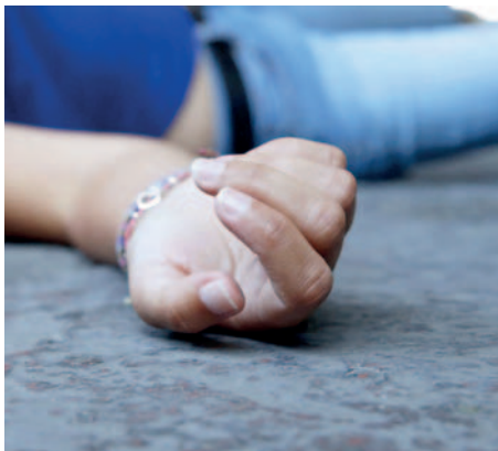
La víctima presentaba signos de agresión física y sexual /REFERENCIAL