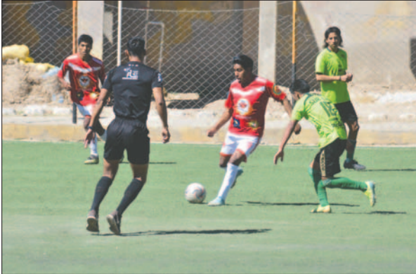
Rosario Central volvió a ceder terreno y se va quedando en la tabla