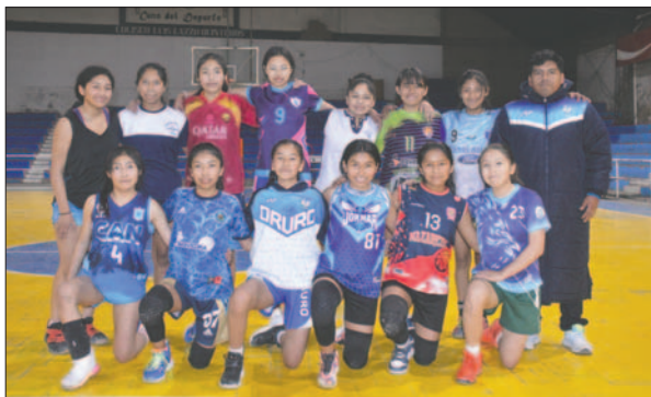
Las seleccionadas quieren marcar la diferencia en el certamen nacional