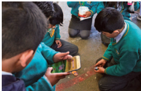
Varios niños buscan recompensas para los juegos en línea

Vargas, de Save the Children - Bolivia, en las capacitaciones preventivas realizadas a niños y adolescentes, ha escuchado testimonios de los menores que indican que fueron inducidos a hacer compras por vendedores de monedas virtuales usadas en juegos en línea, para lo cual facilitaron, a escondidas de sus padres, fotos con los códigos de las tarjetas bancarias y, como