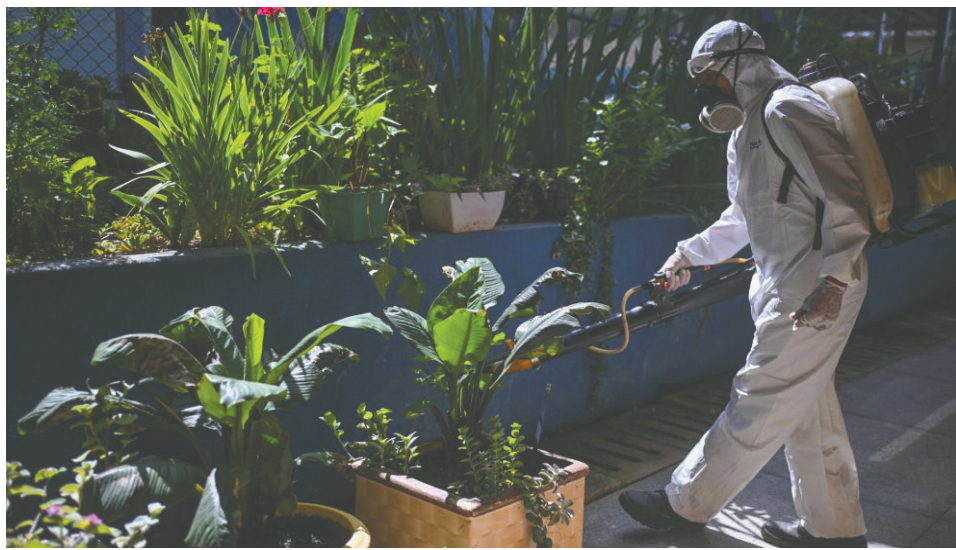
Brote de la enfermedad del oropouche causa preocupación en Brasil, Cuba y Colombia