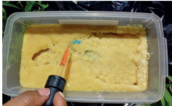
La droga en estado húmedo que fabricaban los narcotraficantes

diversos envases rectangulares de plástico, los cuales contenían cocaína en estado húmedo. La sustancia tuvo un peso total de 78 kilos con 80 gramos.