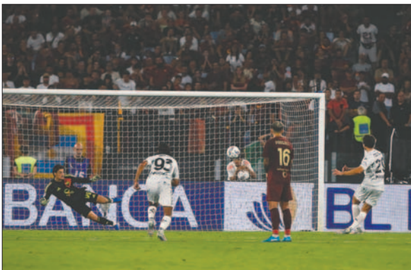
Empoli venció de visita a la Roma en un partido bastante complicado

Resultados fecha 2: Parma 2-1 Milan, Udinese 2-1 Lazio, Inter 2-0 Lecce, Moza 0-1 Genoa, Fiorentina 0-0 Venezia, Torino 2-1 Atalanta, Napoli 3-0 Bologna, Roma 1-2 Empoli; lunes: Cagliari-Como y Hellas Verona-Juventus.