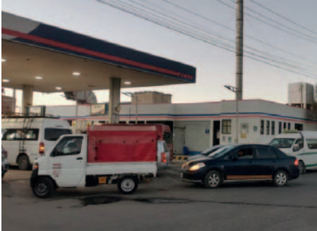
Tema de combustibles líquidos preocupa a dirigentes del Transporte en Oruro