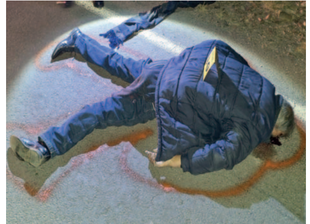
Tanto el hombre como la mujer, fueron expulsados hasta más de 20 metros por el impacto

El caso fue derivado a la Dirección Departamental de Tránsito, Transporte y Seguridad Vial de Oruro, cuya división de Accidentes se encarga de la investigación del caso.