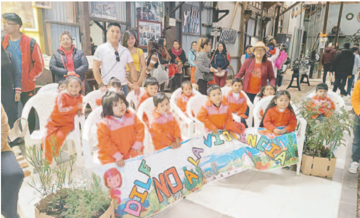
Los niños también formaron parte de la celebración por el aniversario del museo /

Este aniversario no solo ha servido para rendir homenaje al Museo Ferroviario de Machacamarca, sino también para consolidar su papel como un importante centro cultural y turístico, asegurando que su legado continúe vivo y relevante para las futuras generaciones.