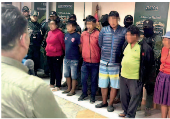
Personas implicadas en la organización criminal

Según el viceministro de Régimen Interior y Policía, Jhonny Aguilera, la organización delictiva dedicada al secuestro, extorsión y asesinato de personas estaba liderada por