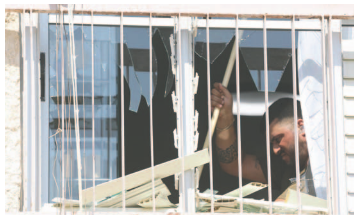
Casas dañadas por el lanzamiento de cohetes desde el Líbano en la ciudad nortea de Acre, Israel, el 25 de agosto de 2024. Hezbolá afirmó que había disparado más de 300 misiles y drones contra Israel.

Hizbulá lanzó el domingo cientos de cohetes y drones contra el Norte de Israel como primera respuesta al asesinato de su máximo comandante militar, Fuad Shukr, alcanzado por un bombardeo israelí contra un edificio en los suburbios de Beirut el pasado 30 de julio.