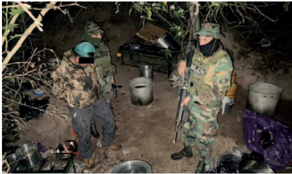
El implicado capturado durante el operativo

en medio del monte una carpa, pero los narcotraficantes, al percibir la presencia policial, huyeron; sin embargo, uno de ellos fue alcanzado cuando estaba cerca del establecimiento donde elaboraba la droga.