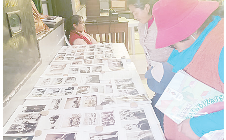
Los visitantes pudieron aprender sobre el Museo Ferroviario