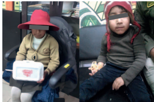
Niños encontrados en los últimos días /DIO

Por ello, el personal de la DIO activó la búsqueda de sus familiares a través de los números de celular 65411242 y 68299093. Hasta el cierre de esta edición, no se ha informado sobre la aparición de los padres o familiares.