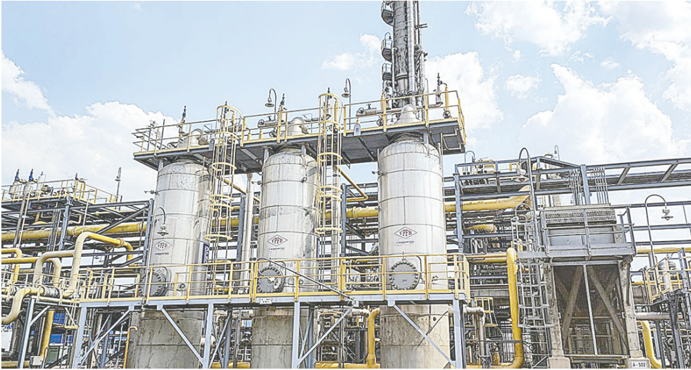
Planta de gas de Yacimientos Petrolíferos Fiscales Bolivianos /YPFB