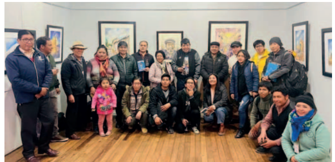
Varias personas participaron de la inauguración de la exposición

“La temática que hemos elegido ha sido prácticamente libre, pero hemos querido mostrar en mi caso paisajes orureños, obras del Sajama, Sepulturas y paisajes urbanos como la Torre de la Catedral. Cada uno trajo su esencia para mostrar lo que nos gusta y además aprovechamos el blanco del papel”,