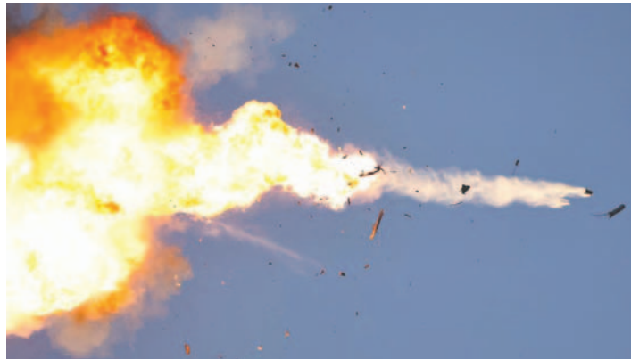
Israel llevó a cabo un intenso bombardeo en el Sur de Líbano como medida preventiva contra Hizbulá

cional Ben Gurion reanudó su actividad a las 7:00 horas locales, tras haber permanecido cerrado una hora y media mientras Israel llevaba a cabo su ataque en "defensa propia en tiempo real", que comenzó alrededor de las 5:00 horas locales.