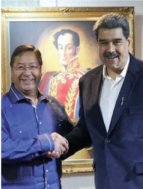
El Presidente boliviano, Luis Arce, y el mandatario venezolano, Nicolás Maduro