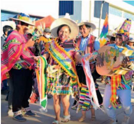
La alegría de la gente en la Feria Nacional de Camélidos