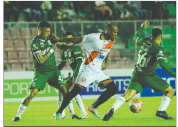
El partido se jugó con mucha intensidad, al final terminaron empatados

NACIONAL POTOSÍ (2): 1) Saidt Mustafá, 23) Óscar Baldomar, 4) Eduardo Álvarez, 6) Edisson Res-