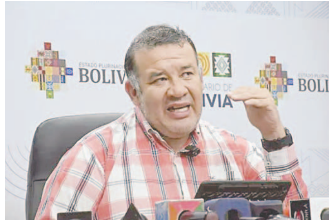
El director ejecutivo del INE, Humberto Arandia

El INE informó que los resultados sobre población a nivel municipal se conocerán hasta finales del mes actual y los datos poblacionales a nivel de circunscripción estarán disponibles en diciembre. En abril de 2025 se divulgarán los resultados totales sobre las características de población y vivienda.