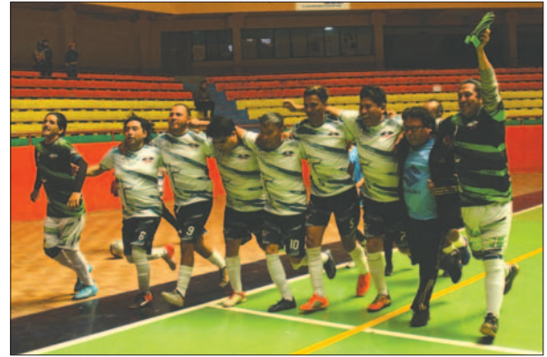
Deportivo Lora gallardo campeón del nacional de fútbol de salón AMF