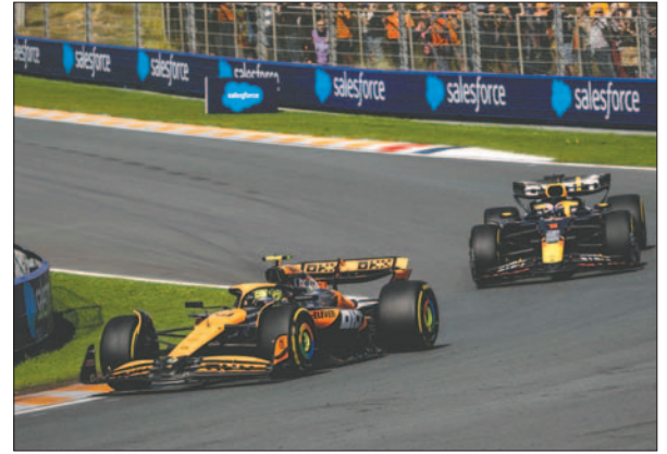
El británico Lando Norris (McLaren) ganador del GP de Países Bajos de F1

Así, Norris sigue intentando avivar un Mundial de pilotos que hace apenas unos meses parecía claro para Verstappen, que, sin embargo, lleva ya demasiados grandes