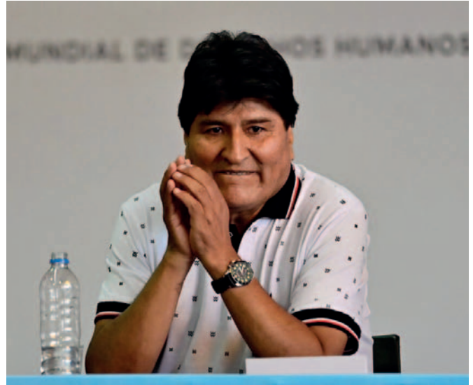
El exmandatario ya tuvo problemas al tratar de llegar a Soracachi

La comunidad orureña también expresó su descontento con Morales por los conflictos generados con So-