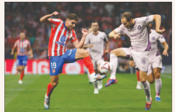
El delantero Julián Álvarez y el defensa Daley Blind disputan el balón

Resultados fecha 2: Celta de Vigo 3-1 Valencia CF, Sevilla 1-2 Villarreal, Osasuna 1-0 Mallorca, Barcelona 2-1 Athletic, Espanyol 0-1 Real Sociedad, Getafe 0-0 Rayo Vallecano, Real Madrid 3-0 Valladolid, Legasés 2-1 Las Palmas, Alavés 0-0 Betis, Atlético de Madrid 3-0 Girona.