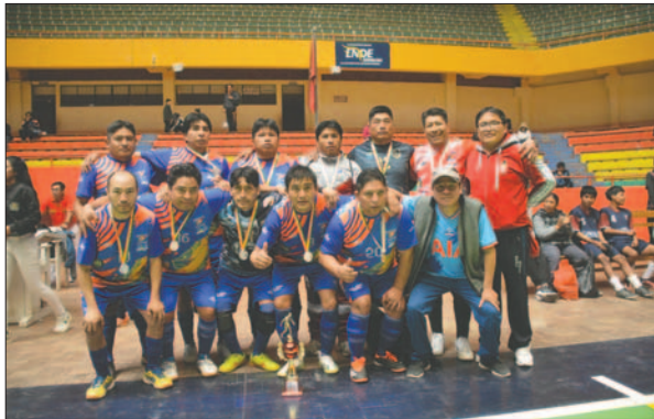
Mágicos se quedó con el segundo lugar del torneo nacional