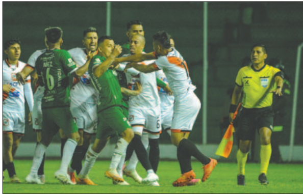
Después del gol del empate, se registraron algunos inconvenientes