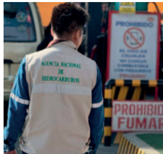
ANH ha implementado un nuevo sistema de monitoreo estricto y mensajes de alerta

El nuevo sistema de control también involucra a la Aduana Nacional y a funcionarios de Hidrocarburos,