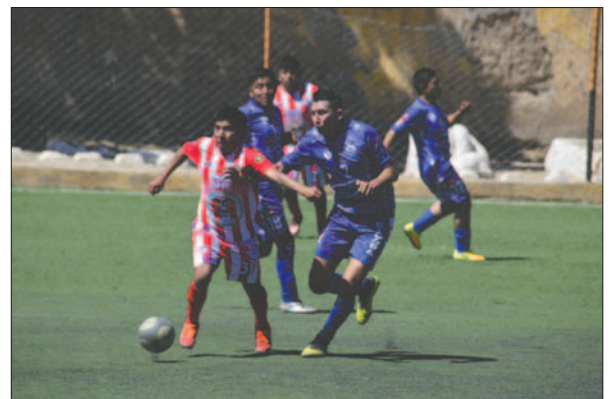
Sin vencedores, ni vencidos concluyó el cotejo entre Corque FC y Deportivo Escara