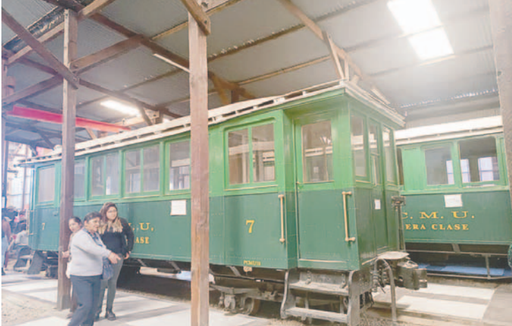
Piezas invaluables de la historia ferroviaria se exponen en Machacamarca