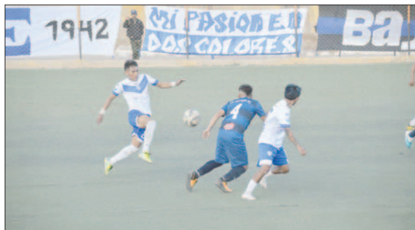
El cuadro de la "V" azulada va mejorando en su rendimiento

En otro de los partidos, Deportivo Pomata obtuvo una buena victoria contra JCDT, ganando por 6 goles a 1. El incidente negativo del partido ocurrió en el encuentro entre VHSR y el equipo de Húngaros FC, ya que el partido tuvo que ser suspendido en el minuto 60 debido a la intromisión del presidente de la AFO, Walter Humacayo, quien proviene de los registros de VHSR como dirigente. Sus protestas airadas provocaron que fuera expulsado del campo de juego y, al negarse a retirarse, el árbitro suspendió el partido.