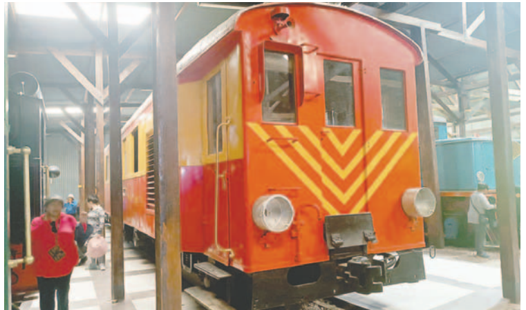
Los visitantes pueden ver de cerca los vagones y locomotoras en el Museo de Machacamarca