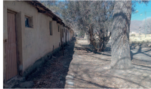
Las calles del pueblo son escenario de varias historias

Uno de los cuentos más populares fue el misterioso tren fantasma que causó terror y tragedia entre las décadas de 1960 y 1980. Según relatos locales, este tren atropellaba a personas y se movía sin conductor, obligando a las autoridades a encadenarlo para evitar más accidentes.