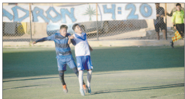
La Cantera dio una dura batalla a lo largo del encuentro pero no pudo concretar