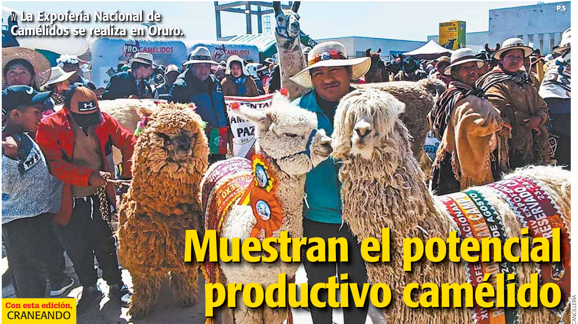
La Expoferia Nacional de Camélidos se realiza en Oruro.