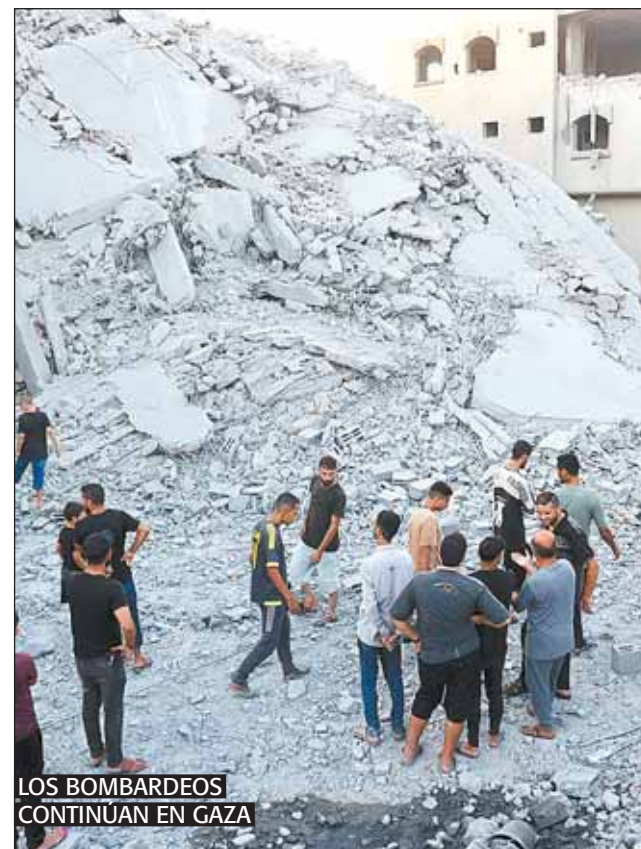
LOS BOMBARDEOS CONTINUAN EN GAZA

Gaza y Egipto. El alto cargo de Hamás indicó que el grupo insistirá en la necesidad de sacar a todas las tropas israelíes de Gaza, territorio que gobierna desde 2007, incluido “de la zona fronteriza con Egipto”, conocida como “corredor Filadelfia”. El movimiento islamista, catalogado como “terrorista” por Israel, Estados Unidos y la Unión Europea, rechaza nuevas negociaciones.