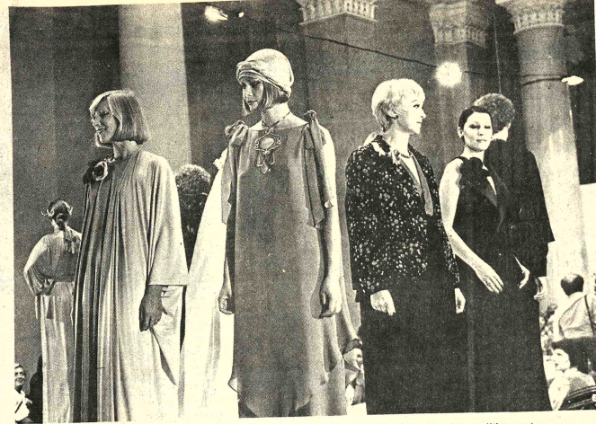
MODA POLACA PARA OTOSÑO-INVIERNO. Los modelos de la foto son algunos de los que últimamente exhibió la casa "Moda Polska" de Palma, para las estaciones de Otoño e Invierno. La femineidad y funcionalidad son las características principales de las colecciones de esa casa, que es la mayor en su género en el país.