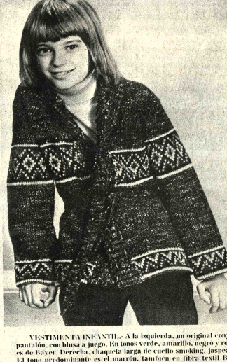
VESTIMENTA INFANTIL. A la izquierda, un original conjunto de casaca de manga corta y pantalón, con blusa a juego. En tonos verde, amarillo, negro y rojo. El traje es verde, el tejido es de Bayer. Derecha, chaqueta larga de cuello smoking, jaspada y con abalorios, estilo jacquard. El tono predominante es el marrón, también en fibra textil Bayer.