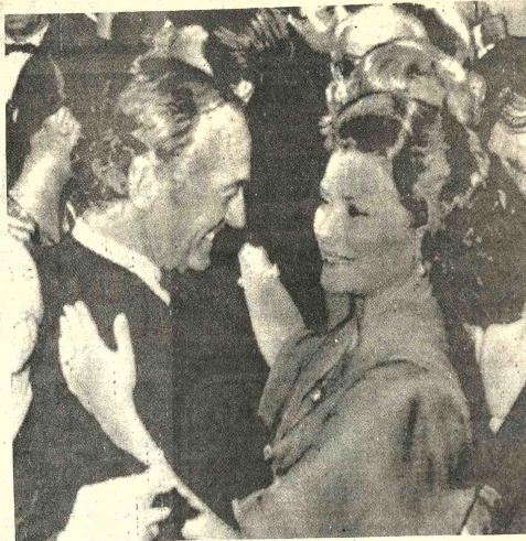
BAILIE DE LA ROSA.- Park 20 (AP).- El actor británico David Niven, baila con la Princesa Grace de Mónaco en el "Baile de la Rosa" realizado anoche en Mónaco.

Debido a los cambios bruscos de temperatura en la región, se viene registrando una fuerte epidemia gripal, con ausencia temporal de niños de ambos sexos en los establecimientos de educación básica. Si el problema subsiste la ausencia será mayor, opinaron las autoridades educativas de Mairana.