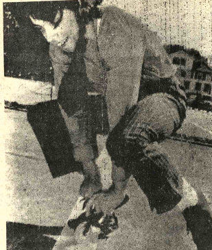
CINCA - St. Gallen, Suiza 20 (AP). Un artista local viaja aquí en lo que se dice será la bicicleta más pequeña del mundo. Ideal para viajes cortos, tiene manubrio, pedales y asiento de cuero.

La provincia de Córdoba, la principal de la zona centro, será gobernada por otro general retirado, Carlos Chassagny. Santa Fe, tiene a un marino retirado como gobernador, el vicealmirante Jorge A. Desimone. El único oficial superior del ejército en actividad nombrado para gobernar una provincia es el general de brigada Antonio Bussi, designado en Tucumán. Se trata de un distrito donde los militares libran recia lucha de una guerrilla rural ultra peronista, a la que han inflingido muy serias bajas.