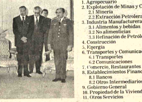
SALUD. El Cuerpo Diplomático acreditado ante el gobierno se hizo presente en la sede del Ministerio de Relaciones Exteriores para presentar su saludo al nuevo Canciller, Gral. Oscar Adriado.