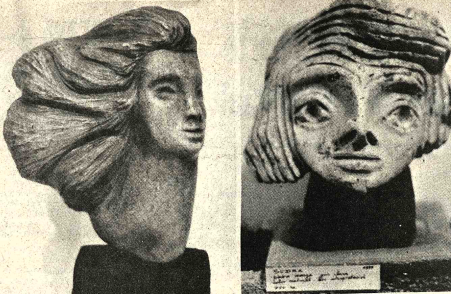
EN CULTURAS DE WALTER DE BOCK. En el Museo Nacional de Arte fue abierta ayer la exposición del esculturas del artista hable de Bock. Cincuenta piezas integran esta novedosa muestra que podrá ser visitada hasta el 30 del mes en curso.

La Policía Boliviana en ocasión de celebrar el Sesquicentenario de su fundación, convoca a un concurso literario, y de acuerdo a las siguientes bases: 1) El certamen está abierto a escritores nacionales; los trabajos serán escritos en verso o en prosa. 2) El tema: La Policía Boliviana. 3) Los trabajos en verso tendrán un máximo de 14 y en prosa, un máximo de 10 cuartetos o estrofas. 4) El plazo para la entrega de los trabajos es el 31 de mayo; deberá ser entregado en la Escuela Superior de Policías, Av. Iturralde N.º 1122 escritas a máquina, en doble espacio y firmados conseudónimo. 5) El primer premio, $b. 10.000 y medalla de plata. 6) El segundo premio, $b. 5.000 y medalla de plata. 7) El tercer premio, $b. 2.000 y Diploma de Honor. 8) El jurado estará integrado por intelectuales de reconocido prestigio.