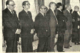
SALUD. El Cuerpo Diplomático acreditado ante el gobierno se hizo presente en la sede del Ministerio de Relaciones Exteriores para presentar su saludo al nuevo Canciller, Gral. Oscar Adriado.