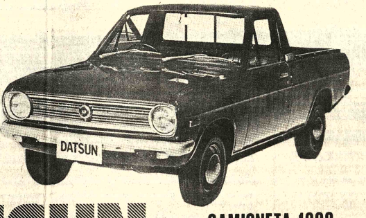
DATSUM CAMIONETA 1200 Maniobrabilidad perfecta Carrocería toda de acero