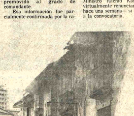
INCENDIO. Un incendio de proporciones destruyó una antigua casa ubicada en la esquina de las calles México y Colombia. El fuego se inició en una tina y se propagó rápidamente al resto de la casa...