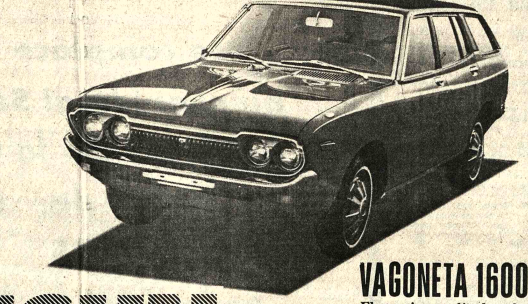
DATSUM VAGONETA 1600 Elegancia, amplitud en el interior y espacio suficiente para todo lo que se quiera llevar. 5puertas