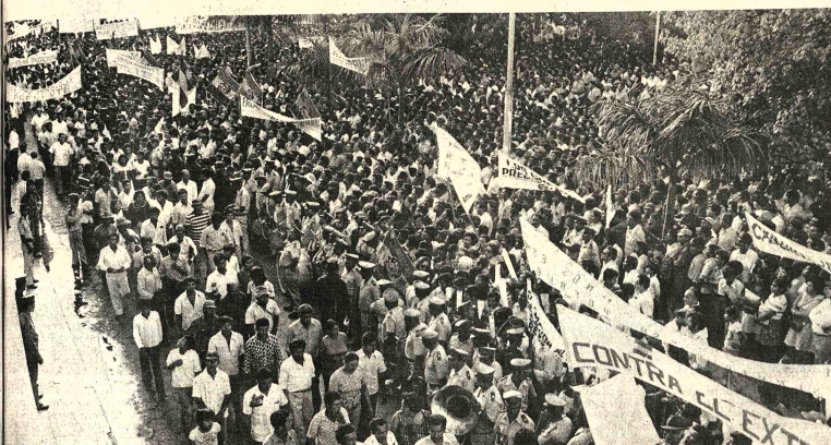
APOYO AL GOBIERNO. El pueblo cruceño manifestó ayer su respaldo al Gobierno que preside el Gral. Hugo Banzer. El acto cívico, denominado de "renovación de fe en el nacionalismo cristiano", congregó también a campesinos de áreas próximas a la ciudad.