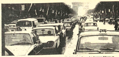
HUELGA. - Paris (AP). - Largueas filas de vehiculos congestionan los Campos Eliseos en Paris, debido a que usuarios del subterráneo los utilizaron para ir a trabajar ante una huelga de trabajadores del metro

Juzgando a la URSS a través de lo que veía en las calles de El Cairo o Alejandría,