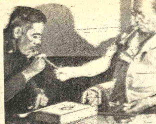
VISITA. Panamá (AP). - El Presidente de Yugoslavia, Tito, encabeza un habano al jefe del gobierno panameño, Omar Torrijos, durante una visita que realizó aquí a la ciudad de Panamá.

cionado como posible sucesor de Arias. Fuentes políticas de derecha e izquierda han dicho que sin Fraga, el régimen se volvería hacia la derecha. Los diarios y los dirigentes políticos han mencionado abiertamente en los últimos días la posibilidad de cambios en el gabinete y la posible destitución de Fraga debido a la ola de huelgas, el saldo de siete muertos en choques callejeros y la deriva económica del gobierno desde que asumió el poder tras la muerte el 20 de noviembre del General Francisco Franco.