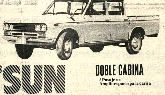
DATSUM DOBLE CABINA 5 Pasajeros Amplio espacio para carga