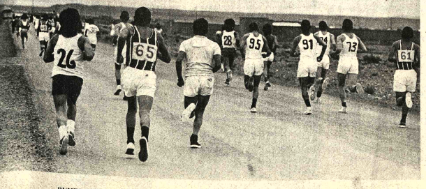
RUMBO AVIACHA.- Una vista del lote de participantes, ya bastante disperso, que se encamina a Viacha para cumplir la media maratón que hizo cumplir la Asociación Atlética de La Paz con éxito, hoy fueron los participantes.