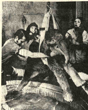
BANO, Portland, Oregón. Una pequeña elefanta nacida recientemente en el zoológico de Portland, es sometida a su baño diario.

Una pregunta en torno al gobierno de los Estados Unidos. Torrijos manifestó: "Cuando los poderosos se disparan como pasa ahora mismo, nosotros los chiquitos tenemos que hacer como el soldado de infantería que cuando dispara tira el pecho a tierra".