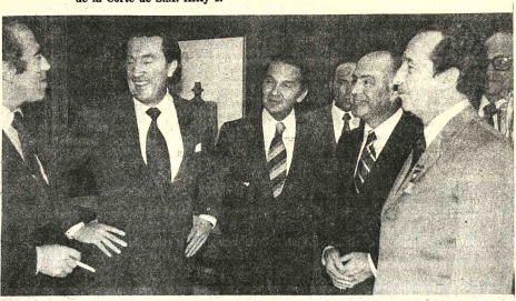
- Un aspecto de la recepción que ofreció el directorio del Banco Nacional de Bolivia con motivo de la inauguración de su nuevo edificio, situado en la Av. Camacho, esquina Colón.