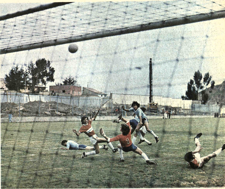
REMATE DESVIADO.- Una incidencia frente a la valla de Olympic, con varios jugadores en el suelo, y Aragón rematando fuera del campo, cuando el arquero Rufini tenía escasa chance para contener. En el segundo tiempo, Bolívar atacó más y tuvo varias ocasiones de gol que no se concretaron.

Creemos que problemas mayores no tendrá en la parte netamente defensiva, porque ese bloque se ha estructurado con cierta solidez. Lo que tendrá que atender debidamente es el medio campo, y la penetración ofensiva. Si el juego de medio campo logra estabilizarse en base a un trabajo más constante y con líneas de fútbol más definidas, podría ser que Bolívar sólo precise el aporte de uno, o dos hombres-gol para definir sus partidos en la Copa. Pero la base es el trabajo del medio campo, donde por el momento no se ha logrado un equilibrio que pueda garantizar el normal desempeño para todo el plantel. Poco más es lo que puede decirse cuando estamos sobre el mismo comienzo de la Copa Libertadores y habrá que suplir con voluntad todo lo que técnicamente pueda faltar. Jugadores en función individual no faltan, lo que está haciendo falta es mayor acople para concretar la función de conjunto y tal vez si en la Copa eso pueda llegar. Lo de ayer fue un simple cierre de preparación con un triunfo cómodo por 2 a 0, y que de paso puede servir para que el equipo comience su actuación en la Copa con una base anímica muy buena. De Olympic habrá que decir que se desmoronó de acuerdo a sus posibilidades, y que cuando toda la gente que recientemente contrató se incorporó, puede armar un buen equipo para el campeonato local.