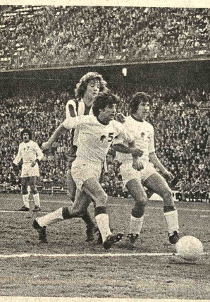
TRUÑO DEL ATLETICO. Una entrada de los delanteros del Atlético de Madrid, es frenada por el arquero Puente, del Granada, durante el cotejo que ganaron los madrileños en la última fecha del torneo español, el domingo.

VIAJE A SANTA CRUZ El viaje a la capital oriental para su primer cotejo frente a Guabirá, tendrá lugar en el último vuelo del sábado 13, y se alojará en el hotel Cortez, más conocido como "Pozza del Bato". El retorno se producirá el lunes 15 en el vuelo regular de las 6 horas.