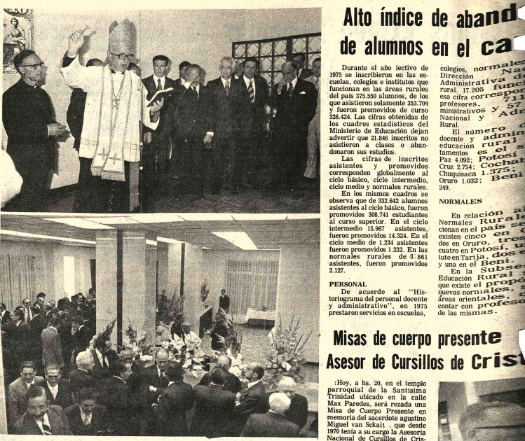
EDIFICIO DEL BANCO NACIONAL. El Banco Nacional de Bolivia, inauguró ayer su nuevo edificio que está ubicado en la Av. Camacho esquina Colón. En la oportunidad, el Cardenal-Evangelista Maurer, bendijo el local, señalando que "el nuevo edificio tiene mucho que ver y mucho que hacer en Sucre que es sede de la institución y pide a Dios que progrese más y más para bien de todos los fundidos que la historia de la institución está ligada a la historia misma de Bolivia y que no solamente colaboró al país en momentos difíciles emergidos de dos guerras internacionales, sino que también constituye uno de los pilares fundamentales de su desarrollo. Hizo una reseña histórica del banco señalando que fue fundado en 1871 con capitales bolivianos y chilenos y agencias en Copiá, Iquique, Valparaíso y en Valparaíso, Chile. Fue fundador del Banco Mariano Peró y su primer presidente que fue el Sr. Gregorio Pacheco.

En pocos días más se inaugurará en Telamaya la planta de refinación de bismuto que permitirá la producción de metal con una pureza del 99.97 por ciento de ley; es decir en mejores condiciones que los demás productores de bismuto.