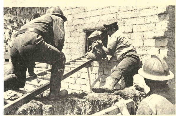
-MAZAMORRA EN TEMBLADERAN.- Efectivos del Cuerpo de Bomberos rescatan a un niño que quedó dentro de una vivienda que fue afectada por la mazamorra que ayer se desmoronó por Tembladeran. La masacre y piedras cayeron una extensa zona, malogrando numerosas viviendas (Información en páginas centrales).