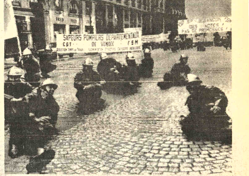
-PROTESTA.- París 4 (AP).— Bomberos llevan a cabo un paro pacífico en París, en protesta por los bajos salarios que les pagan por sus funciones en favor de la sociedad. Algunos miembros del batallón de bomberos resolvieron sentarse en una calle céntrica de esta ciudad.

Con la designación de representantes de Ecuador, Perú y Venezuela como miembros de la Junta del Acuerdo de Cartagena, se declaró en el cuarto intermedio para permitir que los delegados realicen las consultas pertinentes con sus gobiernos, se definió el apoyo de los seis países para el candidato boliviano a la Presidencia de la CAEP. También se habría decidido que Chile ocupe la Vicepresidencia de este organismo y la Secretaría General de la Junta del Acuerdo de Cartagena.