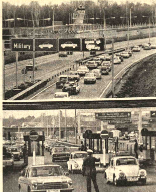
CONVENIO CUATRIPARTITO SOBRE BERLIN. El convenio cuatripartito que se firmó hace cuatro años, ha motivado notables mejoras también en el tráfico de viajeros desde y hacia Berlín (Alemania). En el tránsito sobre Berlín y la República Federal no existen ya categorías de personas a las que quedaba denegado el paso. Se agilizaron los trámites de despacho y la concesión de visas se efectúan a pie del automóvil o en el tren, con todas las facilidades que se logró un notable aumento en el tránsito por carretera. En la fotografía, dos escenas, en el punto de control de Drildren.

"conexión francesa" del tráfico de drogas, en ese entonces muy vigilada por los yanquis, envió a uno de sus jefes al Paraguay para dirigir desde aquí la introducción de estupefacientes, principalmente heroína y heroína, en el lucrativo mercado del país del norte. Según todos los indicios, este tráfico se realizaba bajo la paternal vigilancia y participación en los beneficios de altos personajes locales. Pero una de las condiciones era que en ningún caso las drogas debían ser consumidas en el país. El actual auge del consumo parece no haber superado, hasta ahora, la faceta del consumo de marihuana, que típicamente no produce los efectos devastadores de los derivados del opio. Sin embargo, la existencia de una demanda que los adictos tienden a buscar drogas cada vez más fuertes, y de hecho, aunque la policía mantiene reserva sobre los informes, parecen haberse dado ya casos aislados en este sentido, en que la droga proviene del circuito arriba señalado. Aunque el centro de distribución de la droga hacia el mercado yanqui se habría trasladado al Caribe, y aun cuando el jefe local de la conexión francesa, Ricard, ha sido extraditado a pedido del gobierno de Washington, este país continúa, según todos los indicios, ocupando un lugar preponderante en el tráfico destinado a los países limítrofes, principalmente Brasil y Argentina.