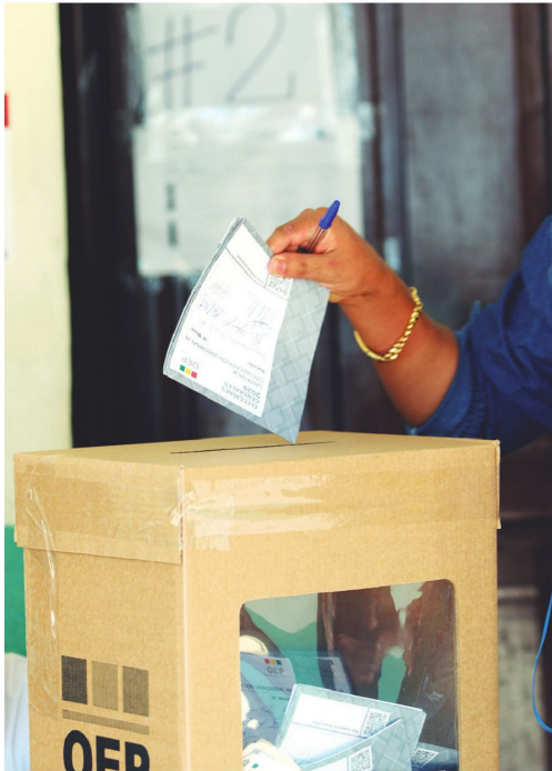
Un ánfora electoral guarda los votos de la ciudadanía.

El exgobernador de La Paz y líder del MTS, Félix Patzi con 57 años también está en una intensa carrera electoral sellando pactos con políticos emergentes.