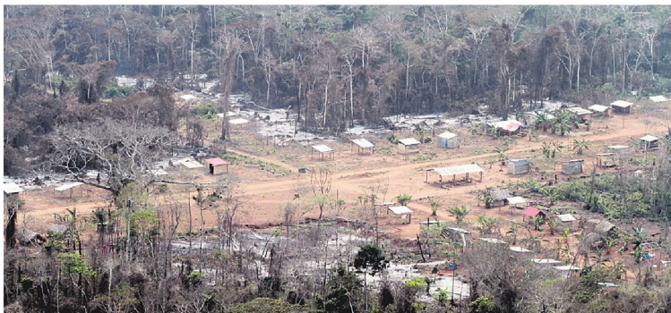
Este es uno de los asentamientos que tiene al menos 15 edificaciones entre árboles quemados

Desolador. Ese es el panorama que se ve del área de manejo forestal Vasber, también conocida como Área Transitoria Especial (ATE), desde el aire. La misma se encuentra ubicada en el municipio Urubichá provincia Guarayos del departamento de Santa Cruz. El 50% de este terreno, que tiene una superficie de 51.929 hectáreas, está afectado por los avasallamientos e incendios forestales, según verificó un equipo de EL DEBER, tras un sobrevuelo realizado el fin de semana sobre esa extensa zona.