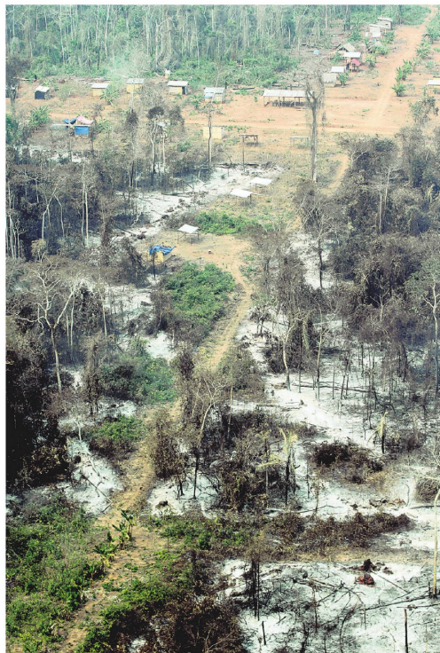
El manto blanco de cenizas es evidente alrededor del asentamiento.

Los avasalladores han levantado carpas y viviendas en la zona.