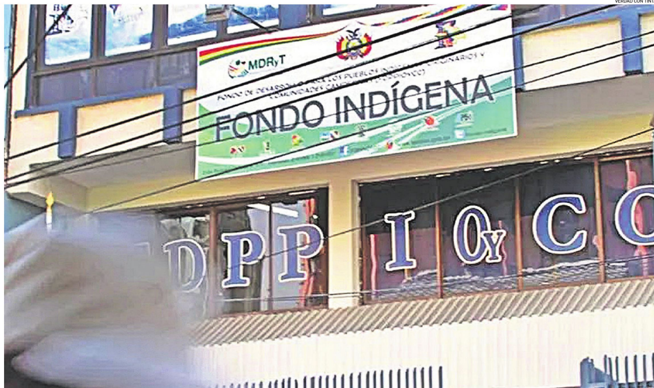
Esta es la sede del Fondo Indígena en La Paz desde donde se autorizan los proyectos de desarrollo que, en teoría deberían beneficiar a las poblaciones indígenas del país.

UNA INVESTIGACIÓN DE LA VERDAD CON TINTA Y CONNECTAS