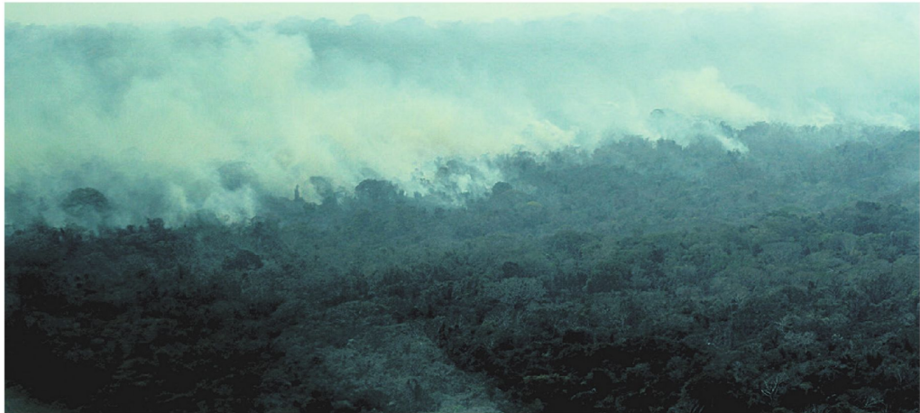
Estas son las cortinas de humo provocadas por el fuego en este bosque ubicado en la provincia Guarayos de la región cruceña.

En una entrevista con EL DEBER Radio, el ministro de Defensa, Edmundo Novillo, respondió que una de las causas principales, sobre una supuesta intención de modificar el PLUS cruceño con los incendios, es que en la propiedad privada, campesina, intercultural