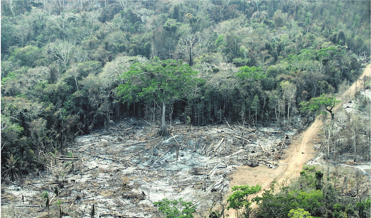
El daño es evidente, árboles quemados y las cenizas son una muestra de las quemadas de estos bosques en el municipio de Urubichá del departamento de Santa Cruz

HAY TIERRA AVASALLADA Y PRECARIAS CONSTRUCCIONES