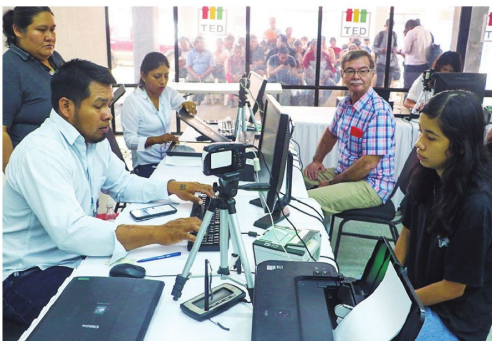
En Santa Cruz y en todo el país, el empadronamiento será hasta el 30.

Esa fecha abrirá otro ciclo electoral para cambiar autoridades de los órganos Ejecutivo y Legislativo. Se prevé que la elección será en agosto de 2025.