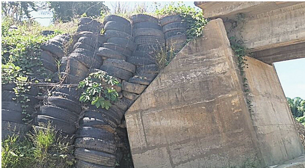
Así quedó un puente en Yapacaní, Santa Cruz. La obra fue concebida para beneficiar a los pueblos indígenas, pero hubo corrupción.

Pero este uso político de los recursos del Fondo no es nuevo. En la primera década de implementación del programa, según el informe de fiscalización sobre el Fondo Indígena realizado en 2016