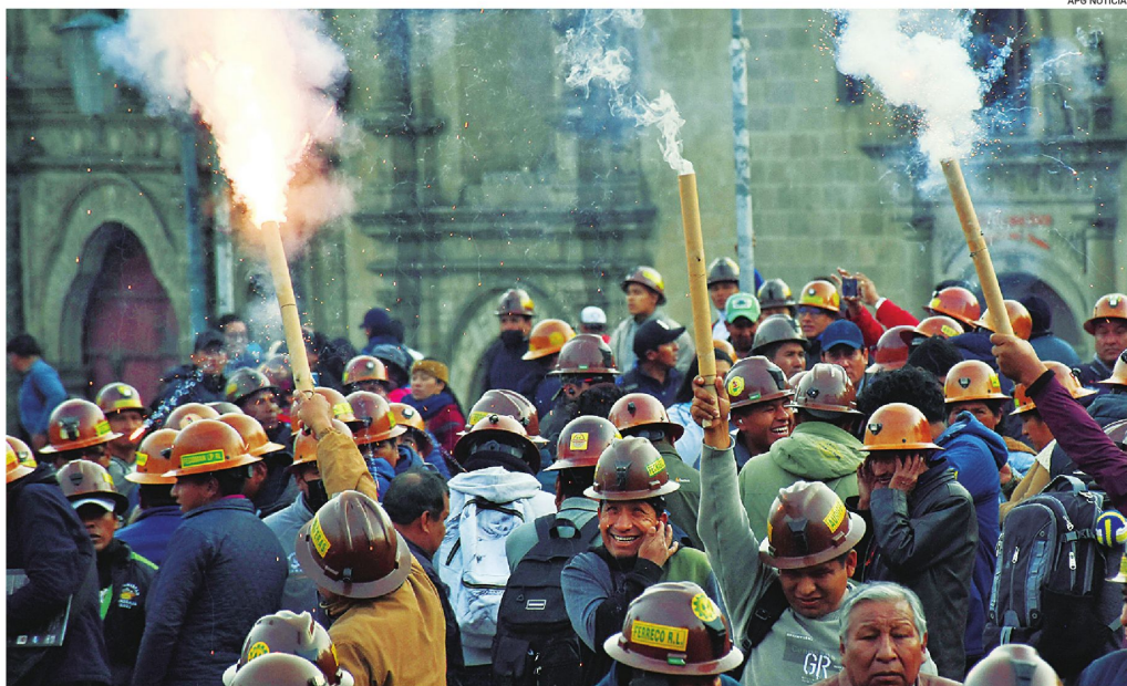
Una de las últimas medidas del sector minero en la cual demandaban la legalización de la llamada minería ilegal y más áreas de explotación.

Hace unos días, el Gobierno nacional propuso a las gobernaciones y alcaldías una ley que establezca la conformación de un