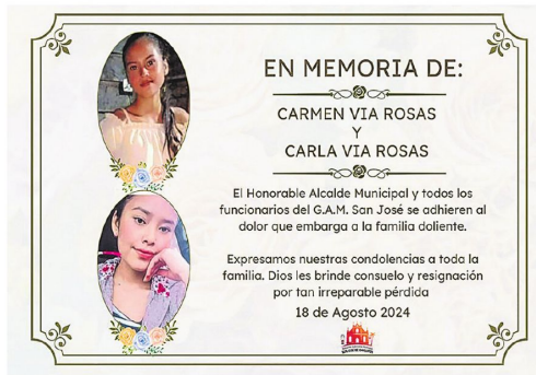
El necrológico de la Alcaldía por las jovencitas

Sus compañeros del cuarto de secundaria no tuvieron clases ese lunes triste, se fueron al entierro, y verlas en ese último adiós era algo que no podían digerir. Es más, pidieron al director que los cambie