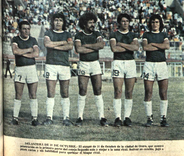
DELANTERA DE 31 DE OCTUBRE. El ataque de 31 de Octubre de la ciudad de Oruro, que mostró penetración en la primera parte del cotejo llegando más y mejor a la zona rival. Bolívar, en cambio, jugó a pasé cortos y sin habilidad para quebrar el bloque rival.

SANTA CRUZ, 16 (PRESENCIA).- Solemnemente fueron clausurados los Primeros Juegos de la Juventud, que patrocinó la Secretaría de Deportes de la Presidencia de la República.