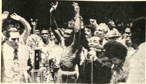
- PAMBELÉ Y SU TRIUNFO. — Antonio Cervantes, más conocido por Pambelé, aparece levantando los brazos en señal de victoria, después de ser proclamado vencedor frente a Héctor Thompson de Australia, en un combate realizado en Ciudad de Panamá.