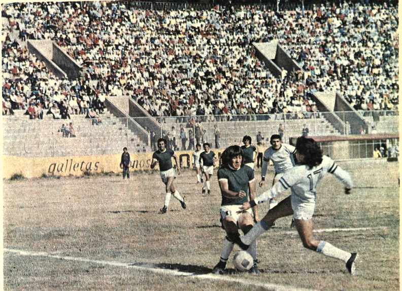
ATAQUE CELESTE.- Mezza rematando uno de los avances bolivarianos frente a la valla de 31 de Octubre, ante la oposición de un defensor orureño. 31 de Octubre se confía exageradamente en su ventaja, y se descontroló permitiendo el empate del rival, en los últimos cuatro minutos del encuentro.