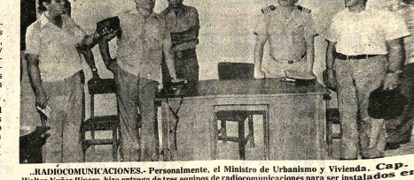
RADIOCOMUNICACIONES. Personalmente, el Ministro de Urbanismo y Vivienda, Cap. Walter Nuñez Rivera, hizo entrega de tres equipos de radiocomunicaciones para ser instalados en las provincias benaños.

SUCRE, 23 (PRESENCIA). La Consultora Prudencia Carlos Asociados inició los estudios para elaborar el plan vial departamental de Chuquisaca, que establecerá la prioridad que deben ejecutarse los diferentes proyectos de infraestructura vial. El Plan Maestro Vial establecerá además los costos de la construcción o mejoramiento de las rutas, dato que permitirá al financiamiento para su ejecución inmediata. Se asigna fundamental importancia al estudio, porque será la primera vez que se conozca con objetividad un diagnóstico vial, asignando importancia fundamentada a cada una de las rutas troncales o vecinales que deberán o construirse en el futuro. Dentro de la actual política, se observa la dispersión de recursos en la ejecución de varios tramos camineros. Se concentrará el equipo en la planificación de la conveniencia de las rutas, para evitar diluir los recursos. El Comité de Desarrollo dispone de 10 tractores que trabajan en las rutas Sucre - Uncia, Montegojudo - Huacareta y Uncia - Tarví. Otros dos equipos serán adquiridos al presente año.