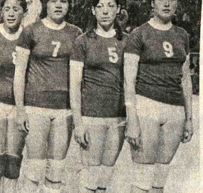
EQUIPO PACACO. Las chiquillas del Seleccionado Pacaco de Vólibol poco pudieron vencer al rival de mayor calidad técnica y experiencia como la representación china que enfrentará al seleccionado de Cochabamba.

Otro hecho insolito aconteció ayer en horrasca reunión del Comité Olímpico Boliviano cuando el presidente interno de la entidad autorizó el viaje de cuatro personas más a los Juegos Panamericanos de México.