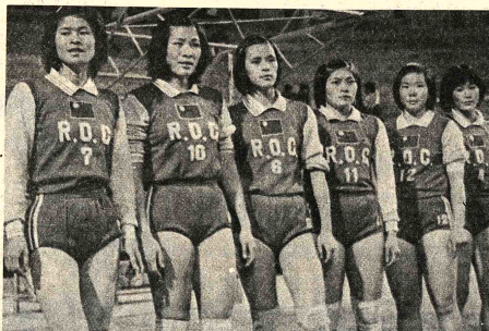
SELECCION CHINA. Integrantes del Seleccionado de vólibol de China Nacionalista que anoche ganaron con facilidad su primer compromiso en nuestro país. No necesitaron esforzarse para imponerse por 3-0 a la Selección Pacaca.

Pontiendo de manifiesto su rivalidad y solvencia técnica que su rival, la selección mexicana de vólibol de China la selección local por 3-0, en el partido que sostuvieron en el liceo de la calle México ante un gran número de espectadores. Las visitantes no cesaron esforzarse ni exhibieron en realidad, toda su gama de recursos, para lograr una victoria fácil que se tradujo en tres acrobacias en los tres sets de la confrontación.