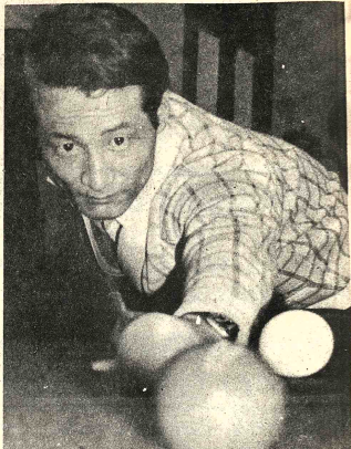
PRIMERO EN EL MUNDO. - Este es el tribandista japonés Yoshio Kobayashi, actual campeón mundial de billar a tres bandas y que desde hoy comienza a defender su corona en el certamen universal que se disputará en esta capital.

Dadas las pretensiones de ambos conjuntos el partido fue de tomarse en un buen espectáculo. Por la categoría femenina deberán jugar The Law con Magisterio. El primero de los nombrados tratará de mejorar posiciones mientras que Magisterio buscará conservar su condición de líder invitado a que es el virtual campeón, definido como está ya el descenso Colonia fue el damnificado el torneo femenino ha perdido ya todo interés y los encuentros se cumplen por obligación. Por su parte Simón Bolívar que la semana pasada se anotó una valiosa merceda victoria frente a Municipal tratará de mantener el mismo ritmo con la finalidad de chafar el descenso de categoría. Por el grupo de primera de ascenso varones, a las 19 horas, jugarán Jaime Laredo con Ingenieros.