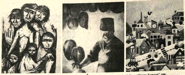
EXPOSICION DE PINTORAS BOLIVIANAS. En la casa Municipal de Cultura "Franz Tamayo" son exhibidas desde la pasada semana pinturas de artistas bolivianas.

¿Temas vulgares? No los hay, en el arte. Es decir, los hay si consideramos el arte como una manifestación estética. Por eso la palabra "estética" repugnaba a los dos. Hay que considerar el arte como una filosofía del existir o del ser. Se diría que la estética es una filosofía también, pero realmente es sólo un arte.