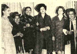
La presidenta de la Comisión Interamericana de Mujeres, embajadora Isabel Arrieta Vallejo, departe con algunas de sus invitadas que asistieron a la recepción que ofreció con motivo de la clausura del Seminario de la Mujer que auspició esa entidad.

Los integrantes de la Institución Cívica Nacional de la Batalla de Strongest se reunirán hoy en un cocktail-buffet de camaradería. La disertación estará a cargo del señor Severo Ullúa Zeneno.