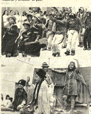
FESTIVAL DE LA CANCION.- Arriba, la reducida pero calificada delegación del norte de Potosí. Sacaca: abajo, la carroza de la Paz, adornada con motivos típicos. El segundo festival de la canción folclórica juvenil comenzó con éxito ayer en Ururo.

En horas de la noche, fue inaugurado el Festival, por el Ministro de Educación y Cultura, quien enfatizó el saludo y las felicitaciones del Presidente de la República, Elogió el espíritu laborioso de los oronuros, sus iniciativas -como el Festival-, su contribución material y artística al país.