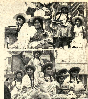
Delegación de Cochabamba en la fotografía superior; abajo, la embajada folclórica tarijeña en el desfilé inaugural del festival juvenil que se realiza en Ururo.