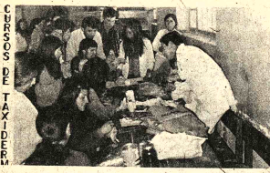
TAXIDERMIA. Un grupo de alumnos del Liceo Huanuni realiza la disección de animales, bajo la dirección de dos profesores, en el desarrollo de un curso de Taxidermia.

MAESTROS. Desde ayer, los maestros empezaron a recibir sus cheques, con los sueldos correspondientes al mes de agosto, por lo que se normalizaron las actividades lectivas. Algunos establecimientos educativos declararon paro de labores en señal de protesta por la tardanza. De acuerdo a un convenio entre los docentes y las autoridades pertinentes, los sueldos deben ser pagados hasta el día de cada mes, caso contrario habrá paro de labores, sin embargo, este plazo no siempre se observó por las autoridades, ocasionando los problemas consiguientes.