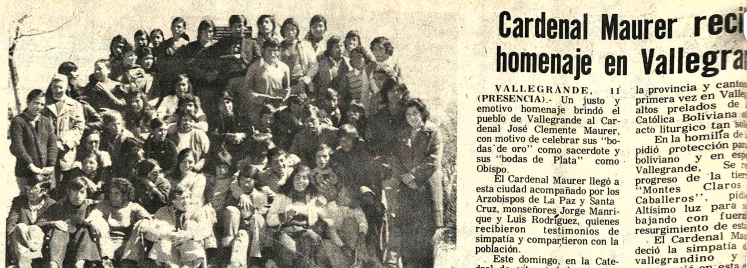
ALFABETIZADORES. Jóvenes estudiantes de Villazón asistieron a un curso de líderes alfabetizadores que fue organizado por CEAMCOS, entidad dependiente del Obispaño en Potosí. Cursos similares fueron preparados para Tarija y Cochabamba.