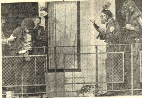
CAPTURA.- South Lake Tahoe, California, (AP).-Policías con máscaras antigases y debidamente armados con metralletas, llegan al sitio en que un franco tirador disparaba con un fusil lo que causó la muerte de una persona.

ROMA, 11 (IPS). - Wayne Eden, un bayo "rey del trote" italiano que fuera "secuestrado" hace veinte días cerca de Montecatini (Toscana) ha sido encontrado a unos sesenta kilómetros de donde había desaparecido. Sobre las circunstancias que llevaron a volver a bailar lo debían se sabe nada.