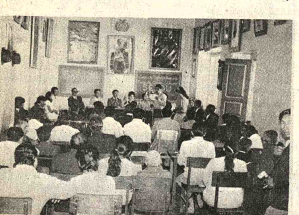
CLAUSURA. Constituyó un éxito el curso de Formación Profesional que auspiciaron SENIDI y la Academia de Ollaollu. Participaron delegados de las 14 provincias de Cochabamba. En la foto una vista del acto de clausura.

El gobierno, después de un estudio técnico sobre la necesidad de conceder a los comités de desarrollo regional autorización para que ejecuten, por administración propia, proyectos viales de prioridad, aprobó la suscripción de los respectivos convenios con el Ministerio de Transportes.