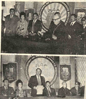
NEUVO LOCAL. La Federación de Cooperativas de Ahorro y Crédito ha inaugurado su nuevo local en Cochabamba. El Arzobispo de Cochabamba, Mons. Armando Gutiérrez (arriba) bendice las instalaciones, (abajo) El Ministro de Trabajo y Desarrollo Laboral, Mario Vargas Salinas, detalló la política cooperativista que se propone encajar el gobierno.

portaciones e importaciones con la Argentina. Se ha determinado que sea el Comité de Obras Públicas de Santa Cruz el organismo encargado de realizar la licitación y contratación de las empresas constructoras, para los estudios de factibilidad. En base a esas conclusiones, se buscará el momento oportuno para la realización de los trabajos. Queda ahora por interesar al gobierno reactualizar negociaciones con la Argentina, para construir el tramo entre Yaculva y Villamontes, con lo cual será posible la vinculación con la red de carreteras del Norte argentino. VIRI VIRU - MONTERO Por otro lado, se informó en esta ciudad la autorización del gobierno para que el Comité de Obras Públicas, con recursos propios, realice los estudios y diseño final para la carretera Viru Viru-Montero, de 40 kilómetros aproximadamente y