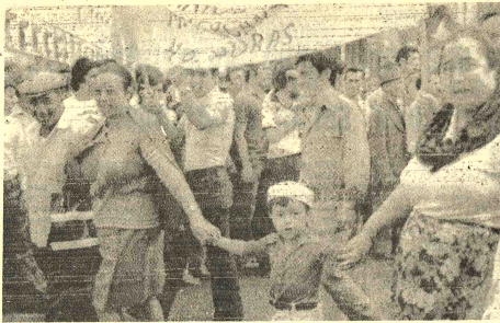
OPOSICION A GONCALVES. Portugal 4 (AP). Manifestantes socialistas opuestos a la designación de Vasco Gonçalves como jefe de Estado Mayor de las FF.AA. durante un acto de Cúmbira. Uno de los colectivos dice "Contra toda manipulación, gobierno de salvación".

En virtud de los términos del acuerdo, que requiere aún la aprobación formal de un tribunal federal, los abogados de Nixon examinarán los legajos para determinar cuáles documentos y citas grabadas están relacionados con las órdenes libradas por el senador Frank Church, demócrata por Idaho, que insistió la semana pasada en que el grupo senatorial fuera autorizado a determinar la relevancia de los documentos por sí mismo, calificó el acuerdo como "un esfuerzo de buena fe para proporcionar a la comisión los documentos que esta necesita".