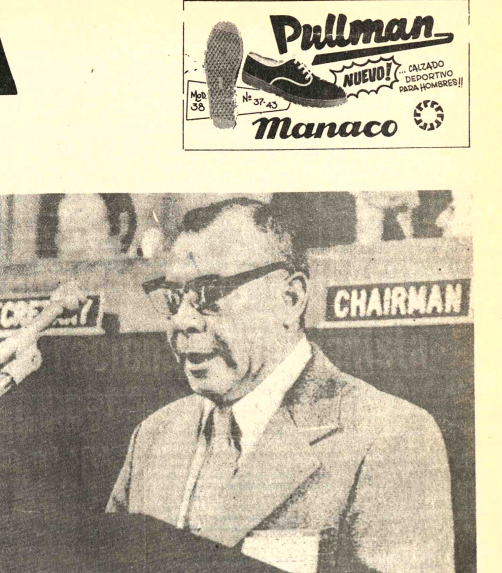
- DISCURSO. - Washington, 4 (AFP). - El Ministro de Finanzas de BOLIVIA, Cal Victor Castillo, aparece hablando durante la sesión de la Conferencia del Banco Mundial y el Fondo Monetario Internacional, cumplida hoy, Castillo, a nombre de los países del Continente, reclamó mayor atención de los entes financieros hacia Latinoamérica.

Magdoub firman por Egipto, mientras que por Israel lo hicieron el Gral. Herzl Shafir, Mordechai Gazit y el Gral. Abraham Tamir