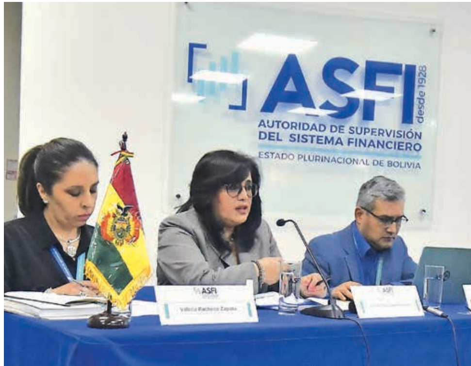
Ivette Espinoza (centro), directora de la ASFI, en conferencia de prensa, ayer.

El análisis de la ASFI revela un incremento alarmante en el uso de tarjetas de crédito y débito fuera de las fronteras nacionales. Según Espinoza, el retiro de dinero en cajeros automáticos (ATM) en el extranjero ha aumentado un