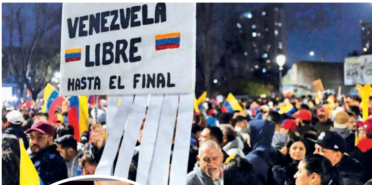
Seguidores de la oposición protestan por la decisión del Tribunal Supremo de Venezuela.