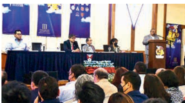
El congreso universitario que se realizó en 2023. C. LÓPEZ

La aclaración surgió después de que un grupo de docentes presentara un recurso