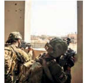
Guerra en la Franja de Gaza.