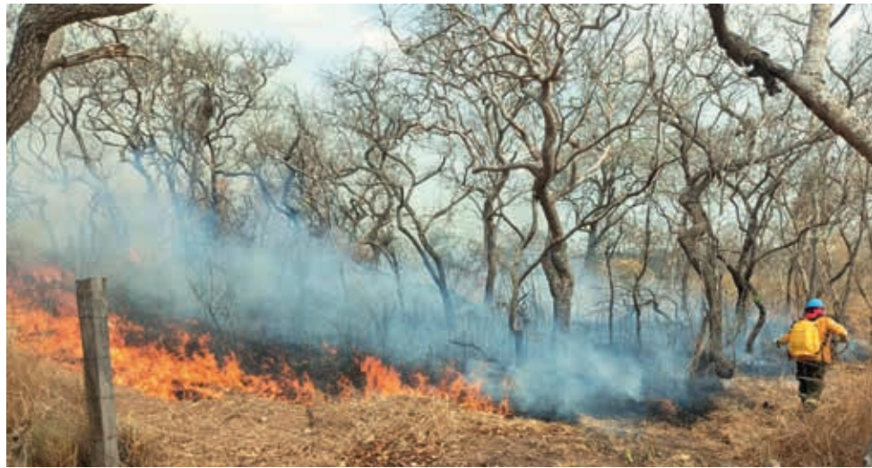
Avance del fuego en un bosque de Santa Cruz.

La captura de los sindicados se produjo en la comunidad San Vicente B, a 90 kilómetros del área urbana del municipio de San Ignacio de Velasco, después de que un poblador los denunciara por realizar quemas ilegales.