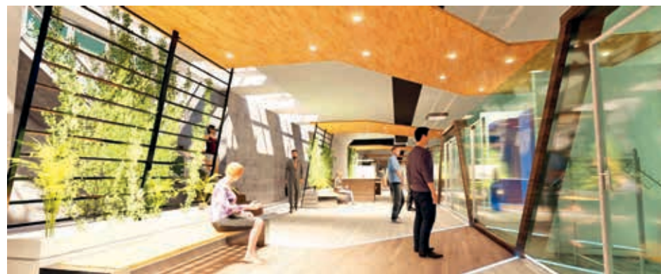
El diseño para la galería subterránea del Correo. GAMC

Se prevé que la siguiente semana se vuelva a realizar una reunión para ver los avances.