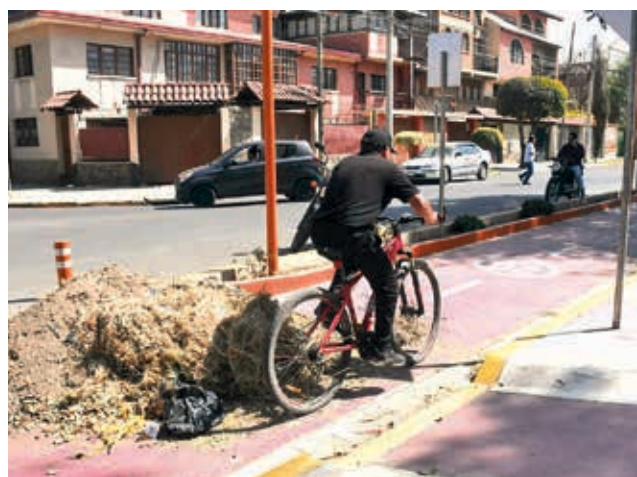
Promontorios de tierra en la nueva ciclovía.