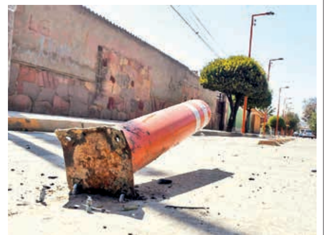
Daños en las balizas de la ciclovía de Villa Galindo.