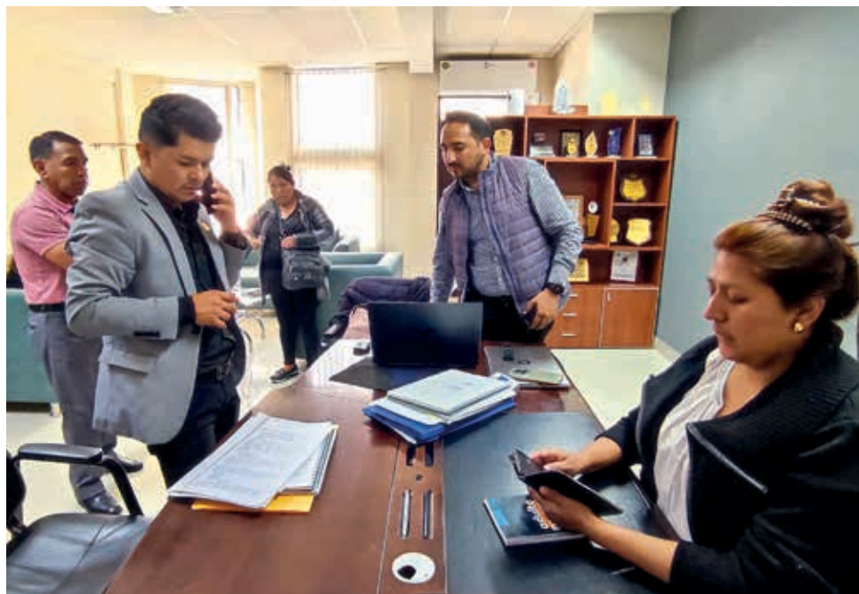
Los concejales en la oficina del Presidente por el cierre de la sala de sesiones.