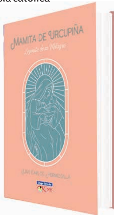
Portada del libro recientemente exhibido en el templo de San Ildefonso, Quillacollo.

toria, la novela también explora cómo las creencias populares pueden influir en la vida de las personas. Hermosilla destacó que la rica tradición cultural y las leyendas de la región lo inspiraron profundamente.