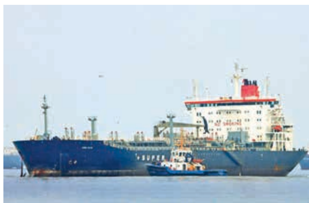
El buque cisterna que transportó el diésel. YPFB

El proceso de desembarque, llevado a cabo desde el miércoles, se realiza desde el buque tanque de alto tonelaje Sino Faith y se espera que concluya este viernes, según informó la Gerencia de Ope-