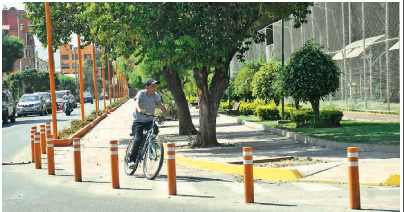
Ciclistas que usan la nueva ciclorruta en el parque Virrey Toledo.

En caso de concretarse, la Alcaldía de Cercado hará el anuncio para que los conductores tomen sus previsiones.