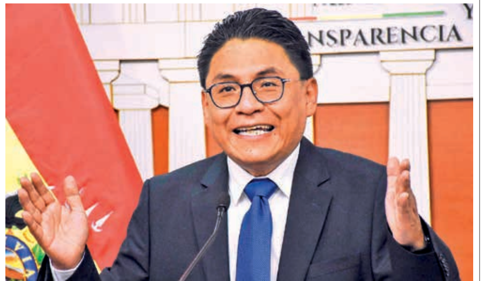
El ministro de Justicia, Iván Lima, en conferencia de prensa.

El organismo electoral debe realizar una evaluación técnica para definir si las preguntas poseen claridad, precisión e imparcialidad. Tiene tres días para responder la carta al presidente Arce.