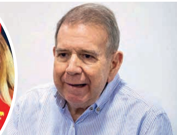
Edmundo González Urrutia, líder de la oposición.