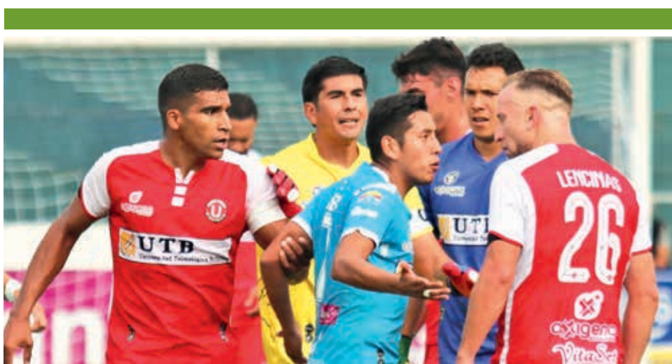
Un pasaje del partido San Antonio vs. Universitario de Vinto por el Torneo Clausura 2024, en Entre Ríos.