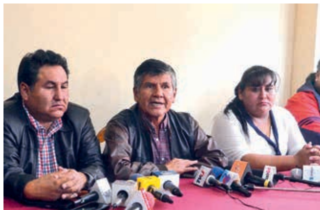
Dirigentes del transporte anuncian su pedido, ayer. HERNÁN ANDÍA

Congelado. El Comité de Transporte del municipio decidió hace dos meses suspender el reajuste del pasaje hasta el próximo año