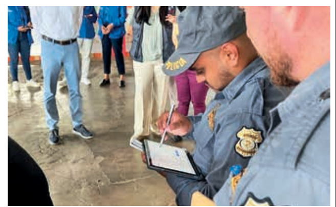
Policías de Migración en una tarea de investigación. DGMCECR

Por su parte, el viceministro de Seguridad Ciudadana,