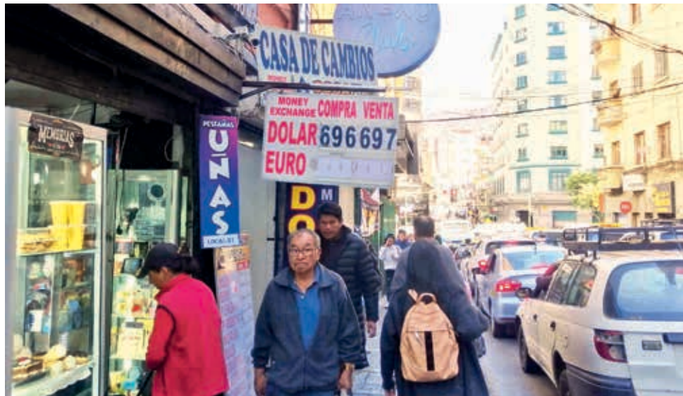
Casas de cambio donde se negocia con monedas extranjeras en La Paz.