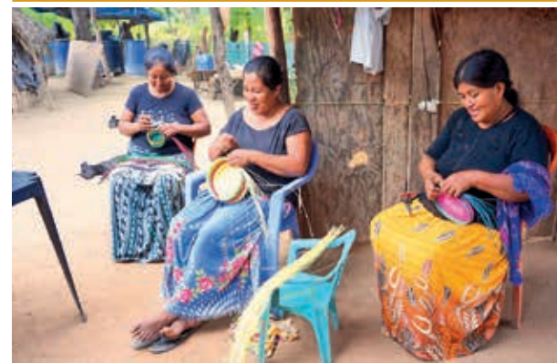
Mujeres guaraníes trabajan con tejidos.

Este acuerdo, “firmado por todos los miembros del Comité de Transporte”, será reafirmado, no cuestionado, por la Alcaldía, que ha convocado a los transportistas a una reunión hoy.