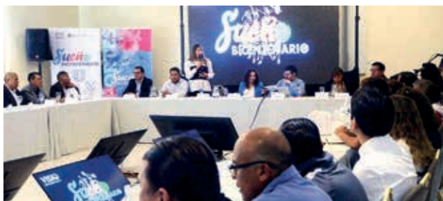
Presentación del programa de becas "Sueño Bicentenario", ayer en Cochabamba. HERNÁN ANDÍA

Polideportivo. El Ministerio de Salud y Deportes anunció que el Gobierno asistirá económicamente a 100 deportistas