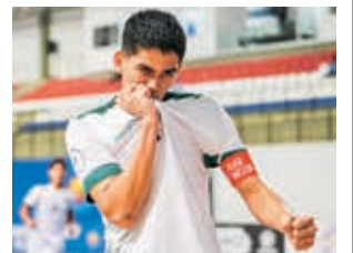
Festejo del capitán de Bolivia, ante Ecuador.

Pero, para fortuna de la Verde, Brasil goleó 6-0 a Paraguay y Ecuador derrotó 3-2 a Colombia.