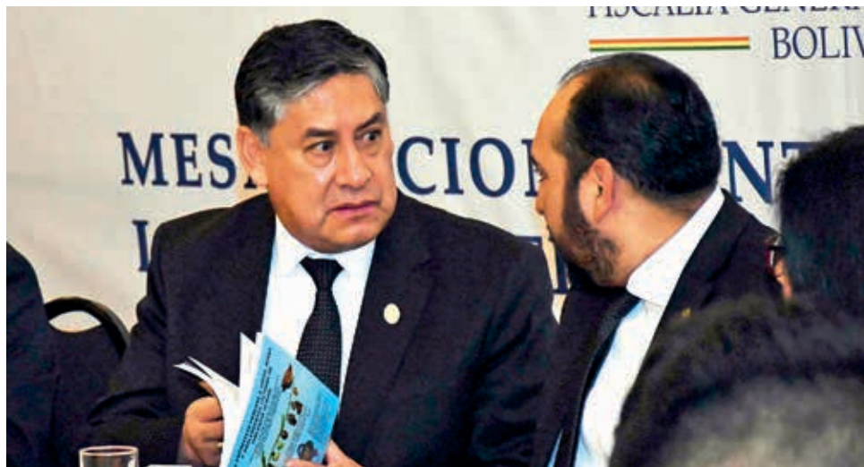
Juan Lanchipa, actual fiscal general del Estado. Su gestión termina en octubre.

La Comisión Mixta "elevará informe a la Asamblea con una lista de un mínimo de cinco (5) y un máximo de diez (10) postulantes poseedores de las mejores notas, para la designación del o la Fiscal General del Estado".