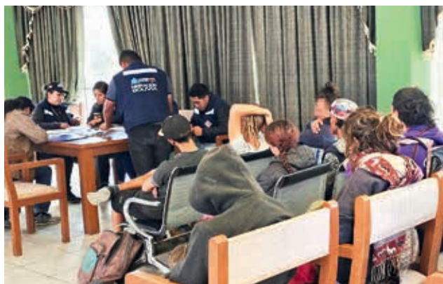
Ciudadanos extranjeros en Migraciones.

Además, en la ciudad de Santa Cruz se encontró a un ciudadano de nacionalidad venezolana en compañía de una menor de edad y que fue aprehendido y remitido a la Fuerza Especial de Lucha Contra el Crimen (Felcc) para que sea investigado por trata y