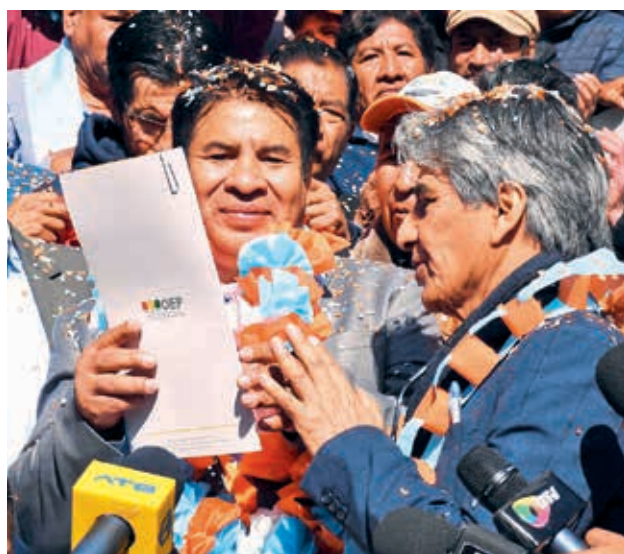
Los responsables del nuevo partido NPG, ayer.

Acotó que “nosotros no somos políticos, nunca estuvimos en la política, pero creo que el pueblo necesita un cam-