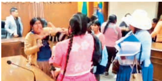
El momento de la agresión a los concejales.

Conflicto. Los legisladores afectados con aseguraron que se les impide fiscalizar al Ejecutivo y al Concejo Municipal