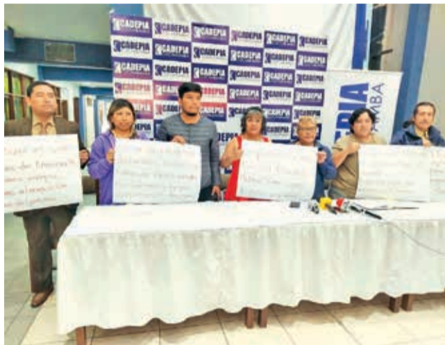
Miembros del Directorio de Cadepia exigen apoyo, ayer. W. SALAS

Expresó su preocupación por la escalada del precio del dólar en el mercado paralelo, que supera los 12 bolivianos, situación que ha dificultado la adquisición de insumos básicos para la producción. “El Estado debe normalizar esta situación. Necesitamos urgentemente una estabilidad económica en nuestro país, así como seguridad jurídica, para que otras empresas puedan venir e invertir en Bolivia”, manifestó.