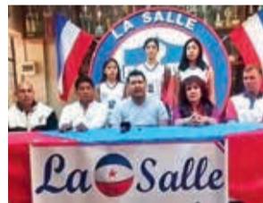
Conferencia del club La Salle, ayer.

Del torneo que empieza hoy (18:00) y tendrá su inauguración a las 19:30, serán parte La Salle (CBB), La Salle (TRJ), Cedro (BEN), Gé-