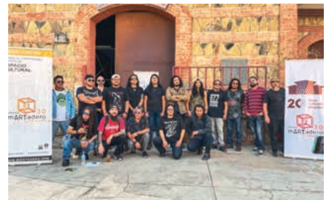
Algunos integrantes de las bandas que participarán en el evento, ayer, durante la conferencia de prensa.

Su obra ha sido expuesta en más de cincuenta exposiciones colectivas y bienales internacionales, incluyendo las organizadas por la World Textile Art Organization en Argentina, México, Uruguay y España. En 2017, Oggero recibió el prestigioso Premio Olga de Amaral en Montevideo por su destacada labor en la investigación, docencia, creación artística y difusión del arte textil.