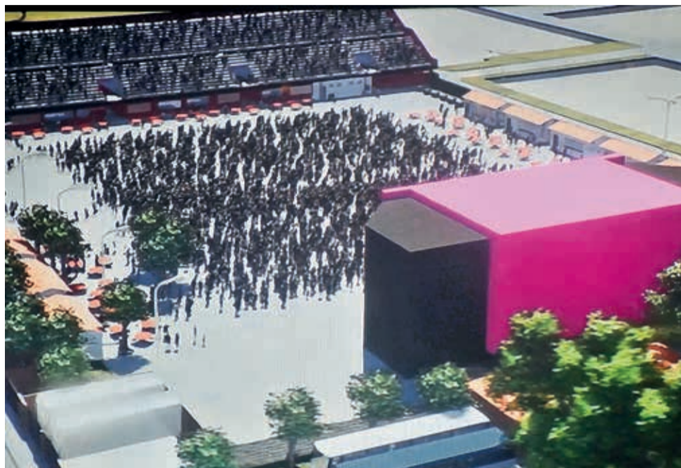
El proyecto para la construcción de Fexco Arena en el campo ferial de Alalay. JOSÉ ROCHA

Una vez que sea aprobado en el Concejo Municipal, debe tener el aval del alcalde y