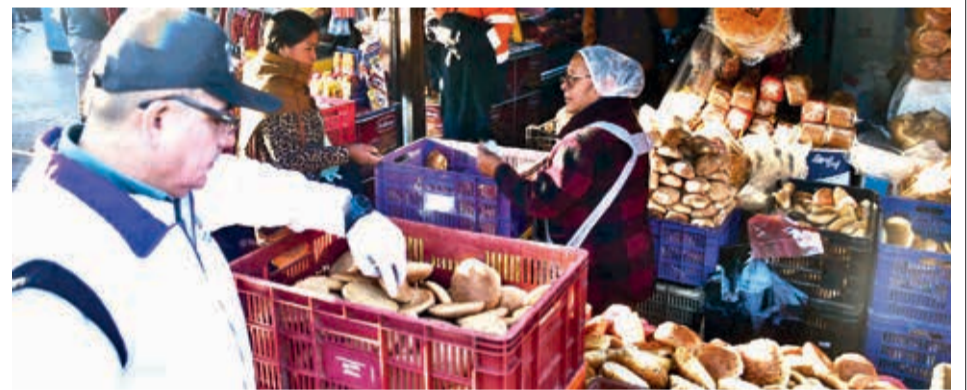
Un operativo de la Intendencia para verificar el precio y peso del pan de batalla. CL

Explicó que esta situación se debe a la crisis económica que enfrenta el municipio, al igual que la Gobernación y el nivel central. Los constructores también reportaron deudas en Quillacollo, Sacaba y otros municipios.