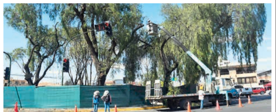
Trabajos en la rotonda de la avenida Perú. CARLOS LÓPEZ

El conflicto por la denominada alternancia continúa debido a que los titulares han sido reincorporados. Su retorno, además, podría dejar sin efecto las decisiones que tomó la directiva transitoria conformada con suplentes.