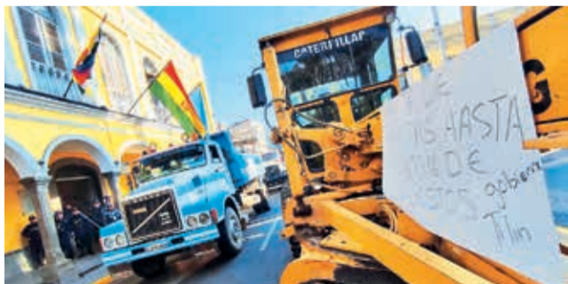
La protesta de los constructores en la Alcaldía, ayer.

Cronograma. La Alcaldía cumplirá las dos o tres planillas que adeuda a los constructores a medida que ingresen recursos al municipio