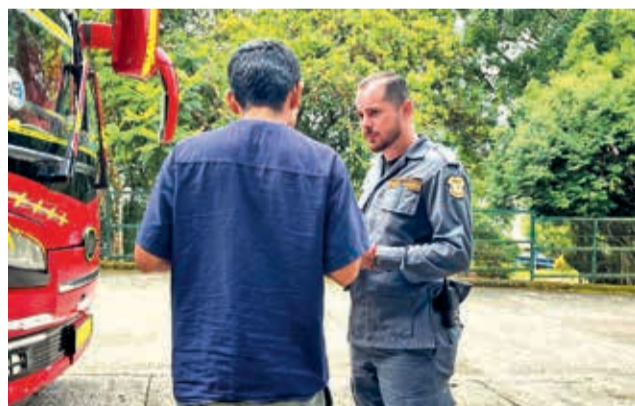
El punto de control en Costa Rica. @ELJORNAL_SV

El mexicano no pudo justificar por qué tenía a la menor ni mostró ningún documento que avale su relación con ella.