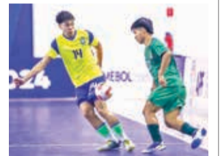
Partido entre Brasil y Bolivia, ayer.

La Verde pudo irse al descanso con el marcador