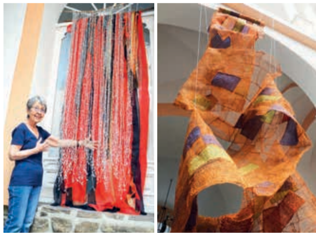
La artista y algunas de sus obras montadas en Casa Toscana.

Durante la pandemia, Oggero encontró en el bordado una nueva forma de expresión, utilizando materiales limi-