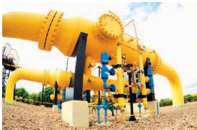
El ducto que suministrará gas a la Siderúrgica. YPFB

Desde agosto de 2024, YPFB ha comenzado a suministrar gas en volúmenes iniciales pa-