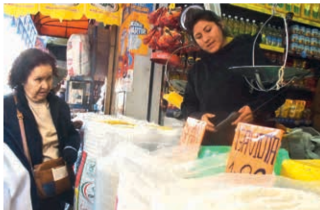
Arroz subvencionado en una tienda de Emapa. JOSÉ ROCHA

Perjuicio. El “desvío” de arroz y otros productos a tres países vecinos provoca su encarecimiento en el mercado nacional