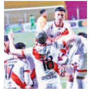
Festejo de los jugadores de Nacional, ayer.