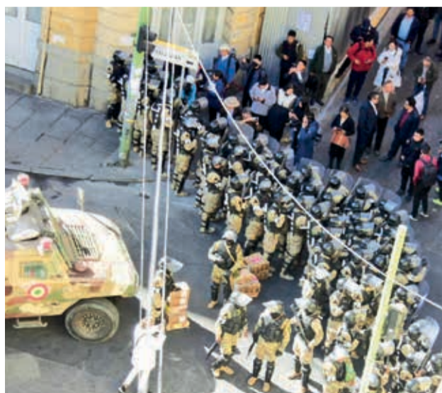
Militares durante la toma de la plaza Murillo.

El 26 de junio, Zúñiga movilizó a un grupo de militares encapuchados con quienes tomó la plaza Murillo con tanquetas y efectivos con armas de grueso calibre.