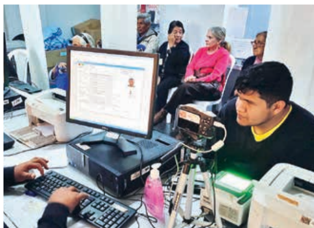
Empadronamiento en Cochabamba, ayer.