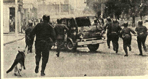
-DISTURBIOS EN BOSTON.- Boston (AP).- Policias armados con gases lacrimogenos corren hacia un hospital donde se produjeron disturbios a causa de la agresión de un grupo de jóvenes contra un médico. El vehiculo de este fue incendiado.

BUENOS AIRES, 17 (AP). La Presidenta Isabel Perón partió hoy rumbo al Balneario Atlántico de Mar del Plata para un período de descanso, luego de haber encauzado los actos de conmemoración del 125 aniversario de la muerte del Libertador General José de San Martín. Su viaje concretó finalmente el muchas veces anunciado descanso presidencial, que fue postergado una y otra vez a causa de una seria crisis política, en la cual parece haber ahora al menos una tregua. La jefa del estado partió sin anuncio previo desde el aeropuerto de la ciudad de Buenos Aires, en el avión presidencial. Media hora después la aeronave aterrizó en el aeródromo de Camet, vecino a Mar del Plata, a 400 kilómetros al sur. Se informó que la señora de Perón permanecerá alojada en el hotel Provincial de Mar del Plata, situado en pleno centro de la ciudad de 300.000 habitantes, a orillas del mar. Poco antes de partir, la Presidenta Isabel Perón asistió a un tédom oficiado en el hotel Provincial de Mar del Plata, situado en pleno centro de la ciudad de 300.000 habitantes, a orillas del mar.