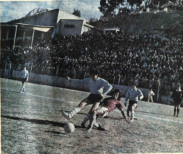
ATAACA BOLIVAR. - Escapa Fernández a la vigilancia de un defensor de los "albos". Trata de penetrar al área. El ataque de los celestes volvió a incurrir en los mismos defectos anotados en partidos anteriores. Su labor fue opaca.

Ferro perdió con Figaro, y complicó situación