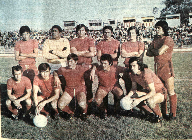
GUABIRA.- Este es el representante de Guabira uno de los animadores del campeonato cruceño de fútbol. Cuenta en sus filas con algunos valores de muchas condiciones, y en juego de conjunto, ha ido ensamblando su acción paulatinamente. Es uno de los equipos de más arraigo en la capital oriental

tiempo, Municipal entró a jugar con todo. Bolívar jugó un buen primer tiempo pero arriesgó poco en la segunda fracción. Cuidó temprano el gol de ventaja, nosotros nos sobrepusimos a esta situación y creo que estuvimos muy cerca del triunfo. El fútbol hay que jugarlo no con mala intención pero sí fuerte, como lo juega Municipal. El tiro de penal, lo pudo haberlo fallado como cualquier otro jugador. Amagué al arquero y éste no tuvo tiempo de volver. Fue un gol que nos tranquilizó y tal vez hubiese determinado la victoria.