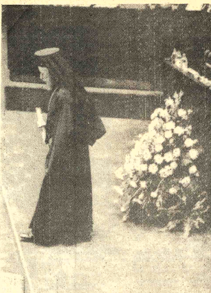
CONFERENCIA, HELSINKI, 31 (AP) - El Arzobispo Makarios desciende del podio después de hablar a la Conferencia de Seguridad, en Helsinki. La delegación de Turquía está presidida por Suleyman Demirel, que abandonó la sala durante el discurso de Makarios.