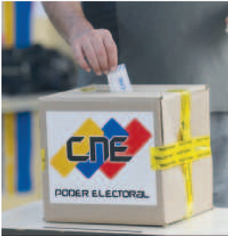
El voto en Venezuela es parte de un peritaje técnico.