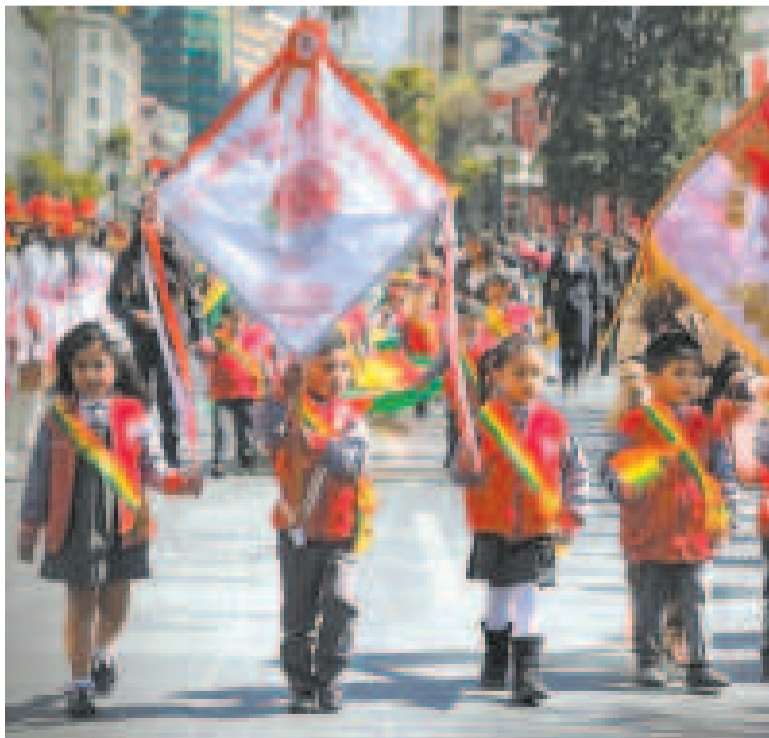
Estudiantes del ciclo primaria portan la bandera nacional.