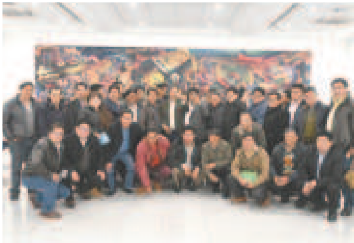
El presidente Luis Arce con dirigentes de los choferes en la Casa Grande del Pueblo.

En esta línea, esta semana dialoga con distintos sectores para mediar la economía.