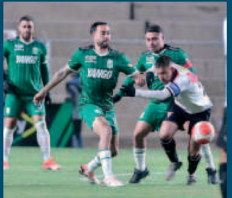
Una jugada del cotejo entre Always y Oriente, en el estadio de El Alto.