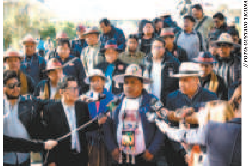
Dirigentes del Pacto de Unidad de Oruro.