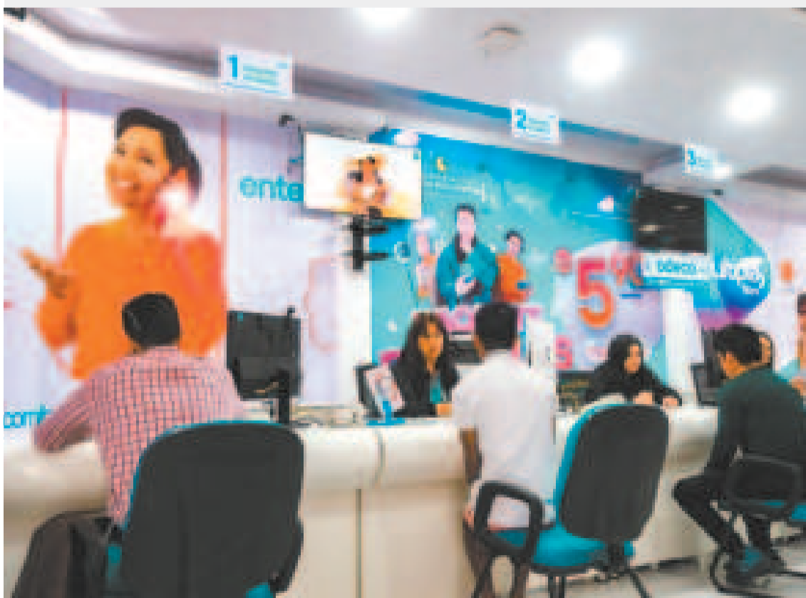
Clientes de la empresa nacionalizada en una de sus oficinas.