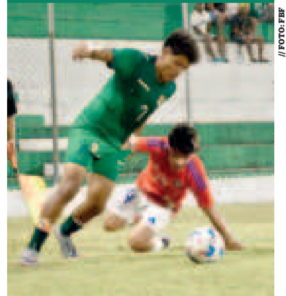
Una escena del compromiso de preparación.