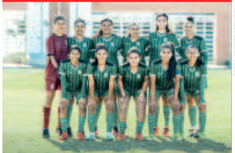
El equipo femenino de Oriente Petrolero buscará el pase a la semifinal.

Los ganadores de las llaves Oriente Petrolero-Always Ready y The Strongest-Bustillos Presto se encontrarán en la semifinal; y los vencedores de Aurora-Astor y Nacional Potosí-Deportivo Ita se cruzarán en la siguiente fase de la competencia.