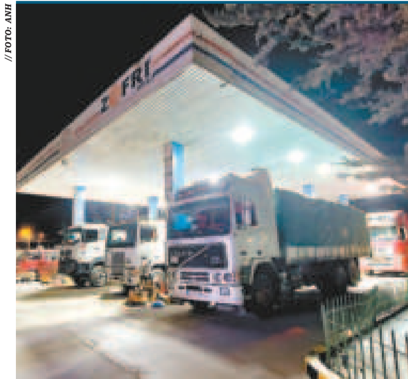
Una estación de servicio que comercializa diésel.