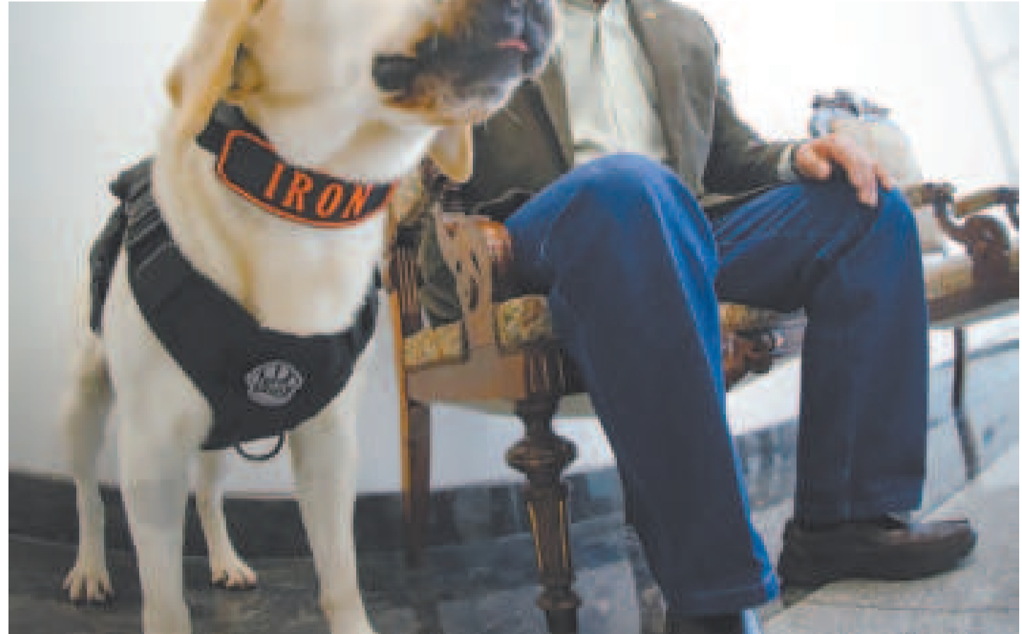
El presidente Luis Arce acompañado de su querido perro 'Iron'.

“Hemos celebrado a nuestros perritos cada año desde 2021. San Roque es una fecha tan especial que a nuestros compañeros de vida solo les falta hablar, y vamos a festejar cada vez que podamos”, ex-