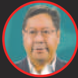
Luis Arce Catacora

Hoy (ayer) hemos acordado varias medidas que buscan solucionar el problema que está identificado en el sector externo de la economía nacional. Se requiere un incremento en las exportaciones”.