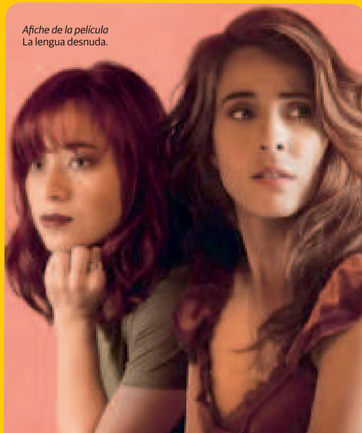
Afiche de la película La lengua desnuda .