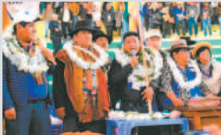
Congreso del MAS-IPSP en El Alto.

Advirtió de que ella procederá como “Salomón, si hay que cortar al niño de la mitad, procederá”.