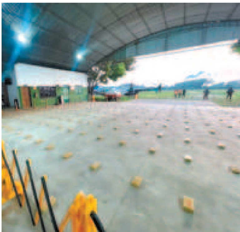
La FELCN exhibe la cocaína secuestrada en la pista clandestina en Santa Rosa.