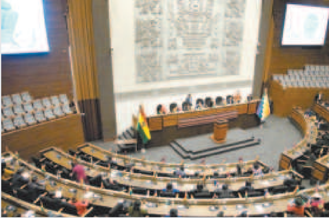
La Asamblea Legislativa, donde están estancados los créditos de financiamiento externo.