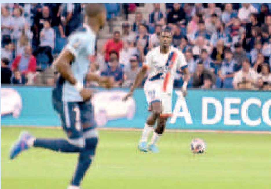
Una incidencia del encuentro entre Le Havre y PSG en el comienzo de la liga francesa.