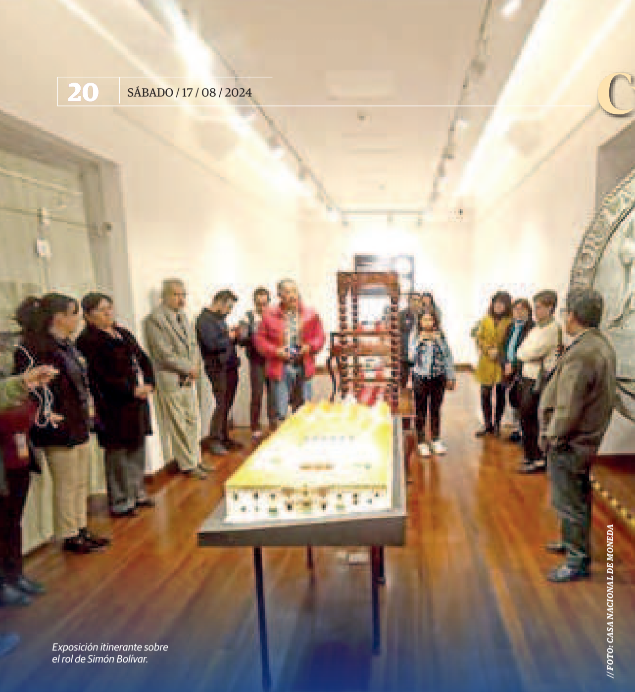
Exposición itinerante sobre el rol de Simón Bolívar.