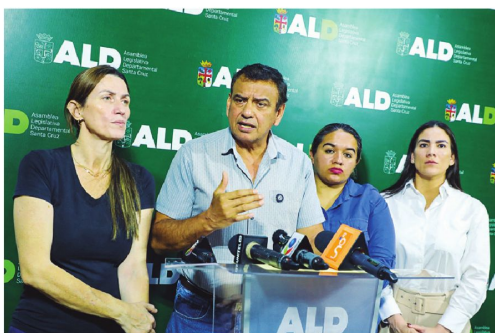
Bancada de Creemos denunció un recorte de más de Bs 400 millones

Precisamente, el 30 de agosto es la fecha tope para que el Instituto Nacional de Estadística (INE) brinde un informe de los resultados preliminares del empadronamiento y aplicar la redistribución