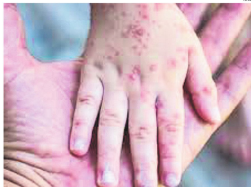
La enfermedad afecta tanto a menores como adultos.

En las últimas horas se reportó un caso sospechoso de viruela símica o mpox fue reportado por el Sedes de Cochabamba. Pero aún se aguardan los resultados del laboratorio del Centro Nacional de Enfermedades Tropicales (Cenetrop), que confirmen o descarten el diagnóstico.