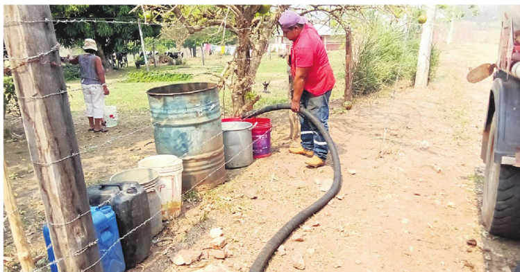
La sequía golpea a las zonas de incendios. En San Javier distribuyen agua a las comunidades

“El fuego llegó desde Concepción y todos los bomberos, tanto comunales como municipales,