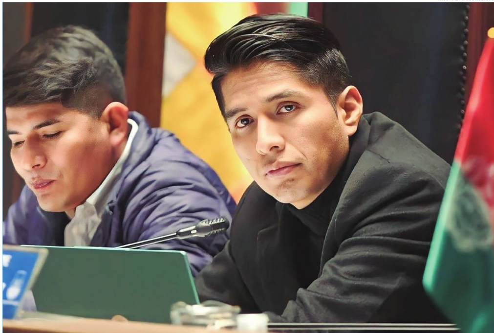
Andrónico Rodríguez Ledezma, legislador del ala evista, dirigente cocalero de Chapare y presidente del Senado, es activo en sus redes