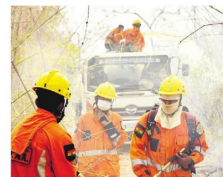
Bomberos revelan sus sacrificios

participantes del mercado de valores. Uno de los responsables dice que la ASFI ya retiró la sanción que había sido impuesta. A6