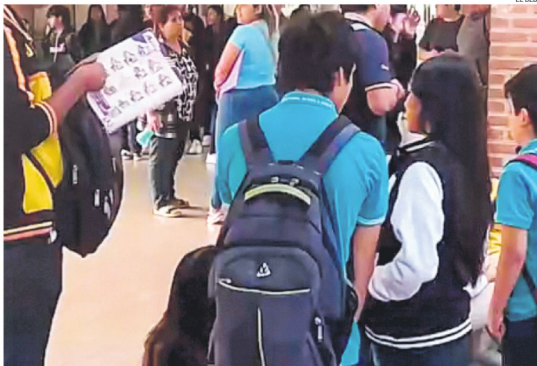
La Defensoría de la Niñez inspeccionó el centro educativo para acumular pruebas y esclarecer el hecho