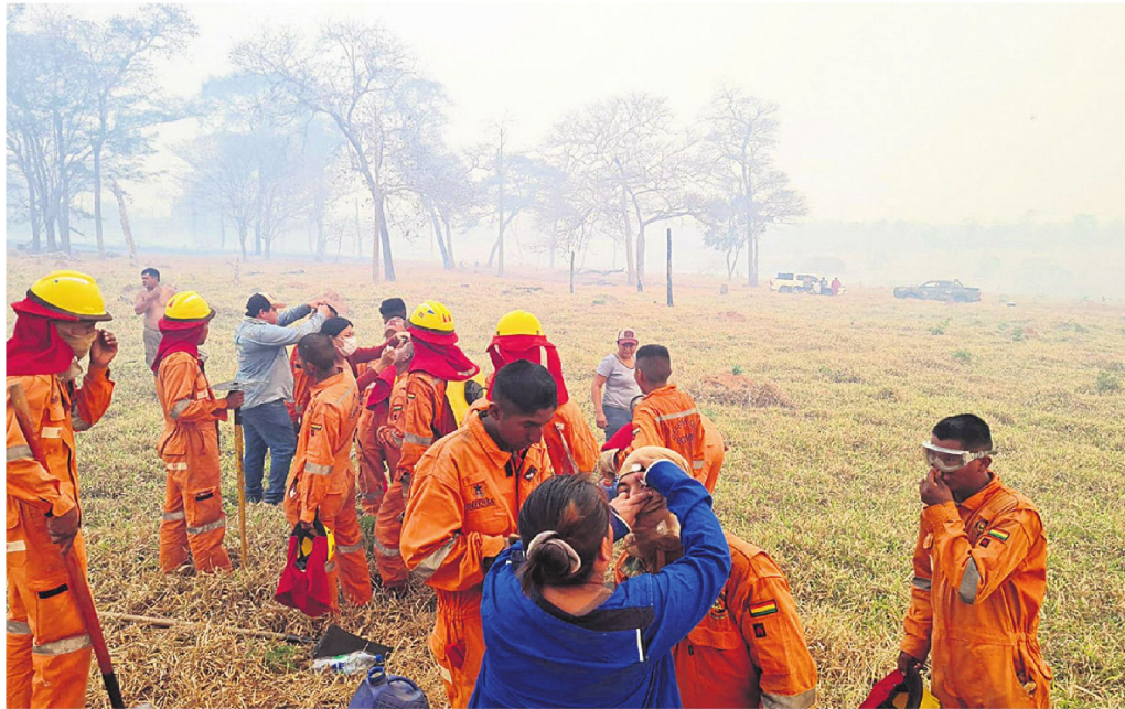
La asistencia que se brinda a los que están en primera línea en la lucha contra los incendios forestales. La humareda cobra factura a la salud

En San Javier combaten dos incendios de magnitud, uno en la serranía San Lorenzo, que es un área protegida municipal. En este sector se protege a las co-