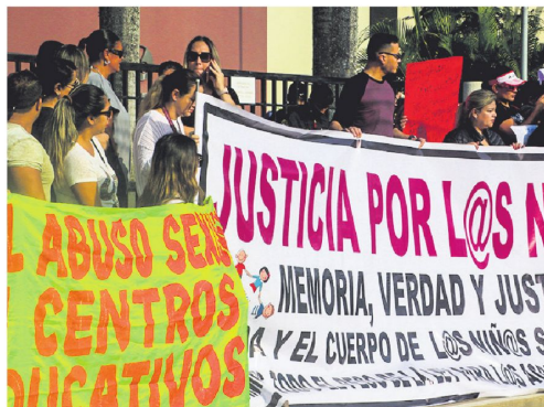
Las protestas para que se aclare este hecho fueron permanentes

Al haberse declarado la resolución de rebeldía el juicio oral ya fijado quedó suspendido hasta