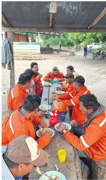
Los bomberos que trabajan en San Javier