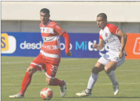
Importante victoria del "matador" que se acerca a zona de clasificación

En tiempo de adición (94'), Tobar colocó el descuento con un derechazo de media distancia, luego de dar una media vuelta. El tiempo sería insuficiente para buscar el empate. Esta derrota colocó en apuros al entrenador Pablo Godoy.