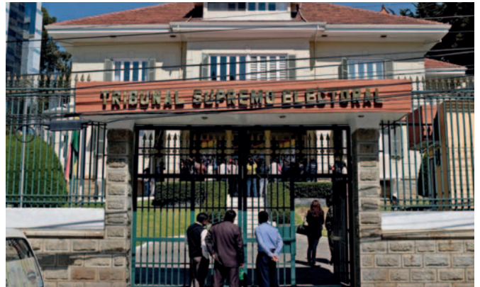
El frontis del Tribunal Supremo Electoral, en La Paz

que las organizaciones sociales también pueden participar en las elecciones nacionales con sus propios candidatos, siempre que cumplan con cinco requisitos establecidos en el artículo 209 de la Constitución Política del Estado (CPE).