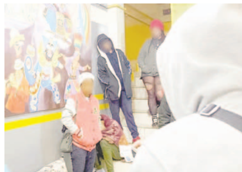
La Felcc identificó a 11 venezolanos y un argentino

Agentes de la Felcc notificaron del hecho a uniformados de la Organización Internacio-