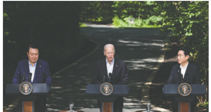
El presidente de Corea del Sur, Yoon Suk Yeol, el presidente de EE.UU., Joe Biden, y el primer ministro de Japón, Fumio Kishida, durante su reunión de hace un año en Camp David (EE.UU.)

Otro importante resultado de la cumbre es la realización anual de ejercicios militares conjuntos entre los tres países. Además, los mandatarios acordaron crear una línea directa para comunicarse de manera más ágil ante cualquier tipo de crisis que pueda afectar a la región del Asia-Pacífico.