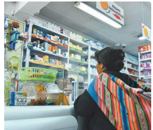
Los consumidores finales son los que sufren las consecuencias

Sin embargo, advirtió que, sin una intervención adecuada, la situación podría empeorar, afectando aún más a la población en general.