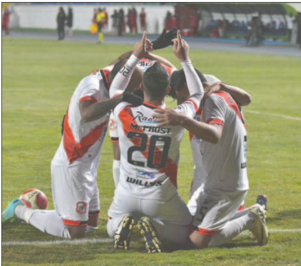
Nacional Potosí suma tres puntos importantes a pesar de no haber jugado un gran encuentro