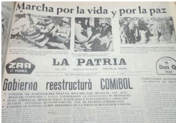
Publicación del periódico LA PATRIA sobre los acontecimientos

Permanecimos allí hasta que el pueblo, con paros, huelgas, marchas, desbarató la decisión del gobierno de su tarea de persecución y otorgó libertad a quienes les habían privado de la misma. Así se cerró el telón de la Marcha por la Vida.