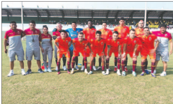
El conjunto realista sigue invicto en el torneo nacional