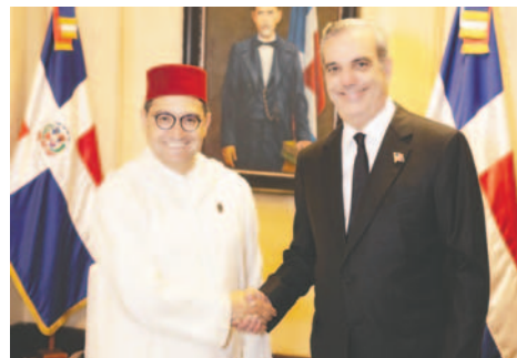
El mandatario, Luis Abinader, durante una reunión con el ministro de Asuntos Extranjeros, de Cooperación Africana y de los Marroquíes en el Extranjero del Reino de Marruecos, Nasser Bourita, este sábado en el Palacio Nacional en Santo Domingo (República Dominicana)

presidente de Guatemala, Bernardo Arévalo de León, o con el primer ministro de Curazao, Gilmar Pisas, entre otros.