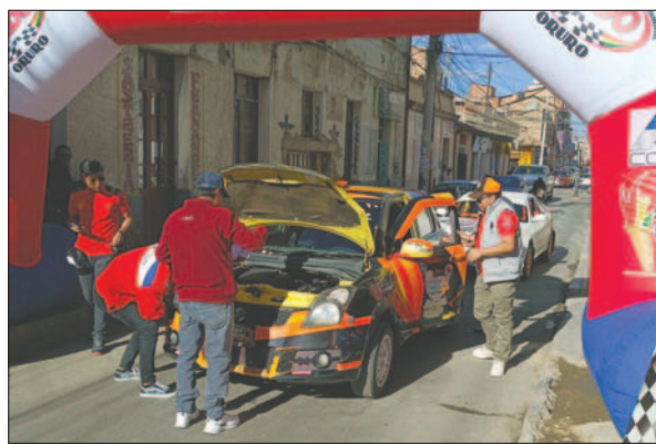
Revisión intensa de cada uno de los vehículos que estarán en la competencia

deportiva prevista para la jornada. Algunas categorías estarán bastante reñidas debido a que el ranking departamental se encuentra muy ajustado y, en función de los puntos que se sumen, los pilotos podrán ascender a los primeros lugares en el calendario de este año.