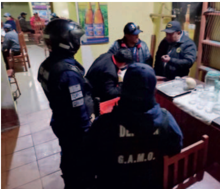
Varios locales no cuentan con seguridad privada

Estas labores consisten en verificar la mayoría de edad solicitando el documento de identidad a los usuarios que frecuentan discotecas, karaokes, bares y otros establecimientos económicos.