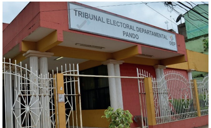
Fachada del Tribunal Electoral Departamental (TED) de Pando

Por otra parte, la autoridad electoral detalló que, en el departamento