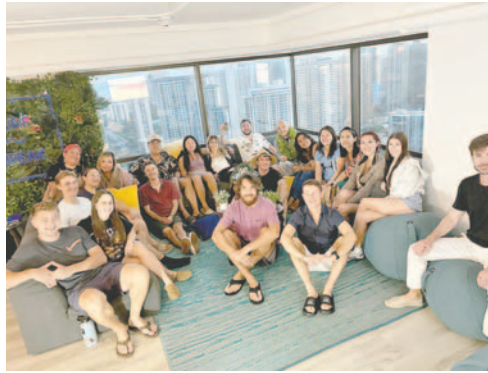
Con esta iniciativa se muestra como la felicidad contribuye en el aspecto laboral

Además, la iniciativa no son charlas simples, sino que también se considera una forma de arte en la gestión organizacional, es un taller muy dinámico, utilizando diferentes herramientas artísticas como el canto, la actuación, pintura y otros, que ayudan en la confianza de las personas. Se busca crear un entorno en el que los individuos y las instituciones puedan florecer a través de un equilibrio delicado entre empatía, diálogo y una cultura de positividad.