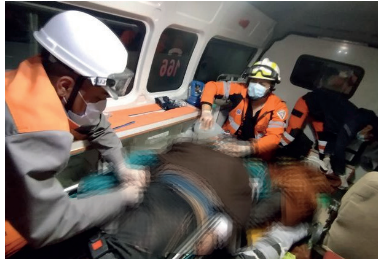
Cuerpo de Bomberos Voluntarios "Caballeros de Fuego" auxilió a las personas heridas

El testimonio del sobreviviente también reveló que algunas personas fueron expulsadas del vehículo a través de las ventanas y que el conductor habría cambiado las llantas poco antes de partir.