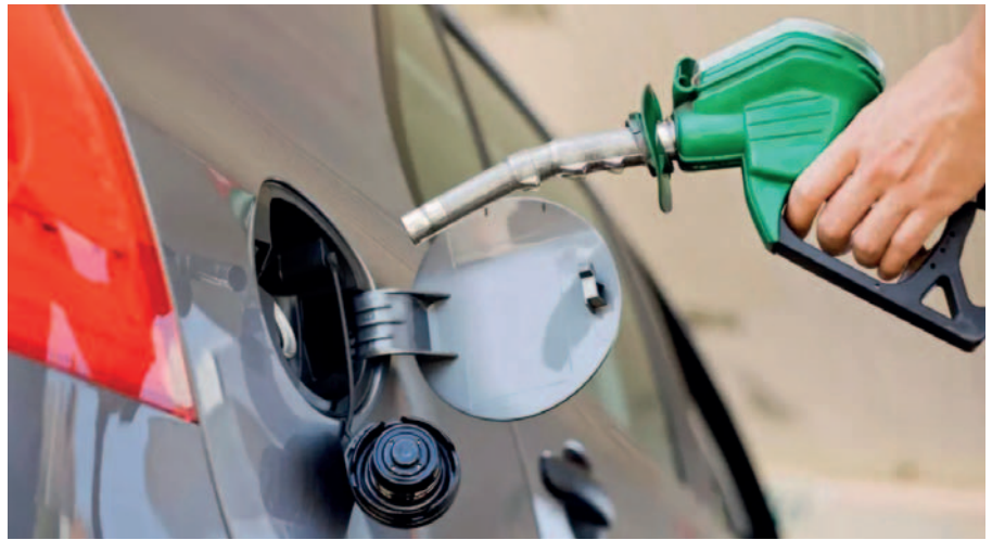
Las cinco medidas de la ANH generaron preocupación /REFERENCIAL

Otro punto de preocupación para Asosur es que ha solicitado “nuevas modalidades de comisiones con los incentivos necesarios” para hacer viable la implementación de estos nuevos productos. Asimismo, consideran que es urgente establecer mecanismos que aseguren la sostenibilidad de los proyectos y el bienestar de los consumidores.