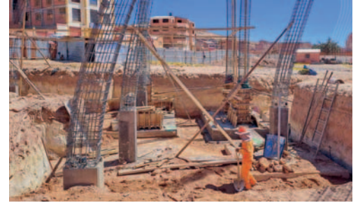
Avanza construcción del nosocomio de segundo nivel