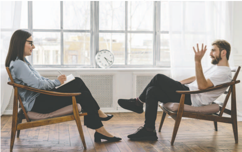
Es necesario que los gobiernos inviertan más en salud mental

El impacto del aumento del gasto público en salud no se manifiesta de manera inmediata, la inversión en salud mental mostrará resultados en el largo plazo, y aunque los réditos políticos no sean tan evidentes en las esperadas elecciones, la inversión en salud en general es crucial para el bien de las familias y los países. Ojalá la clase política latinoamericana entienda que los verdaderos estadistas deben pensar en la siguiente generación y no en la próxima elección.