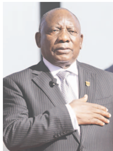
El presidente de Sudáfrica y Defensor de la Unión Africana (UA) para la Prevención, Preparación y Respuesta ante Pandemias, Cyril Ramaphosa

Además, el presidente sudafricano llamó a los Estados miembros de la UA a aumentar la asignación de recursos y adoptar un enfoque de salud única. También destacó la importancia de mejorar las capacidades, como la detección de casos, el rastreo de contactos y la vigilancia transfronteriza. Esta semana, se están investigando casos adicionales en tres países para su confirmación.