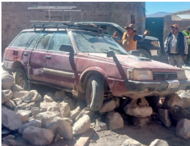
Tránsito avanza en las investigaciones para esclarecer el atropello

Se espera que las fuerzas del orden realicen diversas pesquisas para establecer claramente las circunstancias del accidente y conocer el estado de salud de la víctima.