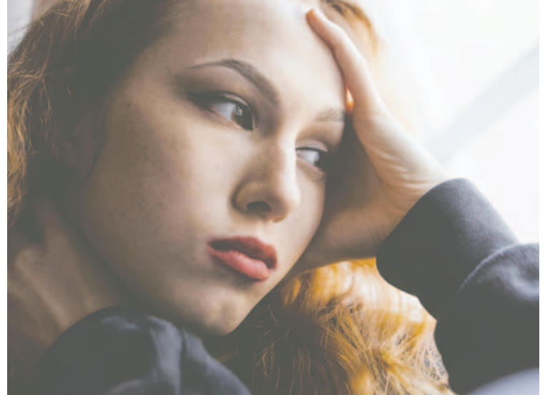
El suicidio crece cada vez más como una principal causa de muerte

Para que la intervención desde la política pública sea