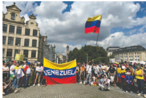
Este sábado miles de opositores salen a las calles de Venezuela y otras ciudades alrededor del mundo, como es el caso de Bruselas, para exigir que se conozca “la verdad” de las elecciones presidenciales del pasado 28 de julio

También salieron a la calle miles de personas en las principales ciudades del país, en respuesta a la petición de Machado y