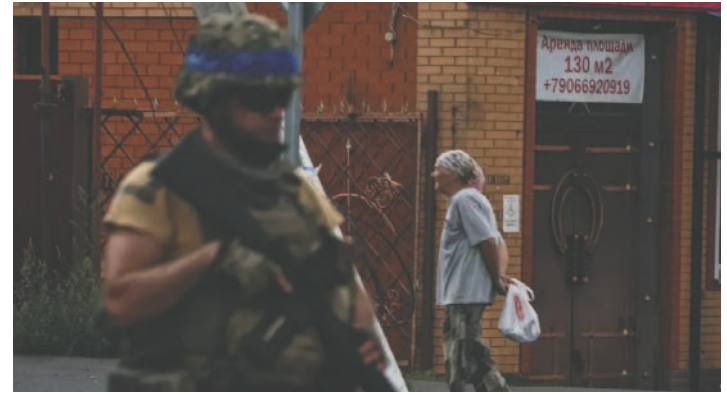
Un soldado ucraniano patrulla las calles de Sudzha, en Kursk (Rusia)

La diplomacia rusa denunció que, tras supuestamente violar las leyes rusas y las normas elementales de la ética periodística, “los corresponsales italianos aprovecharon su estancia en territorio ruso para difundir por medios propagandísticos los crímenes del régimen de Kiev”. La embajadora italiana explicó a las autoridades de Moscú que los equipos de noticias de RAI trabajan de forma autónoma e independiente, sin recibir órdenes de Roma.