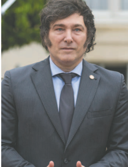
Imagen de archivo del presidente de Argentina, Javier Milei