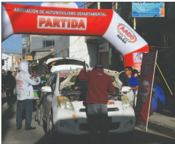
Son 23 los binomios habilitados

Agregó que también se llevarán a cabo otro tipo de actividades que darán un marco especial a la fiesta