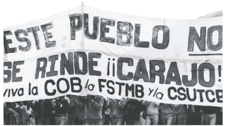
Miles de personas participaron en la Marcha por la Vida

Al arribo de la marcha a diferentes localidades, la población saludaba con recibimientos sorprendentes, esperaban con desayuno, con alguna comida, dependiendo de la hora de llegada, como