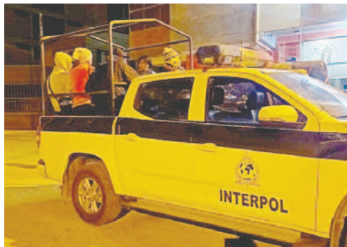
La fuerza anticrimen remitió a los 12 extranjeros a Interpol

“Se intervino un hospedaje céntrico de esta ciudad donde se logró, primero, arrestar a dos personas que estaban ofreciendo servicios sexuales, pero como resultado de este operativo se encontraron a