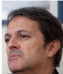
Representante de la FAO en Bolivia, Rodrigo Roubach, durante una entrevista con EFE en La Paz

El Gobierno de Bolivia y la Organización de las Naciones Unidas para la Alimentación y la Agricultura (FAO) están llevando a cabo un proyecto para diversificar la producción acuícola y contribuir a la seguridad alimentaria local. Este proyecto de asistencia técnica en acuicultura y pesca busca aprovechar el potencial del país en sus tres cuencas hidrográficas, incluyendo la posibilidad de cultivar camarones en lugares como los salares en el Altiplano y en regiones tropicales sin acceso al mar.