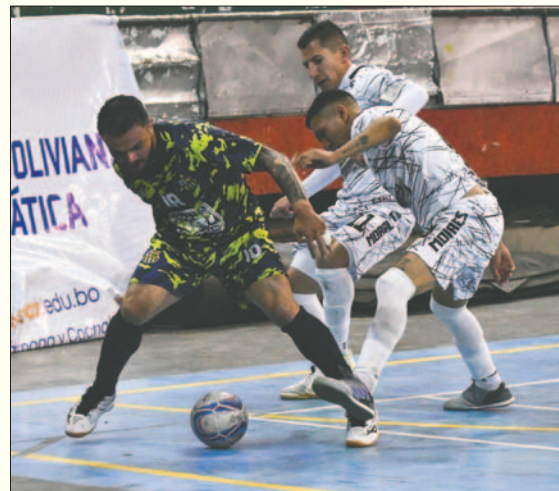
Wolf Sport sumó su segundo triunfo a costa del elenco orureño

Morales Moralitos debe reaccionar y empezar a sumar puntos para no quedarse estancado y terminar en la zona de descenso, tal como ocurrió la gestión pasada, donde tuvo que luchar bastante para mantener la categoría. Una situación que el equipo orureño no quiere volver a repetir.