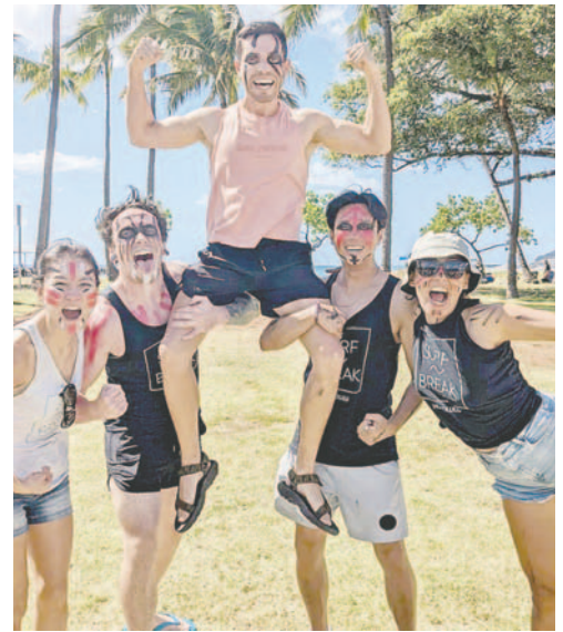
La participación no tiene costo y está dirigida a trabajadores y supervisores

para establecer un entorno de trabajo positivo y productivo, donde los empleados se sientan realmente valorados y motivados. Cuando las organizaciones priorizan el bienestar de sus empleados, se reducen significativamente el estrés y la ansiedad, creando un espacio donde la satisfacción y el compromiso crecen de manera natural. Este enfoque no solo mejora la eficiencia laboral, sino que también fortalece la moral del equipo y fomenta una cultura de