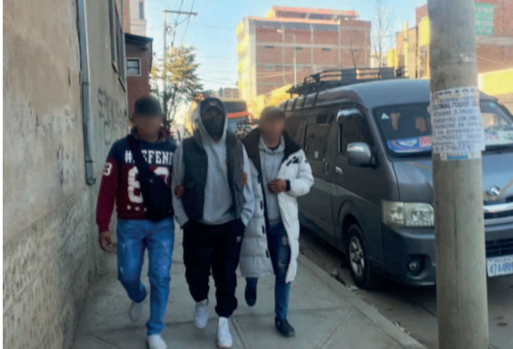
Personal del DIC aprehendió al implicado

Se espera que el presunto autor del delito de estupro comparezca ante la autoridad jurisdiccional, quien determinará su situación jurídica.