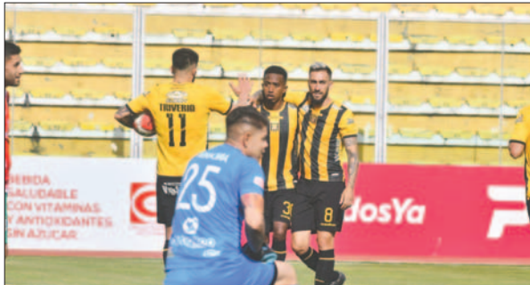
Real Tomayapo ante The Strongest, el duelo estelar de este domingo

Royal Pari recibirá a Aurora a las 19:30 horas en el estadio "Ramon Aguilera Costas". Será un choque en el que los "inmobiliarios" necesitan sumar tres puntos para no quedar rezagados en las últimas posiciones.