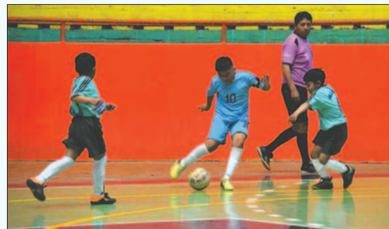
El segundo partido se cumplió ayer por la tarde en el Palacio de los Deportes

Tras el segundo encuentro, los padres de familia expresaron su preocupación debido a los problemas que aún persisten con la Comisión de Fútbol Bolivia y la Asociación Departamental de Fútbol Oruro. Se ha puesto en duda la participación de los pequeños en el torneo nacional sin argumentos valederos. Por ello, los dirigentes de la asociación municipal orureña se trasladarán a La Paz para buscar una solución e impedir que los deportistas sean los afectados.