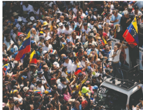
La líder de la oposición venezolana María Corina Machado (d) agita la bandera de Venezuela frente a seguidores este sábado, en Caracas (Venezuela)

Ayer se presentó nuevamente en el ya popular camión de campaña, acla-