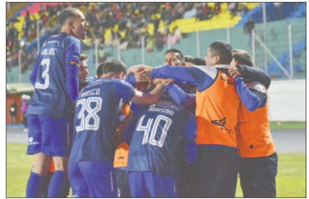
El cuadro orureño abrió la cuenta, pero no supo mantener el resultado