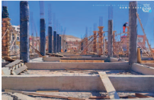
Proyecto tiene un avance físico del 11%

En una inspección realizada a la construcción del Hospital de Segundo Nivel "Isaías", el Gobierno Autónomo Municipal de Oruro (GAMO) verificó que el avance físico del proyecto llega al 11% y la empresa constructora tiene planificado tratar de cerrar la obra