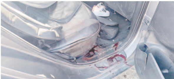
Los trabajos de campo establecerán las causas de la colisión

edad, ocupante del automóvil; mientras que los dos heridos son niños de 10 y 6 años que iban en la vagoneta y fueron llevados a la Clínica Natividad de la ciudad de Oruro para re-