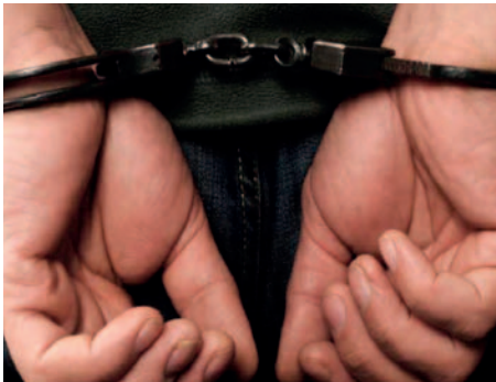
Un operativo permitió encontrar a los responsables del delito /REFERENCIAL