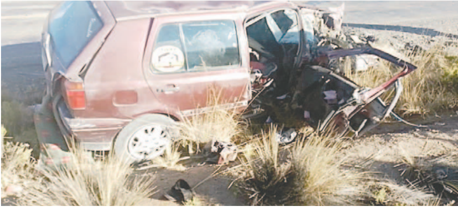
Tránsito indaga las circunstancias del fatal accidente