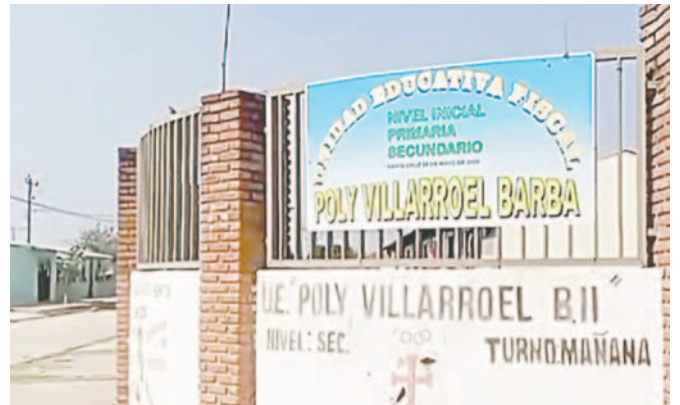
Estudiantes de la Unidad Educativa “Poly Villarroel” en Santa Cruz reciben clases en condiciones precarias

Asimismo, cuestionó el destino de los recursos públicos, señalando que el dinero de los impuestos no se ve reflejado en las obras que necesita la ciudadanía cruceña.