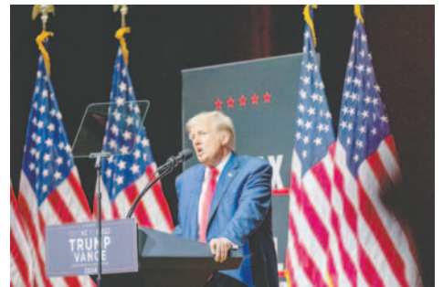
Fotografía de archivo del expresidente estadounidense y candidato republicano Donald Trump en Carolina del Norte, EE. UU., el 14 de agosto de 2024