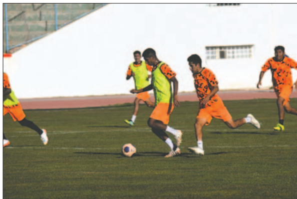
El decano listo para la competencia en su fase nacional