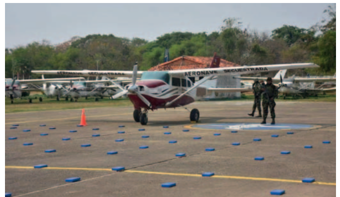
Avioneta con 416 kilos de cocaína interceptada en Moxos, Beni

La Fiscalía también procedió con el decomiso de la aeronave Cessna de color blanco y guindo con matrícula CP-3024.