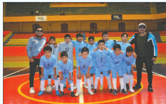
El seleccionado orureño espera poder representar al departamento en el torneo nacional