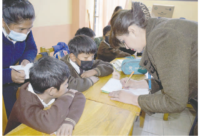
Niños son los más vulnerables a procesos respiratorios /LA PATRIA

“Considero que por lo menos esta semana próxima deberíamos resguardar a los estudiantes para ver la tendencia y si es estacionaria, pues ya la última semana de agosto