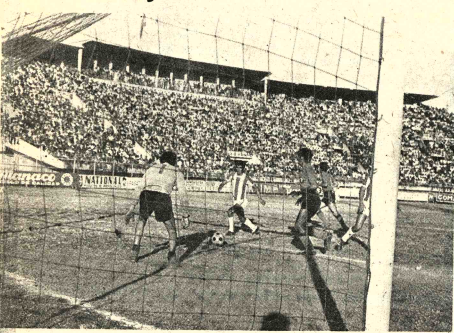
COCHABAMBA, PRESENTA. Por Carlos Dalence. Cuando aún faltan algunas fechas para la terminación de la segunda rueda del torneo local, y resta además la tercera, los seleccionados en fútbol consideran que el elenco de Wilsterman sacará su ventaja para coronarse como campeón.