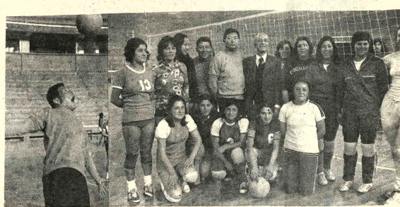
SE PREPARAN.- A todo ritmo continúa la preparación del seleccionado nacional de vólibol en el Coliseo Cerrado "Ciudad de La Paz" el titular de la Secretaría General de Deportes a que está cumpliendo gran labor en nuestro medio.