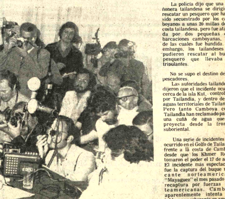
CONFERENCIA DE PRENSA. - Roma 13 (AP). - El jefe del partido socialista portugués Mario Soares, izquierda, responde a los periodistas en el Club de la Prensa Extranjera, donde ofreció una conferencia de prensa sobre los acontecimientos en Portugal.

El Sr. Banzer señaló que evidentemente la crisis mundial afecta también al país, pero que la adopción oportuna de medidas amortigua el impacto. Explicó que esas medidas consisten en reajustes presupuestarios, algunas limitaciones en gastos que no son indispensables para la nación, y acomodando frecuentemente el presupuesto. "No hay que alarmarse, pero que en la totalidad nada la seguridad de una marcha normal".