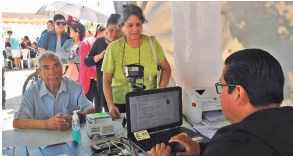
Ciudadanos se inscriben en el padrón biométrico masivo en Cochabamba. DANIEL JAMES

El día de la votación se elegirán a 52 magistrados.