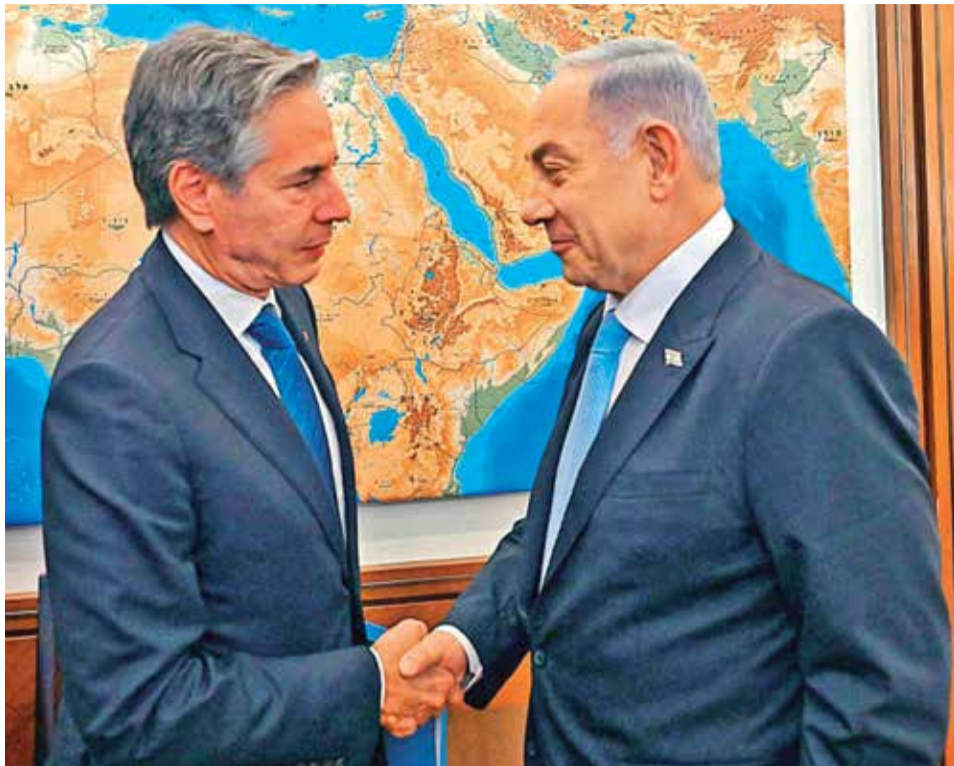
El primer ministro israelí, Benjamín Netanyahu (der.), y del secretario de Estado estadounidense, Antony Blinken.