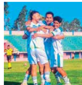
Festejo de los jugadores de Amanecer de Vinto