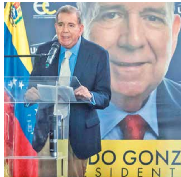
El opositor venezolano Edmundo González Urrutia.

Venezuela. Las organizaciones tienen prohibido recibir aportes económicos destinados a organizaciones políticas