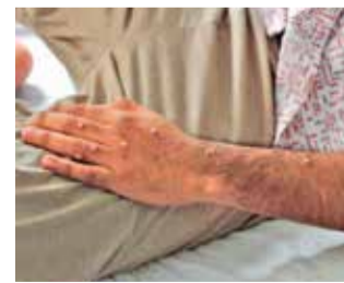
Un paciente es atendido tras ser diagnosticado con mpox.

Latinoamérica no ha reportado hasta el momento casos de la variante clado Ib de mpox, pero ante la declaración de emergencia de salud pública internacional de la Organización Mundial de la Salud (OMS), las distintas autoridades sanitarias han emitido alertas de vigilancia epidemiológica y están implementando medidas de preparación ante