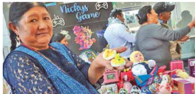
La oferta de artesanías en la Feria de Alasitas. HERNÁN ANDÍA

El tren sale cada 30 minutos de 5:30 a 20:45 de lunes a domingo. Si la cantidad aumenta, como sucedió el domingo cuando se formaron fi-