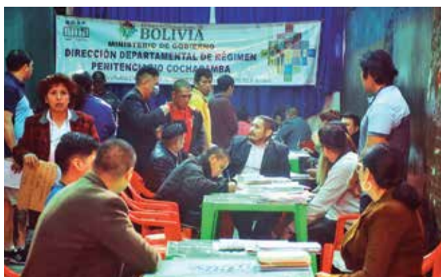
Reclusos en la cárcel San Antonio, ayer. JOSÉ ROCHA

"Uno de los mayores problemas que hay en las cárceles a nivel nacional es el hacinamiento (...). En Cochabamba tenemos 4.330 reclusos en todo el departamento y el objetivo de este plan es reducir la cantidad de detenidos preventivos", indicó el presidente del Tribunal de Justicia co-