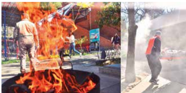
Simulacros de preparación en el colegio San Agustín. GOB CBB

Prevención. Bomberos voluntarios, de la Policía y las UGR capacitan, cada semana, a instituciones y unidades educativas