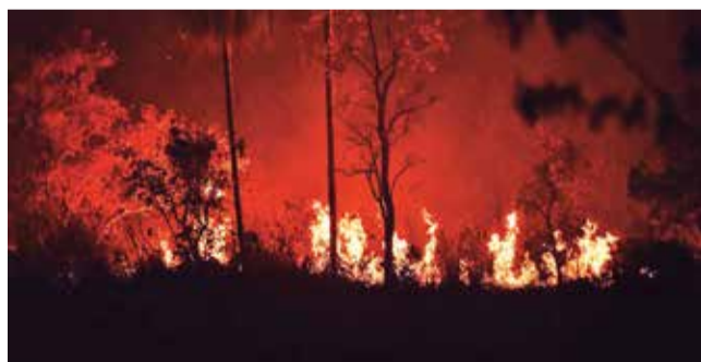
Incendio en un municipio de Santa Cruz.

Imparable. También hay reportes de intensos focos de calor en los departamentos de Beni, Pando y La Paz (Inquisivi)