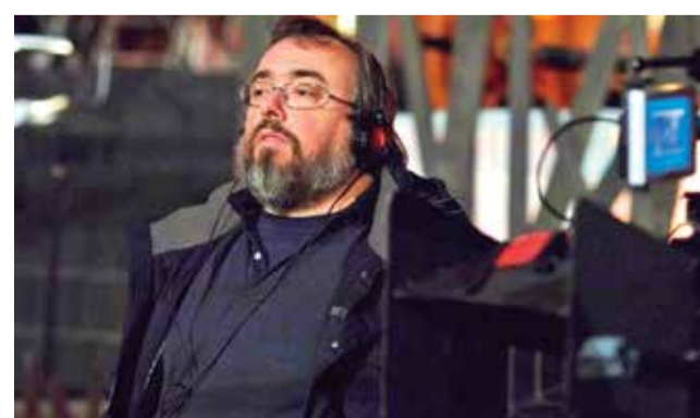
El cineasta español Álex de la Iglesia.

El ciclo comenzó el pasado martes con la proyección de Acción mutante (1993). Este martes 20 de agosto, el ciclo continúa con La comunidad (2000), una comedia negra que promete mantener al público al borde del asiento. La trama, que gira en torno a la codicia y el caos dentro de