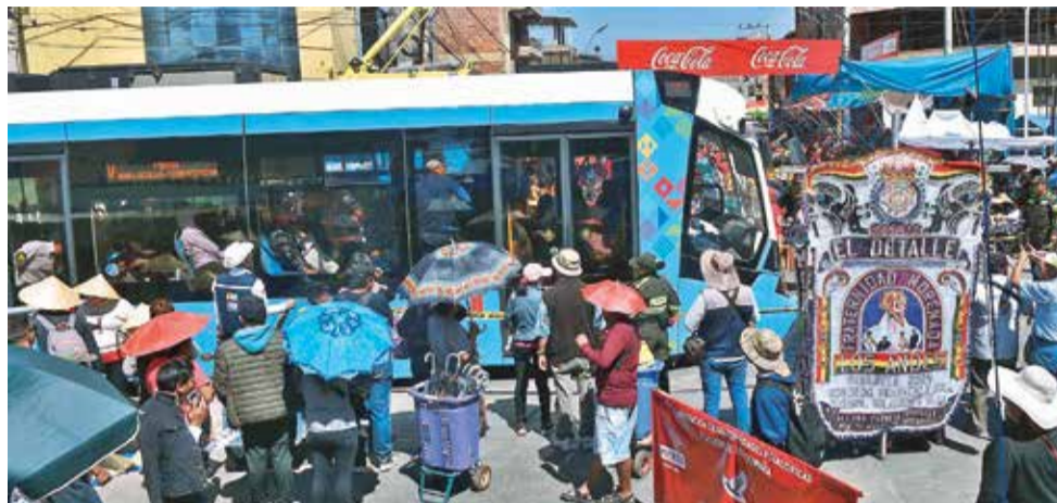
El tren metropolitano durante un viaje de Quillacollo por Urkupiña. JOSÉ ROCHA

Quillacollo desde la estación central de San Antonio hasta Quillacollo es de 4 bolivianos y el diferenciado para niños, estudiantes y otros grupos vulnerables es de 2 bolivianos.