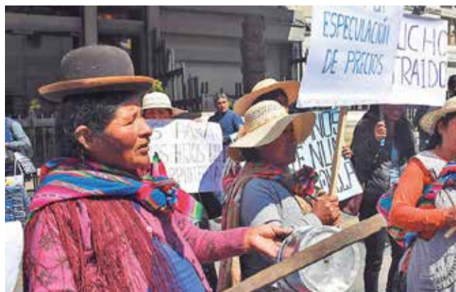
Gremiales marchan en la ciudad de La Paz, ayer.

Planificación. El miércoles se reunirán en Santa Cruz para coordinar la fecha exacta y el apoyo de otros sectores, señaló un dirigente