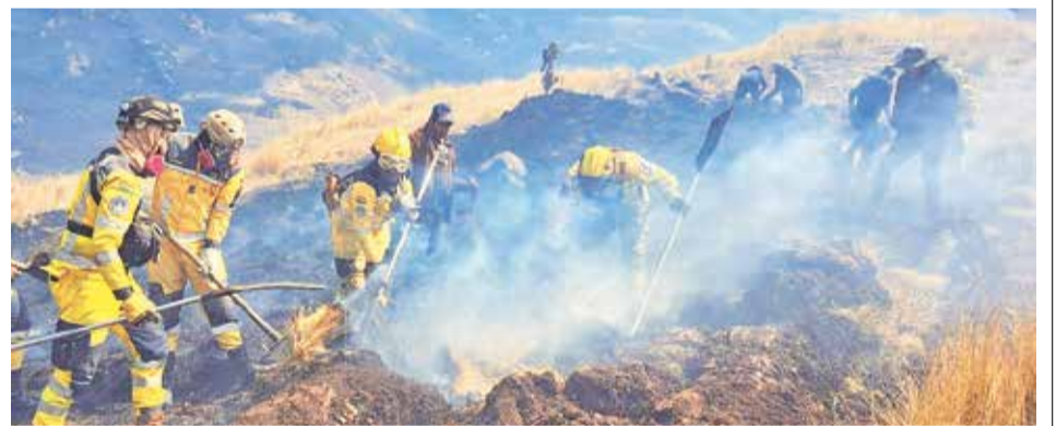
El incendio que se registró en el municipio de Morochata.

Los simulacros comenzaron tras registrarse un sismo de 4,6 grados de intensidad en la ciudad, el 24 de julio. Ante la inquietud en la población, las autoridades fortalecen la cultura de prevención, considerando que cada mes, Cochabamba reporta 18 sismos superficiales.