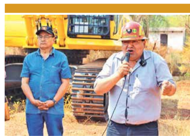
El ministro Alejandro Santos en su discurso. MIN MINERÍA

En su opinión, deberían eliminarse algunos ministerios, como el de Obras Públicas, Relaciones Exteriores, Presidencia, Trabajo y Culturas, así como el Vice-ministerio de Deporte.