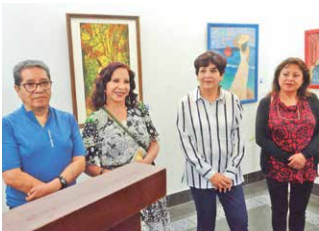
Obras montadas en el salón Gíldaro Antezana y público asistente, ayer durante la inauguración.