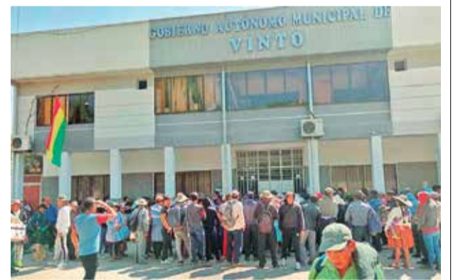
La protesta por obras en Vinto, ayer.