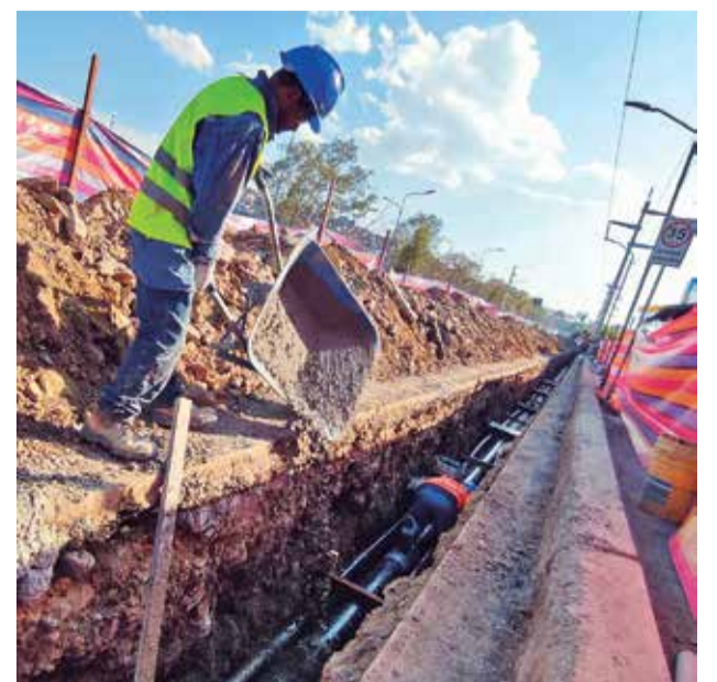
La excavación de zanjas para línea de alta tensión. D.JAMES

“Este tipo de proyectos subterráneos serán cada vez más comunes en áreas urbanas”, adelantó el gerente general de Elfec.