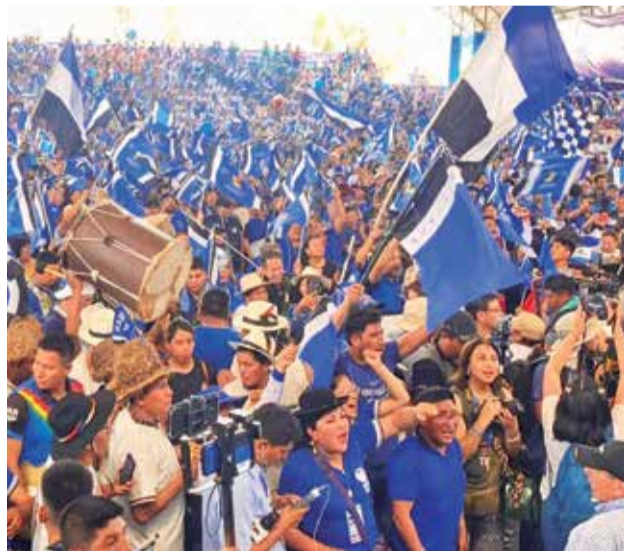
El congreso del MAS evista de 2023 en Lauca Ñ.

“Nosotros estamos aquí para pronunciarnos. Exigir al TSE que se pronuncie y diga si irá a supervisar el congreso del 3 de septiembre. Todo eso es nuestro pedido, nuestra exigencia de Santa Cruz, por eso estamos presentes en las puertas del TSE. Caso contrario, el TSE no nos escucha a nosotros, no nos respetará