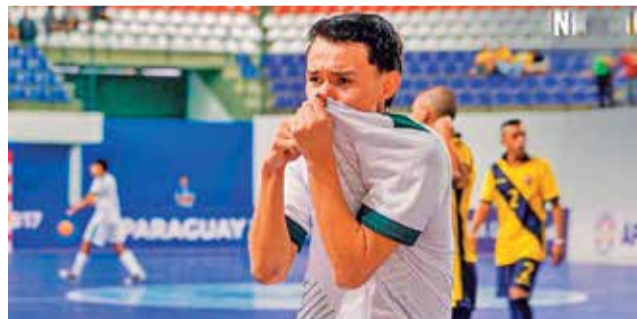
Bolivia festeja la victoria sobre Ecuador, ayer.

En Paraguay. La Verde venció por 6-9 a su par ecuatoriano para colocarse entre los líderes del grupo A tras sumar seis unidades