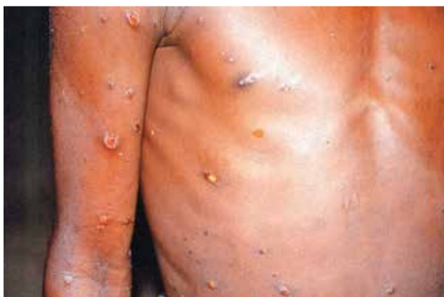
Las ampollas que brotan por la viruela símica.

Cruz recordó que el brote de la viruela símica registrado en 2022 a nivel mundial llegó a Bolivia, donde se reportaron más de una decena de casos importados. Hace unos días