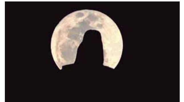
La superluna en Cochabamba, vista por detrás del Cristo de la Concordia, anoche.