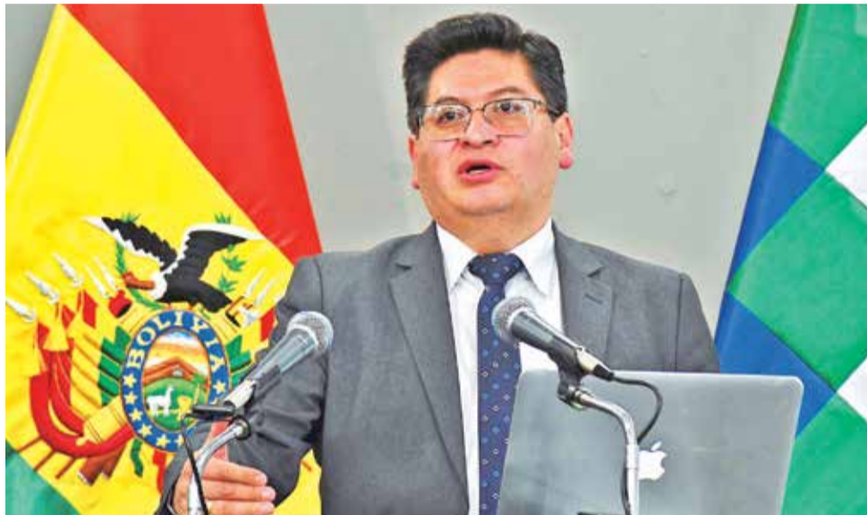
El ministro de Economía y Finanzas Públicas, Marcelo Montenegro.

Franz Apaza, viceministro de Pensiones y Servicios Financieros, compartió la preocupación del ministro Montenegro y destacó la coincidencia entre el Gobierno y el sector privado en cuanto a la urgencia de desbloquear los créditos externos. Apaza subrayó que estos recursos son vitales para introducir divisas en la economía boliviana y que el sector privado está dispuesto a gestionar ante la Asamblea Legislativa para viabilizar su aprobación.