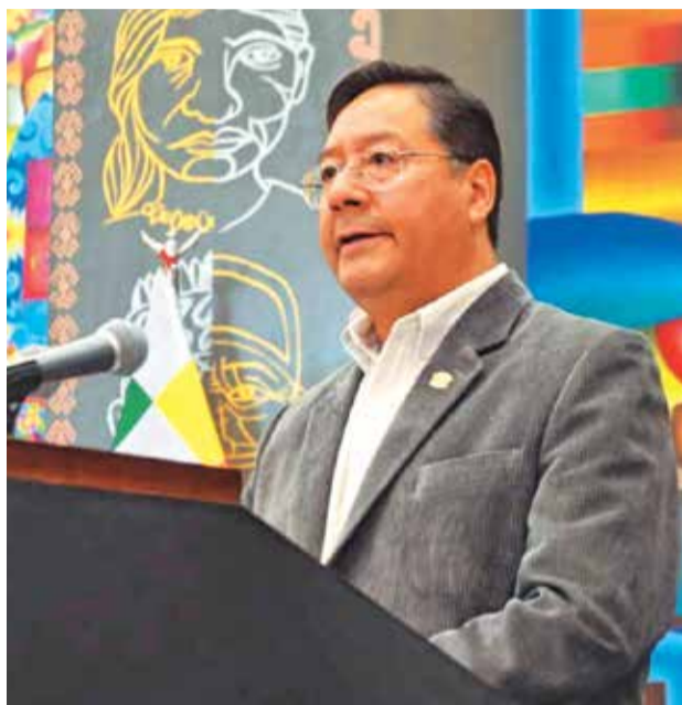
El presidente del Estado, Luis Arce.

El expresidente Evo Morales se mostró, desde el día de la reunión multipartidaria, en contra de suspender las elecciones primarias y culpó al bloque de parlamentarios afines al presidente